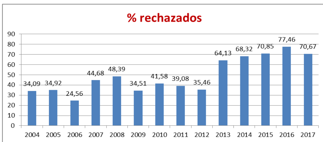
[Evolution of the % manuscript rejected in Anales de Psicología]