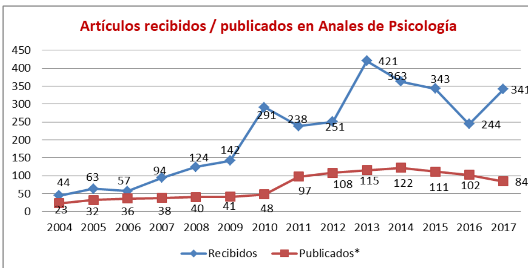
[Evolution of number of articles received / published in Anales de Psicología]