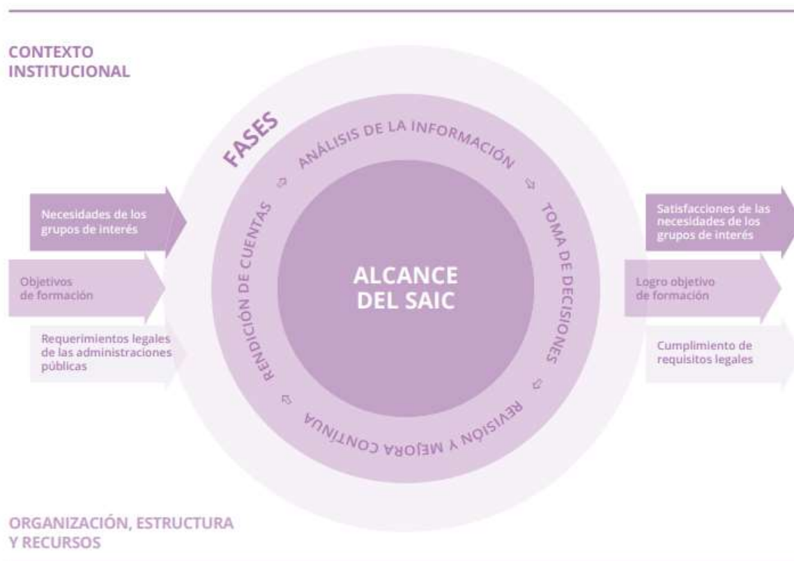
Figura 1. Interrelación de elementos a considerar en el alcance del Modelo.

Considerando tanto los objetivos antes mencionados como los objetivos del SAIC y tomando como base las directrices del Programa AUDIT Internacional, en su versión 2022 , los procesos identificados, así como las relaciones entre ellos, configuran el mapa de procesos, cuya descripción pormenorizada se lleva a cabo en el Manual de Procedimientos del SAIC.