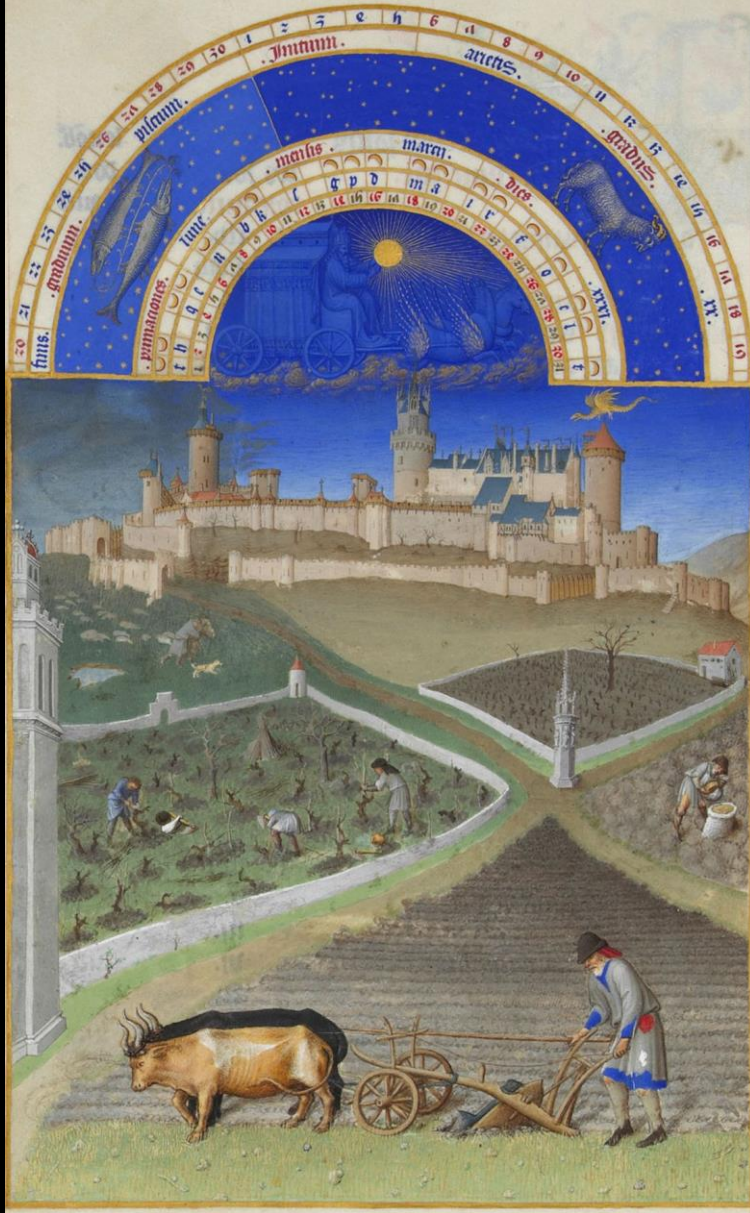
Hermanos Limbourg, Mes de Marzo en Las muy Ricas Horas del Duque de Berry . 1411-1416. Museo Condé.