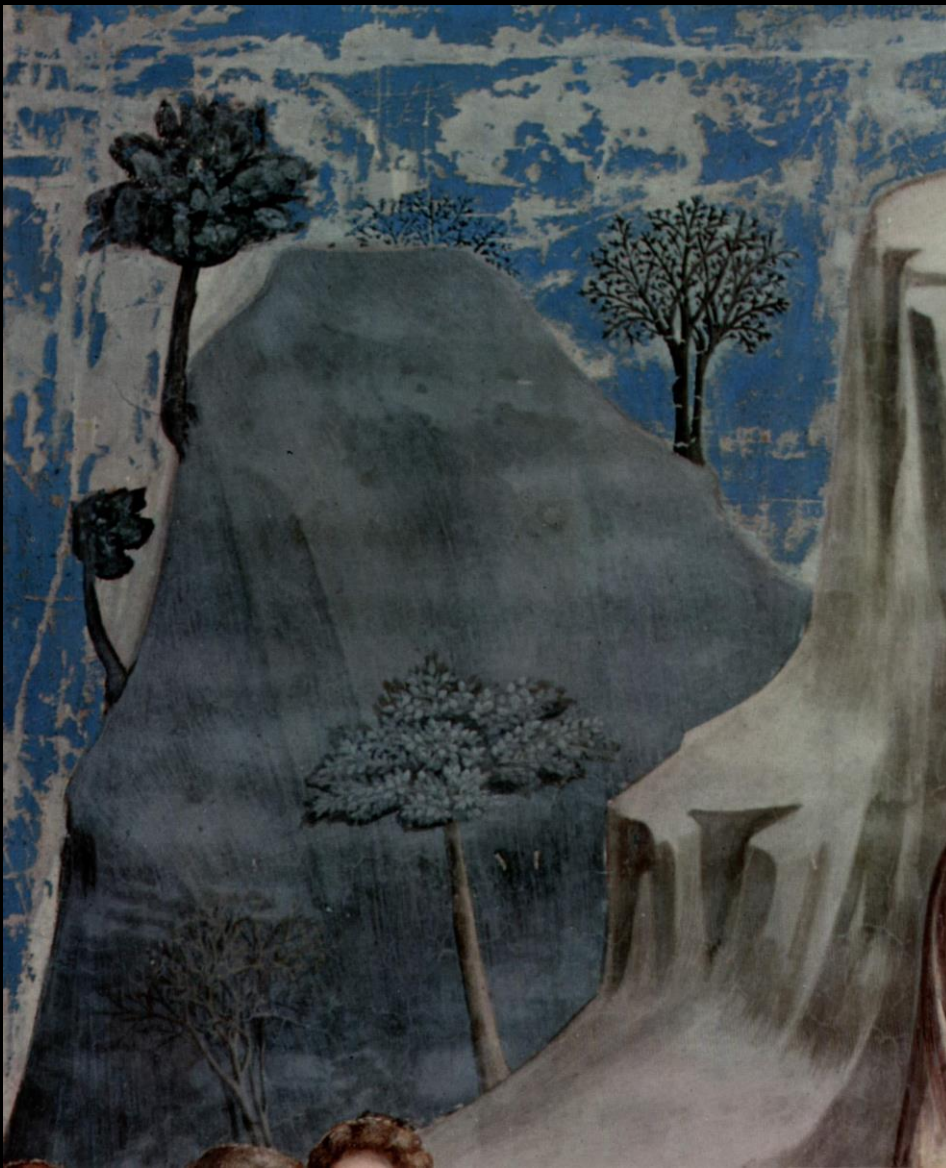
Giotto. Detalle de La huída a Egipto , Capilla de los Scrovegni. Fresco. 1304, Padua.