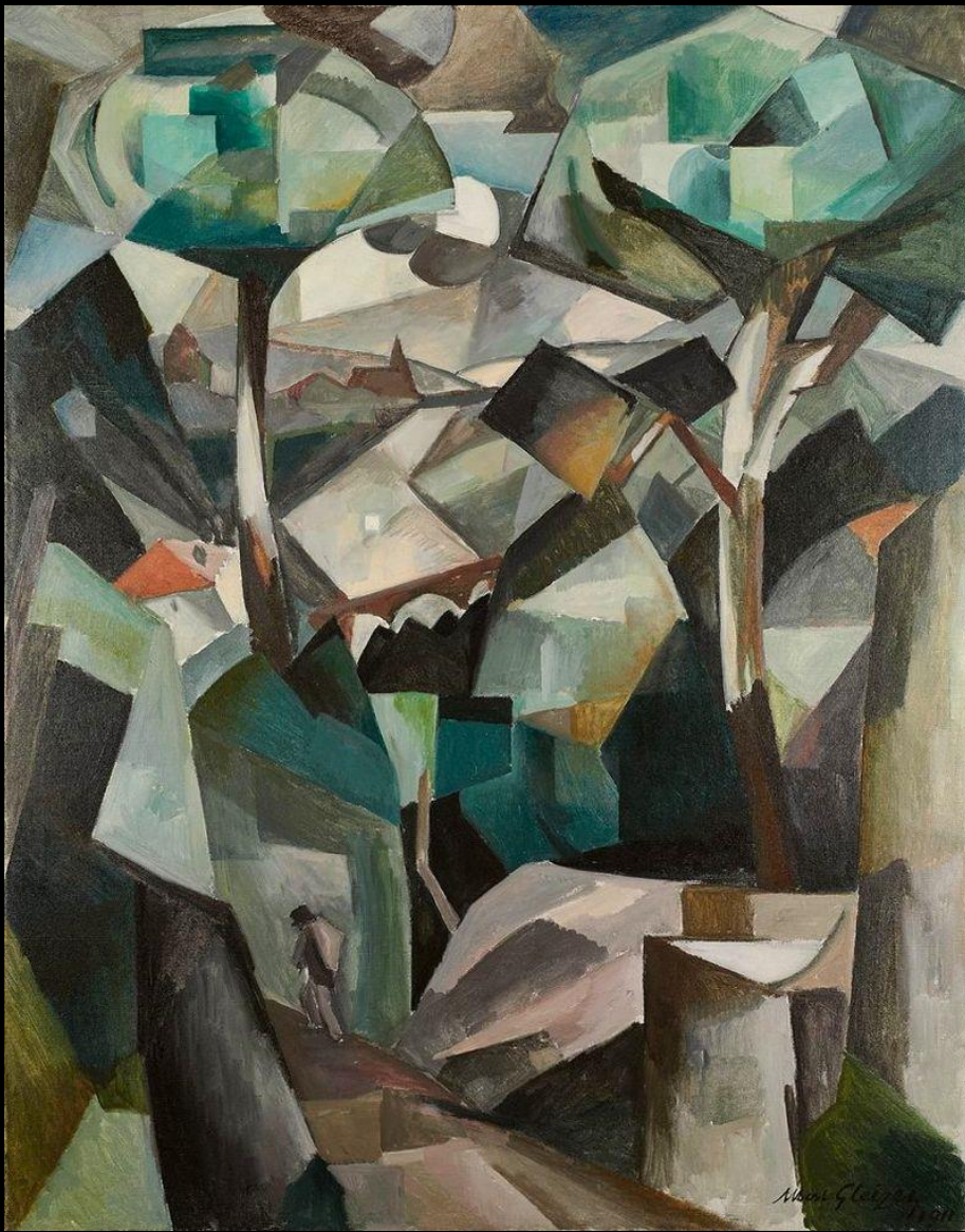
Albert Gleizes, Paisaje con personaje . 1911 . Óleo sobre lienzo, 146.4 × 114.4 cm