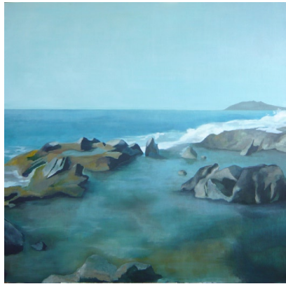
Silvia Mendoza Vera

El austero régimen de lluvias, y las temperaturas elevadas del estío convierte a este punto de la costa cálida en uno de los más duros para la supervivencia de las plantas. Aquí podemos encontrar algunas de las especies más curiosas, especialistas en supervivencia; plantas como el cornical, el aufaifo o el arto, presentes también en el norte de África, y que se han adaptado a las extremas condiciones ambientales, conformando unos matorrales singulares, difíciles de encontrar fuera de nuestra Región.