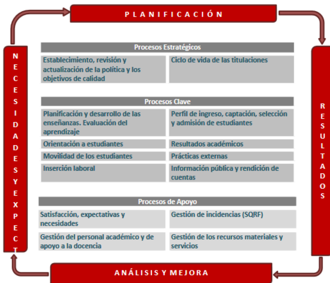
Figura 1. Mapa de Procesos del Sistema Aseguramiento Interno de Calidad.

ISEN CENTRO UNIVERSITARIO, FACULTAD ADSCRITA A LA UNIVERSIDAD DE MURCIA