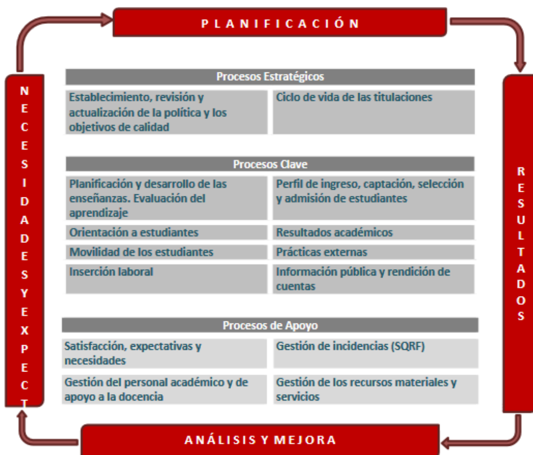
Figura 1. Mapa de Procesos del Sistema Aseguramiento Interno de Calidad.

El Programa de Orientación y tutoría, en el caso de ISEN Centro Universitario, consta de: