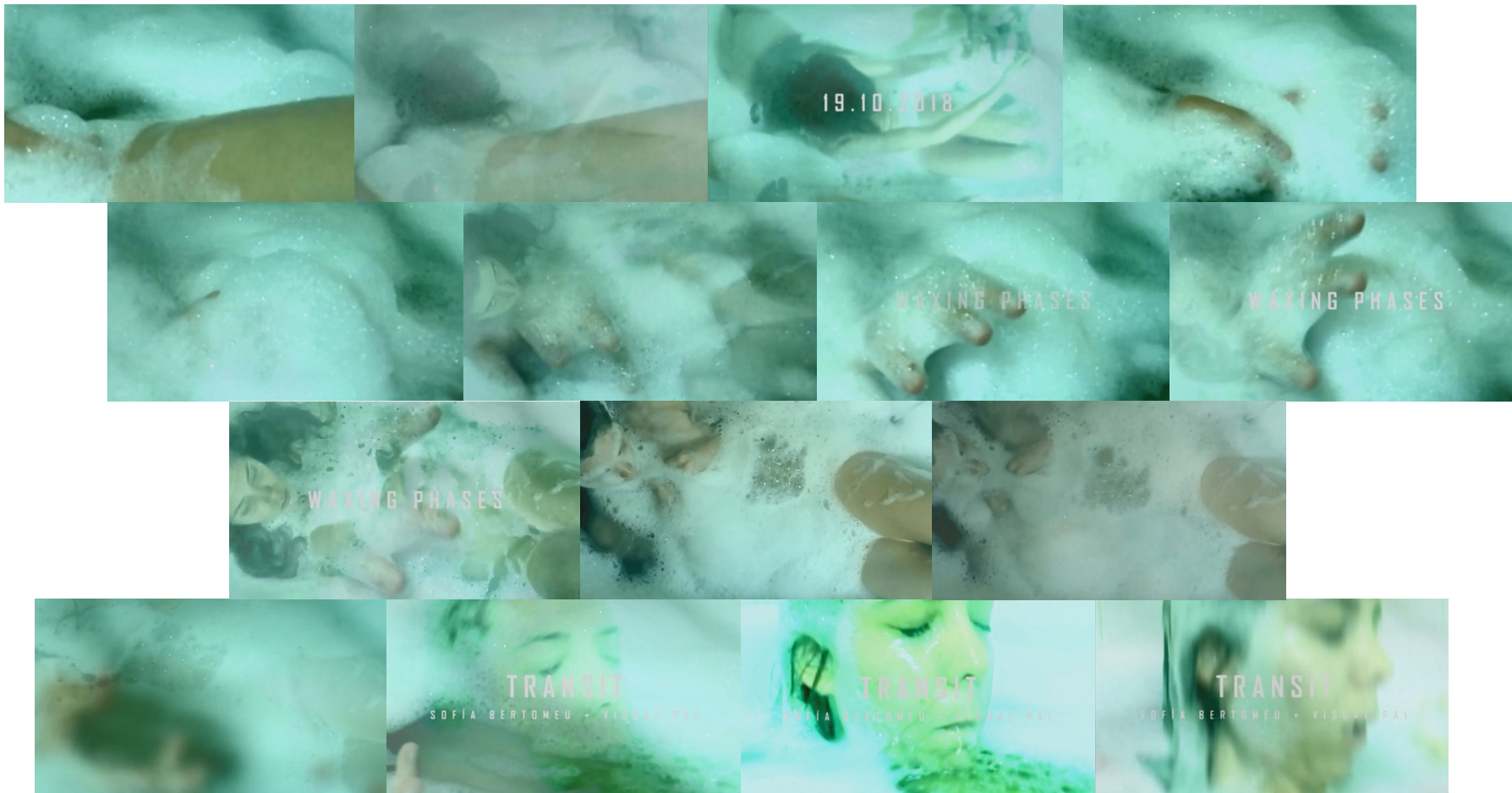
Transit (2018) Video 5:19 min

El tránsito. Obra realizada con motivo de la colaboración audiovisual que tuvo lugar en Acud Macht Neu (Berlin) en octubre de 2018 junto a Visual Pal.