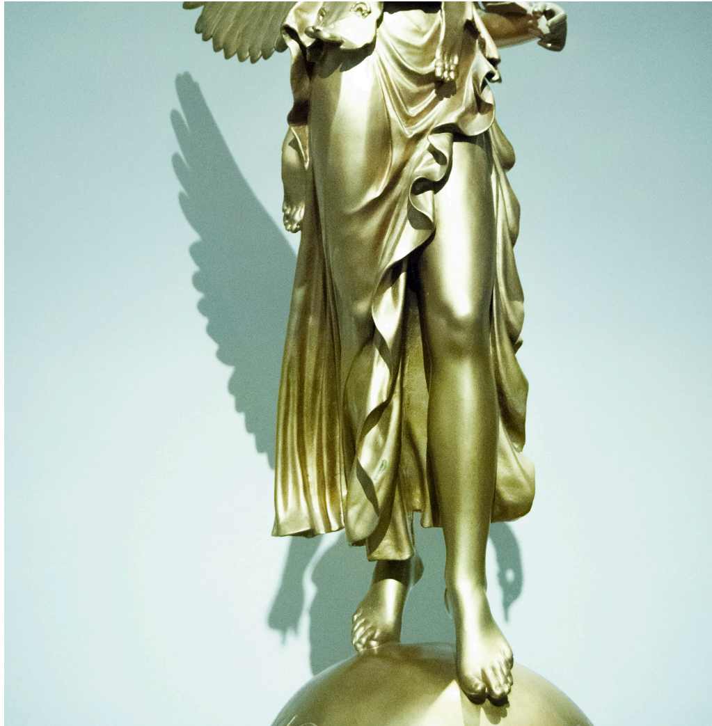
Inmaculada Concepción (2018) Pieza sonora (Sound art) 3:57 min