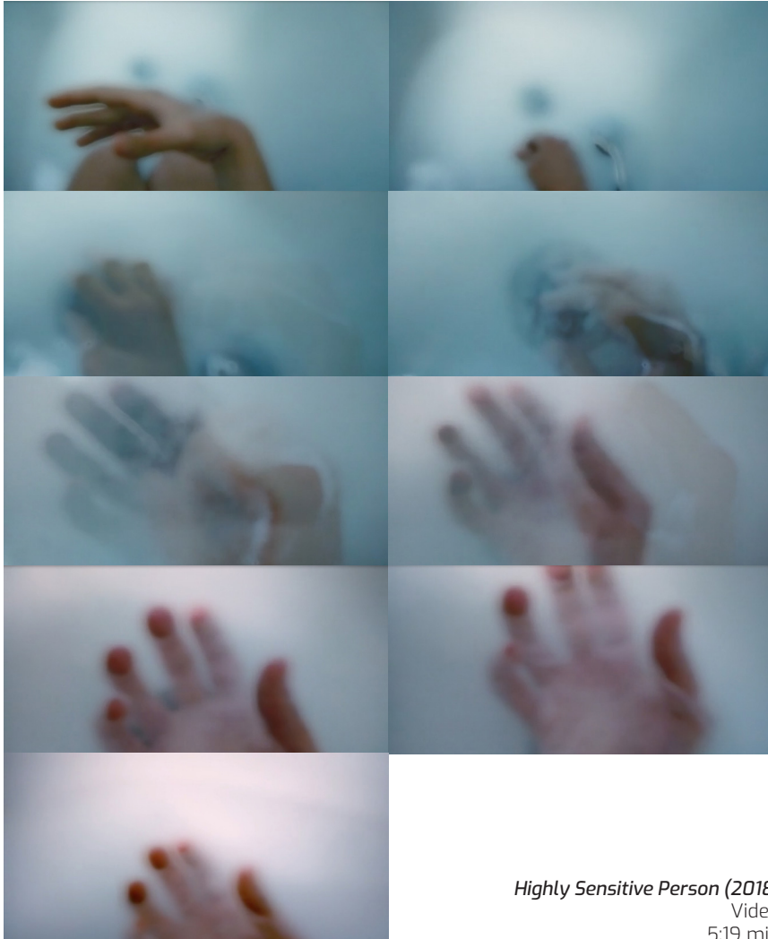
Highly Sensitive Person (2018) Video 5:19 min

Una obra que retrata el proceso del "sentir" de las personas altamente sensibles.