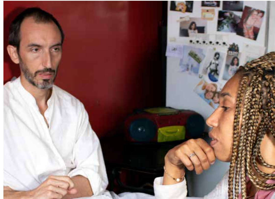
Don Quijote escuchando. Ubicación: Universidad Americana de París

This session demonstrates the helpfulness of listening, the need for it, even when it is difficult, almost unbearable. It is a counteracting of the repetition of abuse and violence, with its automatic return of it. Instead, listening may sharpen therapeutic and poetic faculties that indirectly helps the listener to overcome his or her own traumatic state, or that of people around her. It can be seen in connection with episode 9, where attempts to listen utterly fail.