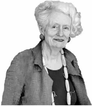
MIEKE BAL (Heemstede, Países Bajos, 1946)

Teórica cultural, crítica de arte y video artista. Profesora emérita de la cátedra de Teoría Literaria de la Universidad de Ámsterdam. En 2017 recibió el Premio Akademietoeloozen "Ridder in de Orde van de Nederlandse Leeuw" ( Caballero de la Orden del León Holandés ). Es cuatro veces Doctora Honoris causa. En Artes por la Universidad de las Artes de Londres en 2019. Doctora honoris causa en filosofía por la Universidad de Helsinki 2019. Doctor Honoris Causa por la Universidad de Bergen en Noruega 1996. Doctor Honoris Causa en humanidades y ciencias sociales por la Universidad de Lucerna en Suiza 2016. Y en enero de 2020 recibirá un nuevo reconocimiento en la Universidad de Linneo en Suecia.