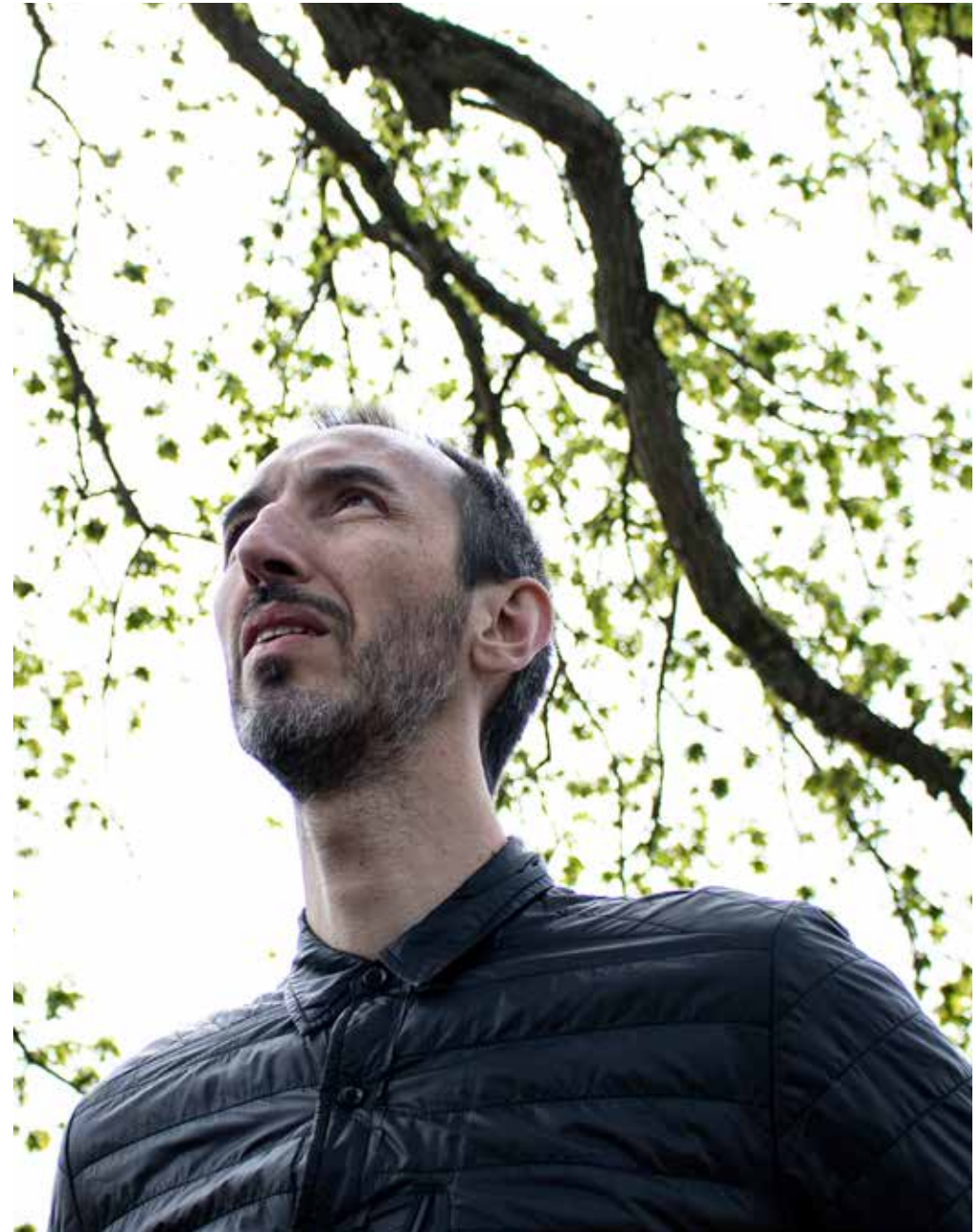
El Cautivo escapa, o lo sueña. Ubicación: Slott/ Castillo Ruina en Kronoberg.

The Captive's Tale that fills three chapters (39-41) is not being told. There is a story, but it is kept away, to avoid the redundancy that would turn images into illustrations. Instead we see the images of captivity, which remain silent. The telling of the Captive's story may be presented on an audio tape, juxtaposed to the silent scene at some distance. It is told, not enacted. The images of the silent scene have no direct bearing on the story; they are not "illustrations". The somewhat long and even tedious story-telling should give a sense of the relative futility of story-telling in the face of the situations and events we see. The images are fragments of memories of captivity. Standing behind bars, grabbing the bars, the images suggest the dilution and disappearance of the character and of the cinematic image. Other images that signify captivity and the possibility of liberation, such as, for example, hugging a tree and looking at the sky, are offered to the visitor to interpret.