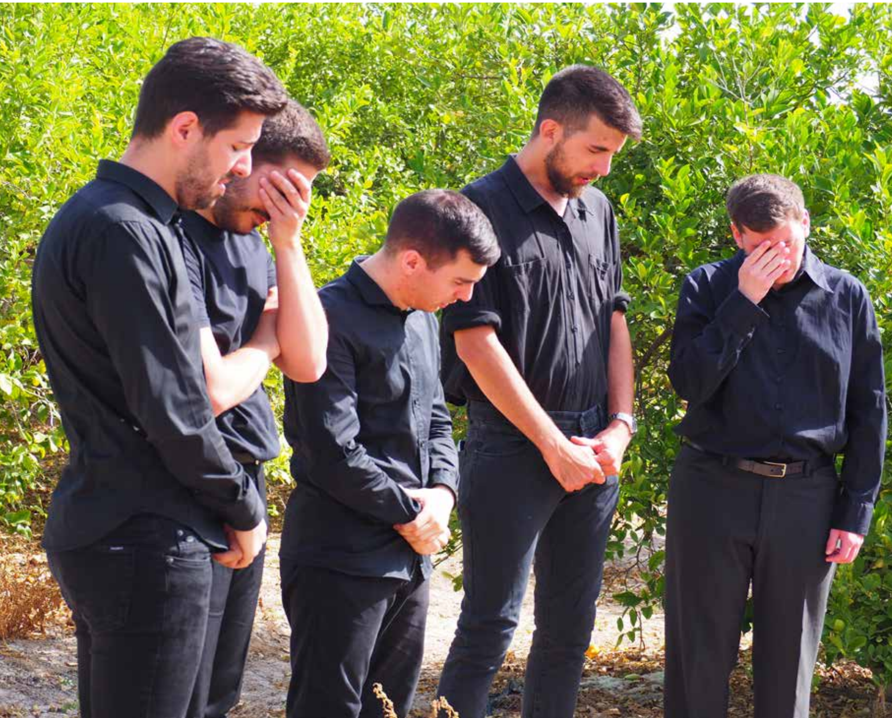
Los dolientes lloran por el suicidio de Crisóstomo. Ubicación: Huerto de limoneros a las afueras de Murcia.