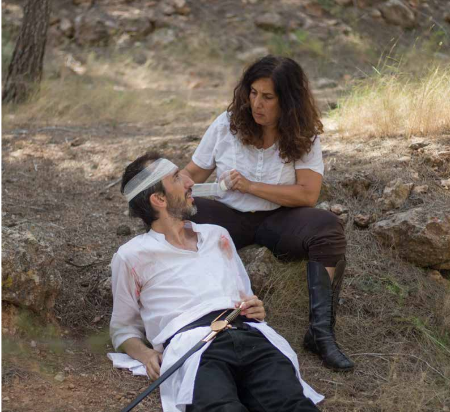
Sancho (Viviana Moin) y Don Quijote, cuidando, sufriendo y conversando. Lugar: "paisaje lunar" cerca de Murcia