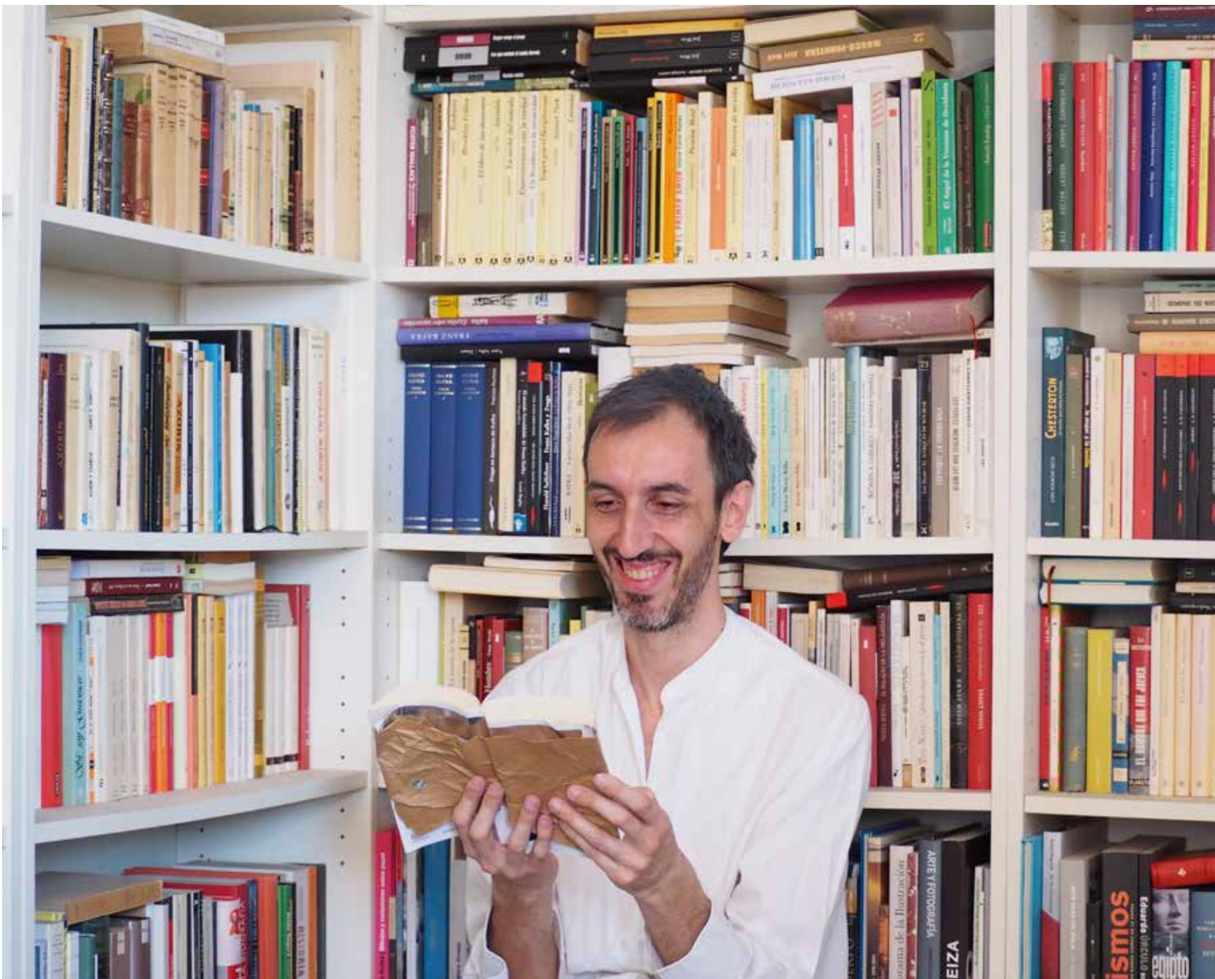
Don Quijote leyendo, Mathieu Montanier. Ubicación: casa de Javier Castro Flórez