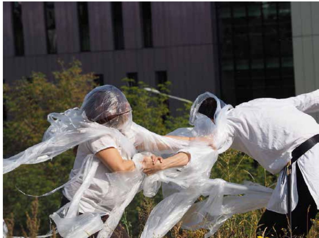
La lucha contra el agua se convierte en una lucha contra el plástico. Ubicación: Porte des Lilas, la plaza que cubre el "autovía periférica"

Don Quijote almost drowning. Location: Porte des Lilas, the square that covers the "auto-route périphérique"