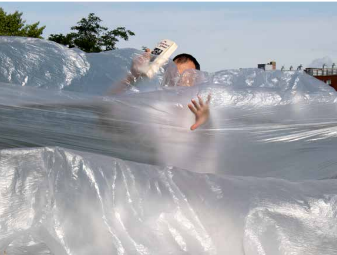
Don Quijote casi ahogándose. Ubicación: Porte des Lilas, la plaza que cubre la "autovía periférica"

Don Quijote almost drowning. Location: Porte des Lilas, the square that covers the "auto-route périphérique"