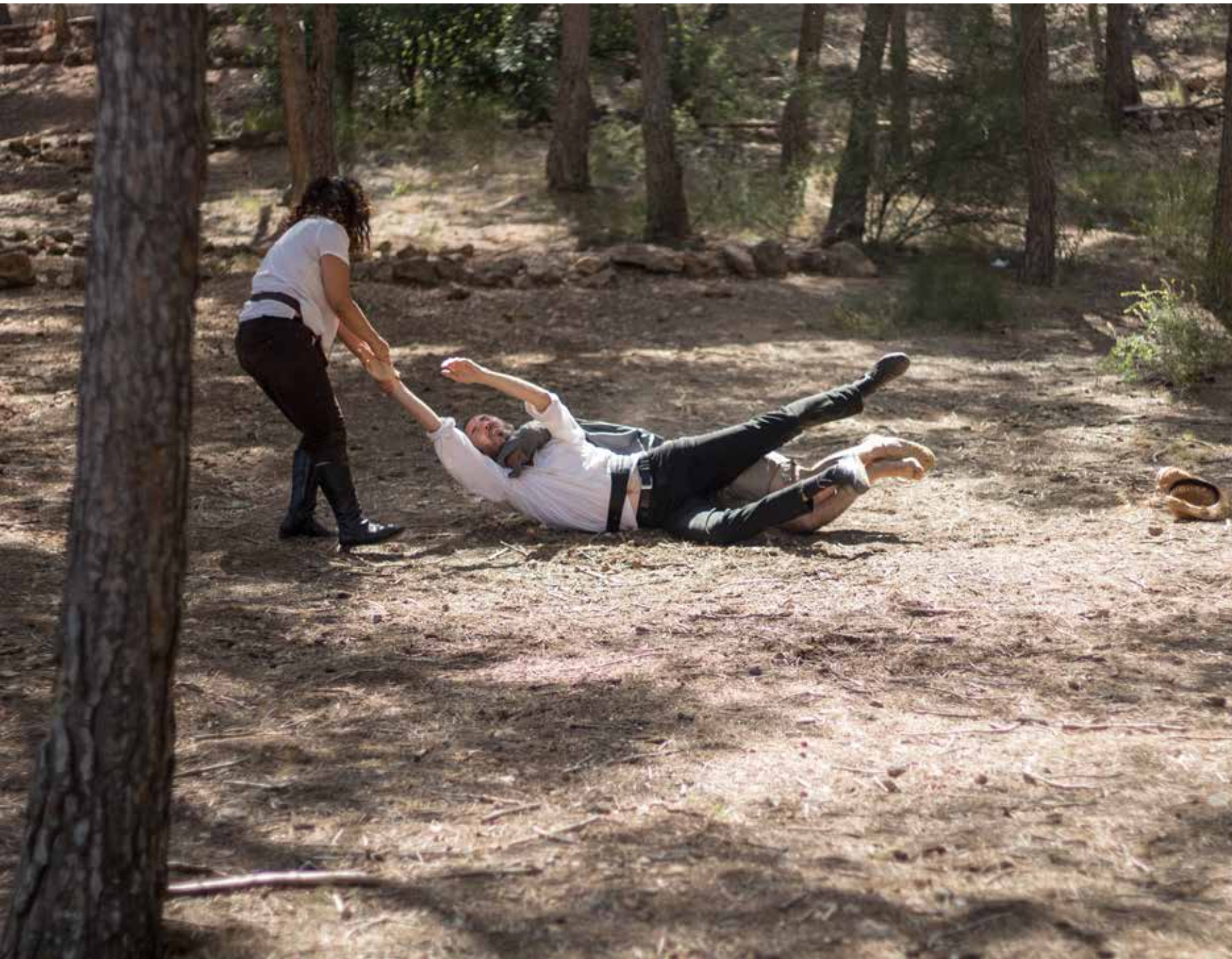
Don Quijote atacado por Cardenio (Theor Román), defendido por Sancho Panza. Ubicación: "paisaje lunar" cerca de Murcia