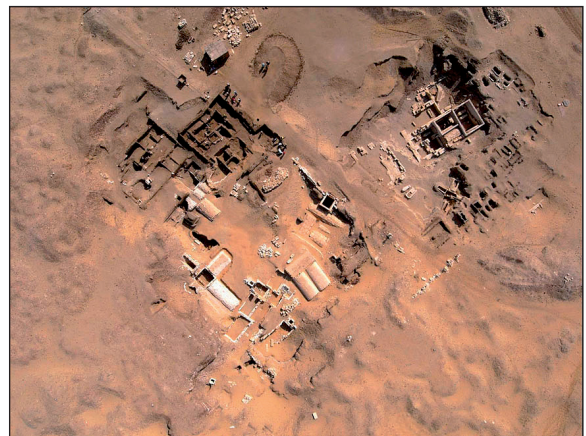
Figura 5. Vista aérea de la Necrópolis Alta.

Los trabajos realizados en los últimos años (PADRÓ et al. , 2015; 2014; 2013; 2012), (ERROUX-MORFIN, M. y PADRÓ, J., 2007) o (PADRÓ, 2006) han permitido en la Necrópolis Alta conocer con detalle este tipo de enterramientos Saítas. La excavación de la tumba 1 (PADRÓ, 2014) han documentado el sistema constructivo, consistente en una tumba compleja, de bloques de piedra blanca trabajados con detalle y cámaras cubiertas con bóvedas de cañón. Es por tanto una tumba familiar en la que se enterraban sarcófagos antropomorfos con inscripciones jeroglíficas. También tenemos otras tumbas importantes como la 13 y la 14, siendo esta última la mayor encontrada hasta ahora, todas ellas estudiadas por Castellano (2007).