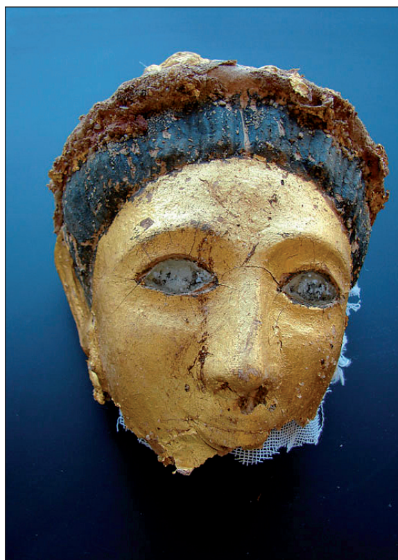
Figura 8. Máscara funeraria de momia de mujer de época romana.

En cuanto a la configuración de la ciudad, los restos actuales están arrasados y en mal estado, debido en parte a la subida del nivel freático, a pesar de esto se han llevado a cabo en ella estudios mediante prospecciones, sondeos arqueológicos, georadar y fotografía aérea para poder compararlos con la información aportada por los papiros, así como la documentación de las excavaciones anteriores.