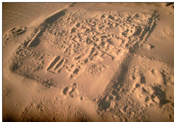
Figura 10. Vista aérea de la Fortaleza.

Estas estructuras que se aprecian en las fotografías aéreas de todas las zonas de suburbios de la ciudad son zonas de producción que ya a partir del siglo V d.C. parecen dar lugar