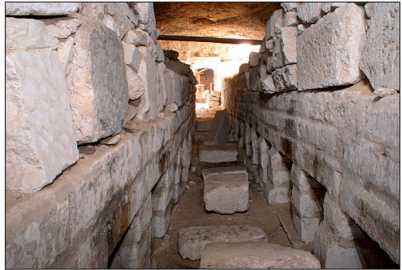
Figura 7. Galería subterránea de nichos del Osireion.

Al este podemos destacar otro elemento de gran importancia para la ciudad como es la puerta monumental de cronología Ptolemaica, reaprovechada posteriormente por la mezquita Zain al-Abidin, como parte de sus muros.