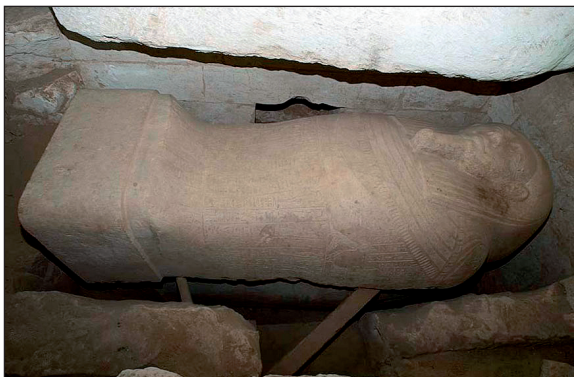
Figura 4. Sarcófago de Heret.

A partir de este momento las relaciones comerciales facilitaron la llegada a tierras egipcias de materias primas, fundamentalmente metal, a través de fenicios y griegos.