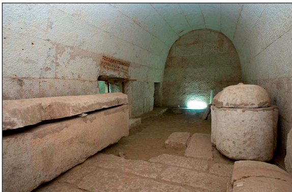
Figura 3. Interior Tumba 1.

Tras el fin del Imperio Asirio se reestablecen los contactos comerciales con los fenicios y Tiro, así como con los griegos, produciéndose en el reinado de Psamético I la fundación de la factoría de Naucratis, en el Delta y próxima a Sais, capital ahora de Egipto. El desarrollo de las relaciones económicas, políticas y culturales entre Egipto y las ciudades griegas y el Asia Menor es el resultado claro de la presencia de numerosos inmigrantes procedentes de estas tierras en el país de los faraones (BARD, 2005). Es evidente como apunta Manning (2009) que el renacimiento Saíta supone una transformación de Egipto y del marco del Mediterráneo, sobre todo en cuanto a los acontecimientos posteriores con los griegos, su relación y dependencia.