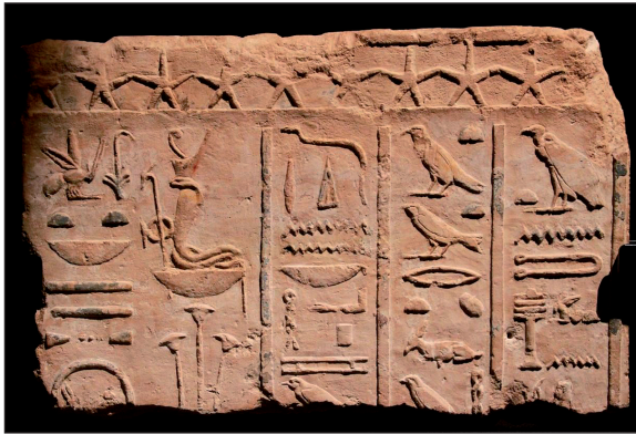
Figura 6. Bajorrelieve del Per-Khef de Oxirrincó. Comienzo de la época ptolemaica (323-310 a.C.). Museo de Besançon.

Del tipo de construcciones apenas tenemos datos más que de los paralelos de otras excavaciones llevadas a cabo en el Delta, el Sinaí, o Tebtunis y que pertenecientes a este periodo nos aportan información de como pueden ser las casas de la ciudad de Oxirrincó a falta de excavaciones más exhaustivas en el núcleo urbano de la ciudad pero que seguro aportan datos no solo del tramado urbano de época greco-romana como la fase más evidente, sino también de las fase de fundación previa Saíta y que respondería a un planteamiento orgánico de la ciudad previo al ortogonal sucesor.