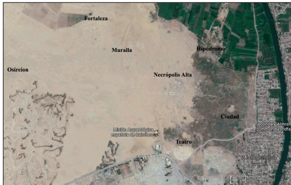
Figura 2. Construcciones principales de la ciudad.

rólogos Grenfell y Hunt, quienes también diseñarán un primer plano de la ciudad.