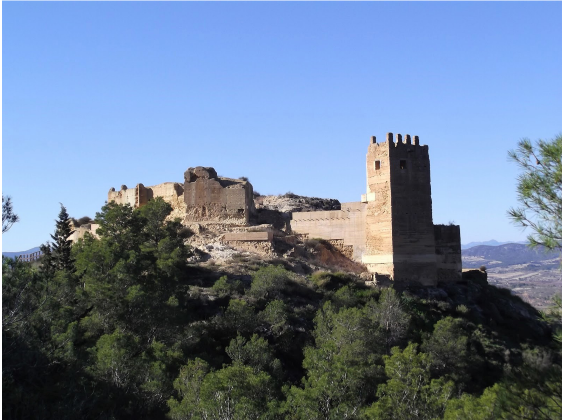
Figura 7. Castillo de Pliego. Fuente: Amigos de los castillos.

La gran mayoría de los castillos medievales, por no decir todos de la Región de Murcia, tienen como una de sus características principales que el origen de la fortaleza cristiana siempre está precedido por una fortaleza islámica de época anterior. Al contrario que puede suceder en otras partes de la Península donde no siempre es así. Esto es normal si analizamos la poliorcética medieval de la Región desde un punto de vista geográfico, por el cual observamos una fuerte presencia islámica en este territorio durante siglos, lo que da lugar a que se consolide plenamente el asentamiento de esta cultura en el territorio y, por tanto, se interiorice en épocas posteriores todo tipo de características de su cultura. En el caso de los castillos, se advierte claras diferencias constructivas entre los que se edificaban en el resto de Europa y los de la Península Ibérica, partiendo de una influencia claramente oriental a raíz de la presencia islámica en el territorio; esto se puede reflejar por ejemplo en la generalización del uso del acceso en recodo en la Península y mucho menos utilizado en el resto de Europa.