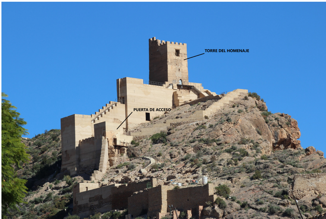
Figura 5. Castillo de Alhama donde se aprecia la puerta de acceso y la torre del homenaje. Autor: Martinvl. Editado con Paint3D.

llega a 1,20m 117 . Además, para acceder a este acceso en recodo que se encontraba a una cota muy superior respecto al suelo, era necesario un puente levadizo que se apoyaba en dos pequeños muros que existían junto a la puerta 118 ; que al igual que en el castillo de Moratalla se evidencia el uso que se le da a este tipo de estructuras defensivas en la Península Ibérica, más como elementos para compartimentar el interior de la fortificación 119 . En este recinto se ha conservado de mejor forma la muralla más antigua de la fortificación, que lo más posible perteneciese a la época almohade del castillo, lo que quiere decir, que, anteriormente, en época de las taifas el albacar se encontraba exento de construcciones 120 . En época bajo medieval, se pueden relacionar las reformas que acometió Alfonso XI con antigua puerta de acceso, que quedó tapiada. La puerta fue desplazada a una torre nueva que situaba más adelantada que la anterior y se creó el acceso en recodo 121 .