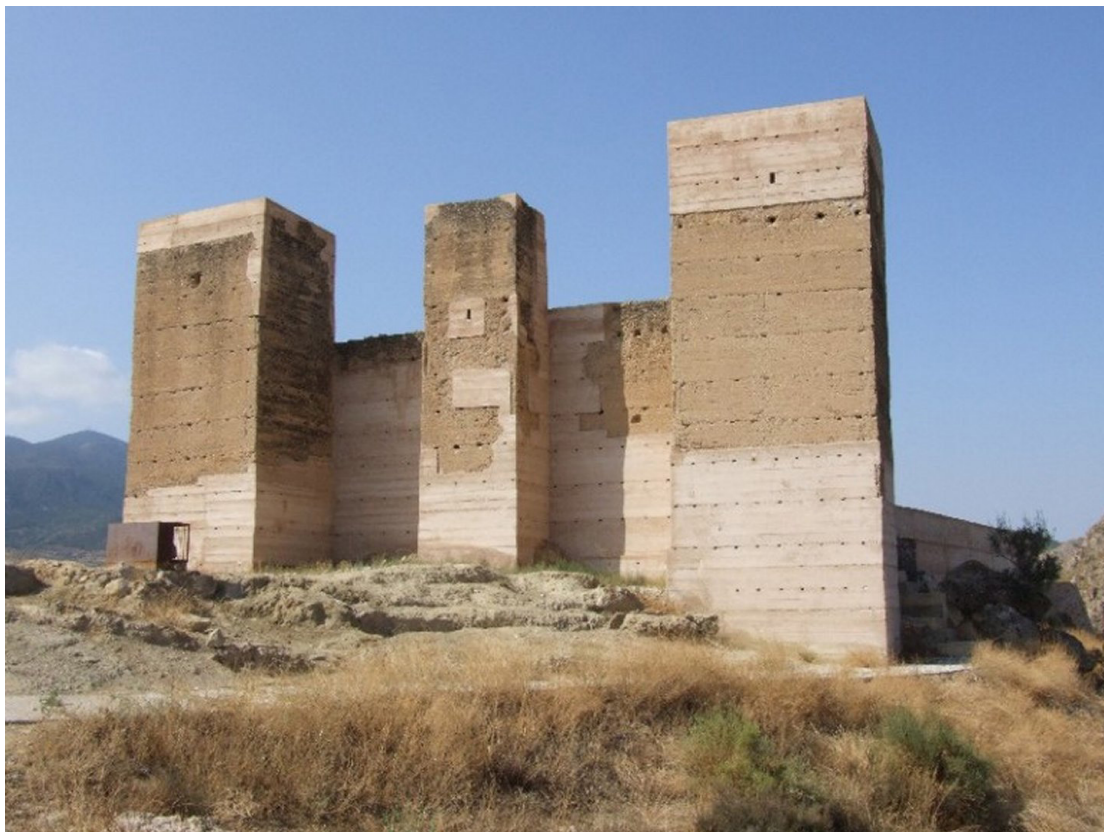
Figura 6. Castillo de Blanca donde se observa el retranqueo de la torre central.

haciéndose fuerte en el castillo de Blanca 125 . En 1285, Sancho IV otorgó en 1285, tras la conquista del territorio, la administración del castillo a la Orden de Santiago, que se centraron en mejorar la productividad de las tierras y convertir al cristianismo a los habitantes de la zona 126 .