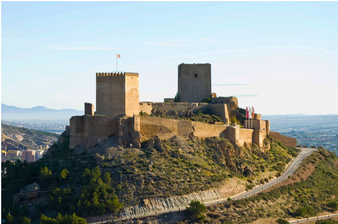
Figura 4. A la izquierda se observa la torre del espolón y a la derecha la Torre Alfonsina o Torre del Homenaje. Autor: José Lorca.

Sobre el adarve de la muralla, sucede lo mismo que en el castillo de Caravaca de la Cruz y lo contrario que en el de Moratalla. Este se encuentra a la misma altura que el suelo del interior de la fortificación, debido a que la muralla está construida aprovechando la caída de la cima de la montaña hasta la ladera.