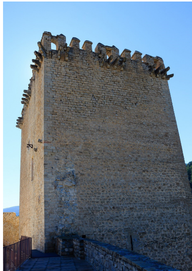
Figura 3. Torre del Homenaje del Castillo de Moratalla. Autor: Antonio. J. García.

Por último, nos centramos en la Torre del Homenaje (fig. 3). Como el resto de elementos defensivos, también aparece citada en los libros de visitas: “Tiene esta fortaleza al vn canto della, fazia el campo, vna maravillosa torre ds omenaje de cal e canto y de muy grueso muro, y tiene vna barrera entre ella e el cortijo” 81 . En esta ocasión no señala algunas características de la torre del homenaje como que está realizada de cal y canto y que presenta unos muros muy gruesos, con sillares de mayor tamaño en las esquinas para otorgar a la estructura de una mayor consistencia; para aumentar su defensa tiene una antemuralla interior que lo separa del resto de la fortaleza. A esto se le sumaba acceso a la torre del homenaje mediante un puente levadizo; como queda reseñado en las fuentes de 1498, hace mención a un puente levadizo que da acceso al propugnáculo “las otras quatro son de tapias con su azera de cal y petriladas e almenadas ellas” 82 . Este puente levadizo o puente retráctil, se trataría de una pasarela de madera sobre un foso frente a la puerta. Es un instrumento, está