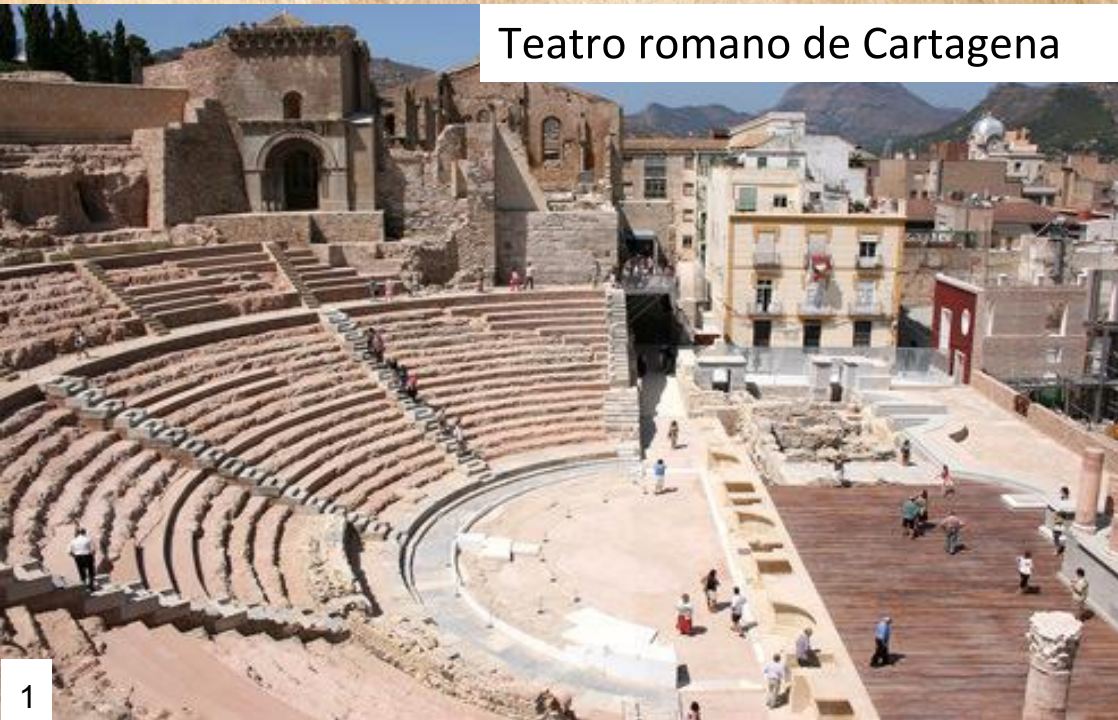
Teatro romano de Cartagena