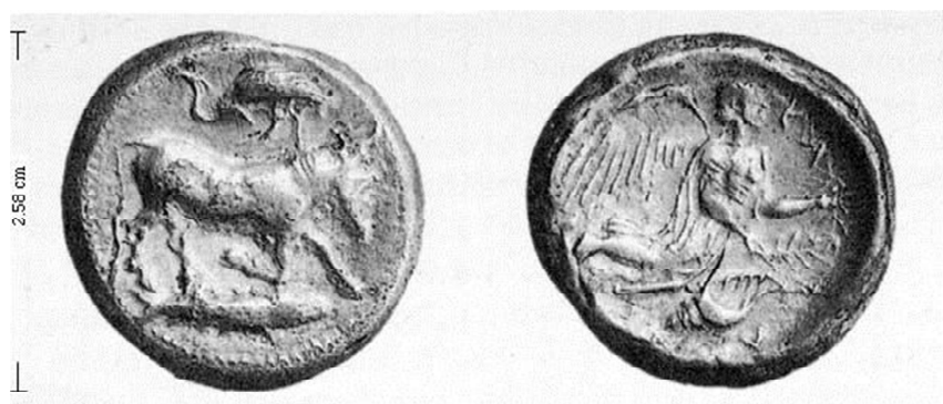
Figura 5. Tetradracma de Catania (464 a.C. – 450 a.C.).