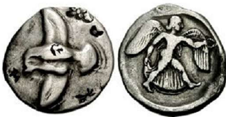
Figura 1. Estátera de Elis (468 a.C. – 452 a.C.).

En cuanto a sus atributos, la figura femenina porta entre otros elementos una corona de laurel, símbolo de la victoria, que en este caso, sería la victoria frente a la tiranía de Hierón y la recuperación de la ciudad para sus antiguos habitantes, cuya representación recuerda a las monedas coetáneas de Elis y Terina. (Fig. 1 y 2)