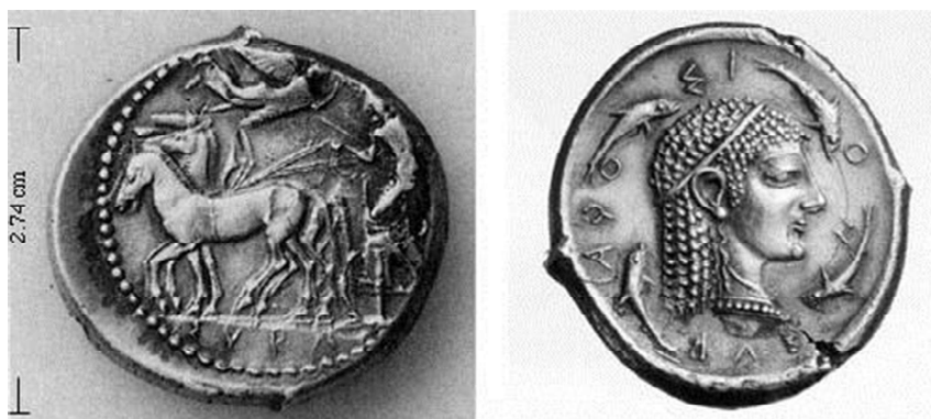
Figura 8. Tetradracma de Siracusa (485 a.C. – 470 a.C.).

esta clase siracusana poseedora de caballos, famosos en toda Grecia porque competían en los Juegos Olímpicos con muy buenos resultados.