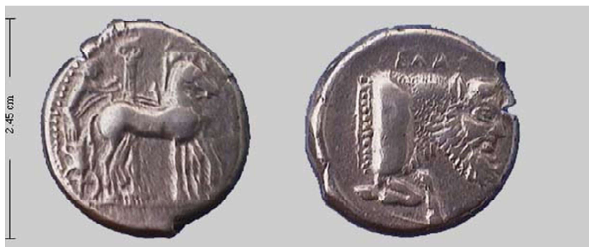
Figura 10. Tetradracma de Gela (465 a.C. – 450 a.C.).

y es sustituida por una columna jónica, otro elemento símbolo de la victoria, ya que Gela fue uno de los puntos geográficos desde donde se auspició (Jenkins, 1970, p. 53, n. 5) la caída de la tiranía. (Fig. 10)