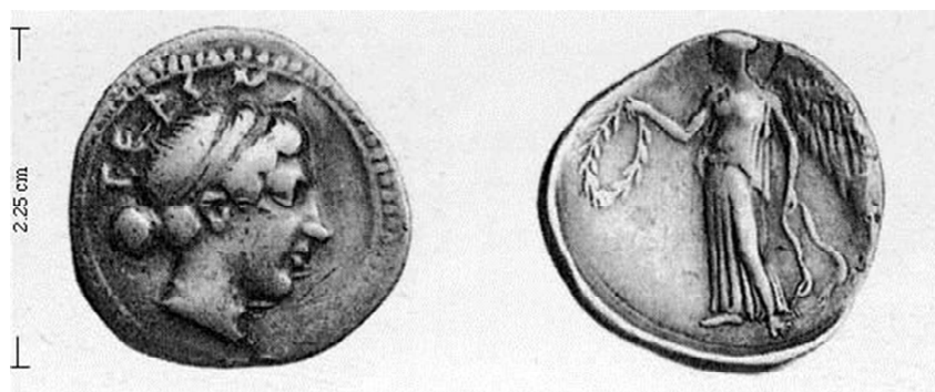
Figura 2. Estátera de Terina (460 a.C.). Imagen obtenida de http://www.magnagraecia.nl/coins/Bruttium_map/Terina_map/descrTer_HJ-003.html .

En otra de sus representaciones, ésta aparece portando dos hojas de palma, símbolo de la victoria, además de una caracola, elemento marino que conecta con el carácter costero de Catania, así como también aparece representada portando una banda como en los hemidracmas de Hímera. (Fig. 3)