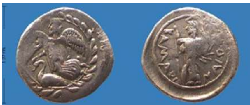
Figura 6. Litra de Camarina (460 a.C. – 430 a.C.).

Tras la refundación de Camarina en el 461 a.C. por Gela, la figura femenina alada aparece en sus acuñaciones. La relación con este hecho histórico de celebración estaría apoyada por la corona de laurel que rodea la escena junto con el cisne, elemento relacionado tanto con la ciudad de Camarina como con su ninfa epónima. (Fig. 6)