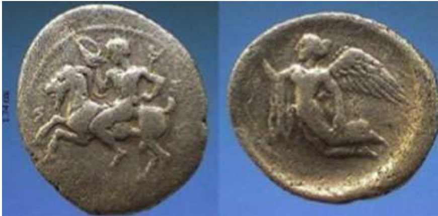
Figura 3. Hemidracma de Hímera (472 a.C. – 408 a.C.).

En cuanto a la identificación de este tipo de representación en la moneda de Catania, autoras como Salamone (Salamone, 2013, p. 16) y Caltabiano (Caltabiano, 2016, p. 54) enfatizan la importancia de la leyenda con el nombre de la ciudad que aparece acompañando a estas figuras femeninas, la cual habría que interpretarla, según estas autoras, como el propio nombre de la ninfa, por lo que la leyenda estaría identificando a la ninfa local epónima en su papel de divinidad poliádica de la ciudad, representativa y protectora de la población (Salamone, 2013, p. 19), así como habría que tener en cuenta la función semántica de la corona, alusiva al motivo ideológico de la obtención de la identidad cívica y de un “status” democrático (Onians, 1951, p. 229) que también justifica el clima de renovación institucional seguido a la caída de las tiranías sicilianas en el 466 a.C. con una función cívica de la figura alada como una genérica Niké (Salamone, 2013, p. 156).