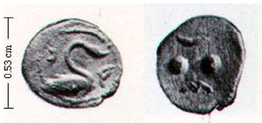
Figura 7. Hexas de Camarina (460 a.C. – 430 a.C.).

Este hecho me lleva a pensar que, aunque no sería descartable la idea de que se tratara de una representación sincrética de la ninfa Camarina, por aparecer acompañada por el cisne, y de una Niké, por aparecer ataviada como una, el hecho, como dice Jenkins, de que aparezca rodeada de una corona de laurel sí que podría interpretarse como uno de los elementos iconográficos de la Niké y, en mi opinión, el cisne, más que caracterizar a una posible ninfa, sirve como animal representativo o heráldico de la ciudad como podemos observar en su aparición en solitario en el resto de monedas de este periodo. (Fig. 7)