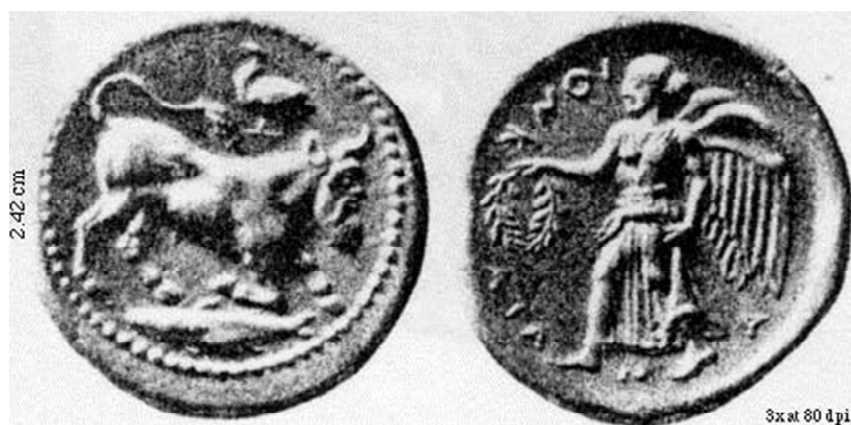
Figura 4. Tetradracma de Catania (464 a.C. – 450 a.C.).

Y en tercer lugar, si analizamos el conjunto de las acuñaciones de Catania desde su inicio hasta el saqueo y venta de sus habitantes como esclavos en el 403 a.C. podemos ver como no es hasta este último periodo que aparece la representación de la ninfa local, no siendo así la figura del dios-río de la ciudad, el Amenanos, que sí aparece representado en todos los periodos monetales de Catania desde estos primeros tetradracmas del 466/64 a.C. donde aparece en el anverso bajo la forma de un toro androcéfalo, por lo que no tendría sentido la representación de la ninfa bajo la forma de una Niké o divinidad poliádica, debido a su importancia local, y que no volviese a ser representada en su moneda durante las siguientes cinco décadas. (Fig. 4 y 5)