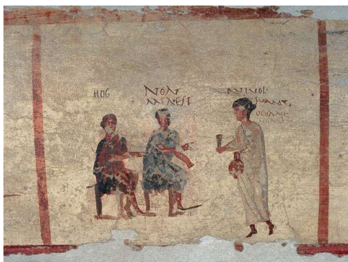
Figura 2. Fresco que representa una escena cotidiana en una taberna de Pompeya (Italia). La llamada caupona de Salvius sirve la bebida a unos clientes.

En el fresco de la caupona de Salvius los popini discuten por la jarra de cerveza, o personas que se pasan el día en el bodegón o taberna, y la tabernera le dice: “ oceanus ven y bebe ”. Se trataba de una broma por el doble sentido de la palabra oceanus como mar, es decir, como persona que bebe mucho (Figura 2).