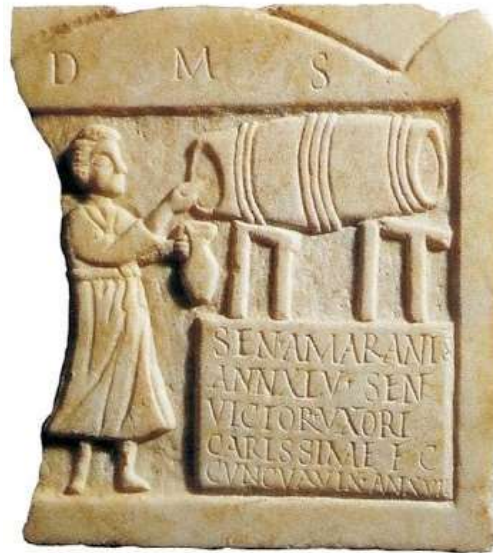
Figura 3. Monumento funerario que representa a Sentia Amarantia, ejerciendo su oficio de tabernera. Tumba de mármol blanco original de la provincia de Mérida (España). Siglo I d.C.

público, ya que como vemos en los pocos testimonios a los que tenemos acceso, la mujer participa en la vida económica de los núcleos urbanos para asegurar su supervivencia, la de su familia y, como señala Silvia Quintana 63 , la mujer humilde tendrá unas pretensiones, económicamente hablando, muy diferentes a las de las ricas propietarias.