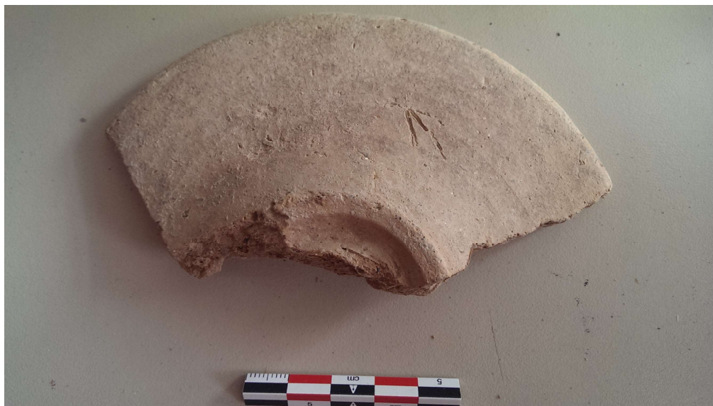
Figura 6 PN-93-5-303793

que fue trazado ni su morfología final coinciden con letra fenicia o púnica alguna). Debe tratarse (de nuevo si excluimos otros sistemas gráficos, pues signos parecidos existen en las escrituras paleohispánicas) de una marca no grafemática (situada esta vez fuera de la base del plato, pero siempre en zona ni visible ni molesta durante el normal uso de la pieza).