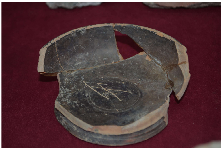
Figura 2. M.A.00250

Paleográficamente, los mejores paralelos a estos grafemas se manifiestan en la epigrafía de los siglos II a. C. – I d. C., con buena relación en especial con las grafías atestiguadas en las inscripciones tunecinas (p. ej. del área de Cartago o El-Hofra) de los siglos II-I a. C. Una datación algo anterior, como la indicada por el soporte, es en cualquier caso perfectamente aceptable.