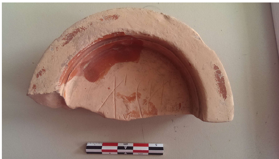
Figura 3. M-85-C.B VIII-ALZ.V.

grafemas situados bajo ellos. Dada la disposición de los grafemas visibles, da la sensación de que las cuatro letras neopúnicas legibles formaban una secuencia completa, si bien no es posible saber si los restos mínimos de trazos conservados bajo esta secuencia formaban una segunda (que completara la visible o que fuera incisa en un momento diverso).