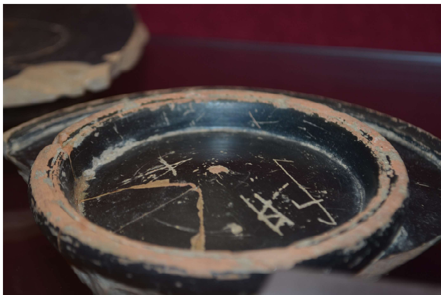
Figura 1. M.A.00116

La pieza presenta tres signos, que son claros grafemas, en la parte inferior (exterior) de su fondo. Se caracterizan por formas y/o ductus típicos de la escritura occidental que llamamos propiamente púnica.