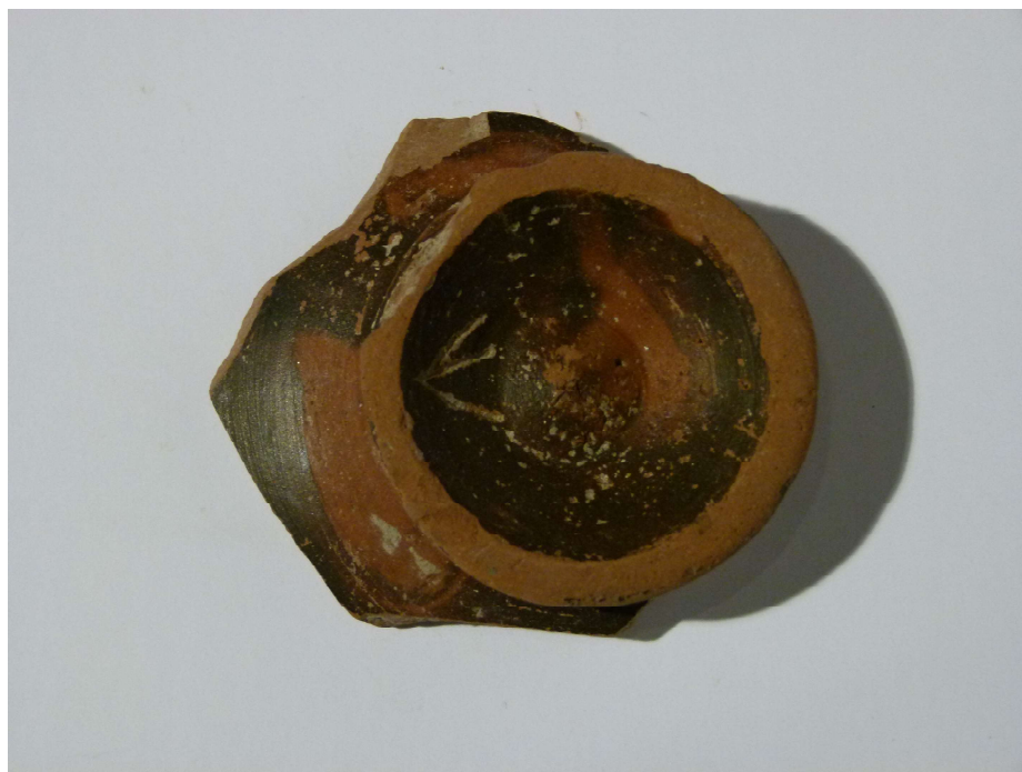
Figura 5. PE-85 C-B ALZ.VIII 1064

arcaicas o a algunas versiones posteriores de shin de raro y corto uso). En este caso, y dada la datación arqueológica de la pieza (s. III a. C.), aunque podría proponerse la identificación del signo del grafito con una de esas versiones tardías de shin “en tridente”, tal identificación resulta altamente improbable (tanto más cuanto que tales versiones no son propias de la escritura fenicia occidental que llamamos púnica).