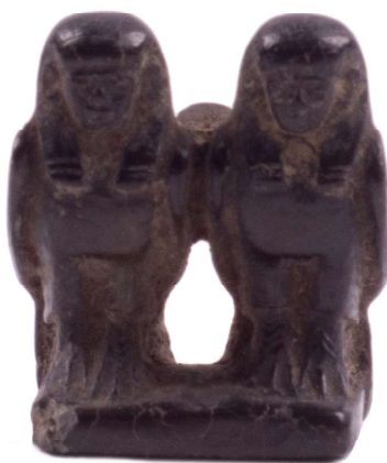
Figura 21. Amuleto de doble pájaro Ba.