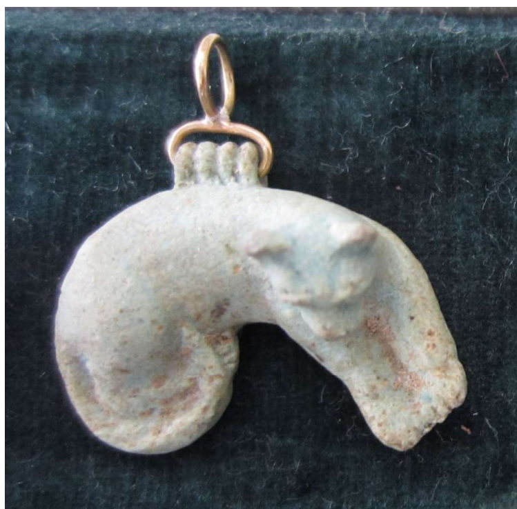
Figura 27. Falsificación gato.

Amuleto elaborado en Fayenza azul, de procedencia y datación desconocidas. Dimensiones 1,2 x 2,7 cm. Excelente estado de conservación.