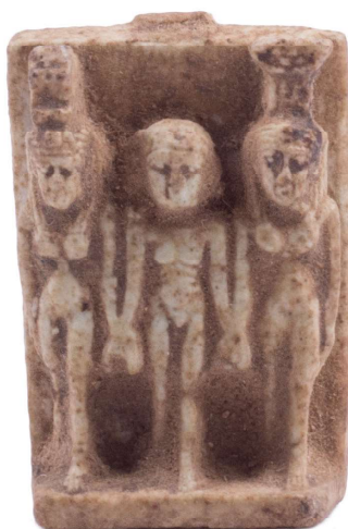
Figura 12. Amuleto de tríada osiriana.

Placa amuleto elaborado en fayenza verde-azulada, de procedencia desconocida y datación de Baja Época (Período Saita, dinastía XXVI). Dimensiones 3 cm. Buen estado de conservación salvo por la rotura del asa de suspensión.