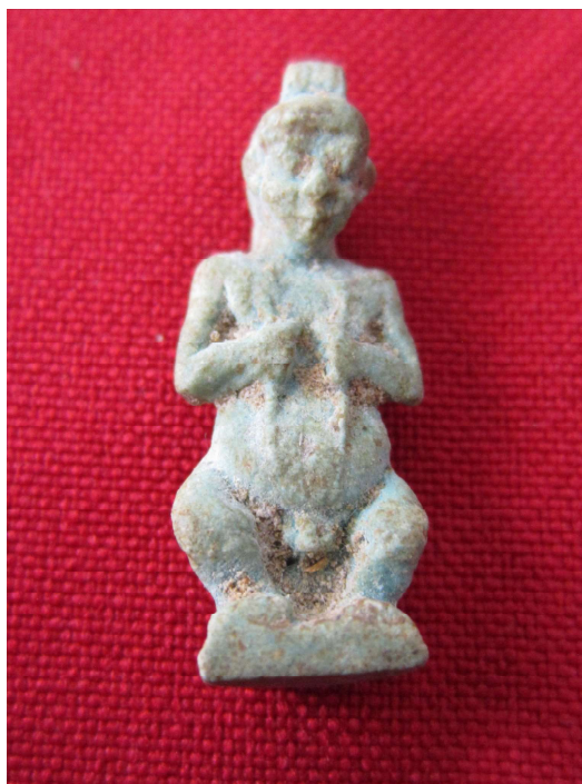
Figura 13. Amuleto de Pateco.

Amuleto que representa a un enano deforme que, según la mitología egipcia, ayudaba al dios Ptah en los trabajos orfebres deviniendo, de esta manera, patrón de los mismos. Presenta algunas de las características típicas de este semi-dios: desnudo, en posición frontal, calvo, con una especie de casquete que le cubre parte de la cabeza y sujetando en ambas manos sendas serpientes. Su abdomen está abultado, sus piernas cortas se muestran arqueadas y sus pies apoyan directamente sobre una base realizada en el mismo material. Al dorso muestra un pilar dorsal anepigráfico 8 . Sobre su cabeza conserva la anilla a través de la cual era colgado. Al igual que los cipos de Horus, protegía contra la picadura de serpientes.