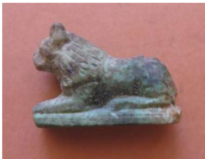
Figura 22. Amuleto de león.

mayoría, a los cuales se les imbuje de autoridad y poder. Entre ellos se encuentran los pilares Djed , los reposa cabezas, el símbolo nfr , entre otros.