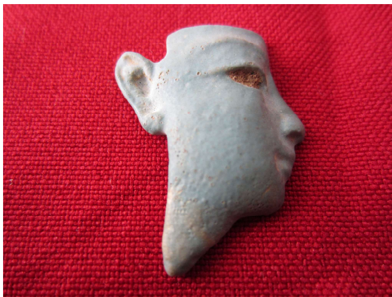
Figura 20. Placa de incrustación con perfil humano.

Paralelos: Un ejemplar en una colección particular con número de inventario 97 (Mangado, coord., 2006, pp. 207-208); otro en el Museo Georges Labit con el número de inventario 49-29 (Guillevic y Ramond, 1988, p. 13) y, por último el perfil en jaspe rojo conservado en el Colegio Eton con número de inventario ECM 1655 (Spurr, Reeves y Quirke, 1999, p. 42).