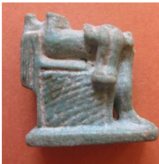
Figura 4. Fragmento amuleto de Isis (Zona del trono y extremidades inferiores). Vista derecha.

Amuleto realizado en fayenza azul, de procedencia desconocida y datación de Baja Época, dinastía XXVI (672-525 a.C.). Dimensiones 2,5 x 2,5 cm. Pieza fragmentada.