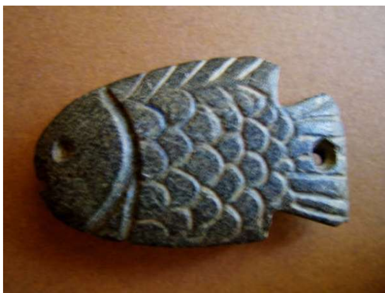
Figura 25. Amuleto de pez (tilapia nilótica).

Amuleto que representa a una tilapia nilótica. Sus diferentes partes se encuentran talladas en la piedra. El pez aparece representado con la boca abierta y los ojos incisos al igual que las agallas. Las escamas redondeadas parecen estar las unas encima de las otras. La espina dorsal se inicia en la cabeza y termina en el comienzo de la cola en forma de abanico, en la cual aparece el agujero circular a través del cual el amuleto sería colgado. Las espinas se encuentran representadas por medio de líneas incisivas paralelas y cortas.