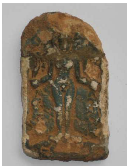
Figura 14. Amuleto de cipo de Horus.

Placa amuleto con la imagen de “Horus sobre cocodrilos” o Cipo de Horus, en la cual aparece Harpócrates u Horus niño en el centro, en pie sobre dos cocodrilos, desnudo y con la coleta a medio lado que lo caracteriza. Pese a su estado irregular pueden observarse todos los elementos. En sus manos sostiene dos serpientes a cada lado dispuestas hacia arriba y hacia abajo, en la mano derecha sujeta una gacela por los cuernos y un escorpión y, en la izquierda, un león por su cola. Sobre su cabeza se ubicaría la efigie del dios Bes que ha desaparecido debido a la pérdida de material de la pieza. Como amuleto solía ser portado por los vivos como prevención contra las picaduras y encuentros con estos animales dañinos del desierto. Normalmente se realizaban en piedras y fayenzas de color verde, azul o negro como símbolo de renacimiento y por lo tanto de curación. Este amuleto es anepigráfico, pero muchos de ellos contienen hechizos inscritos en sus superficies.