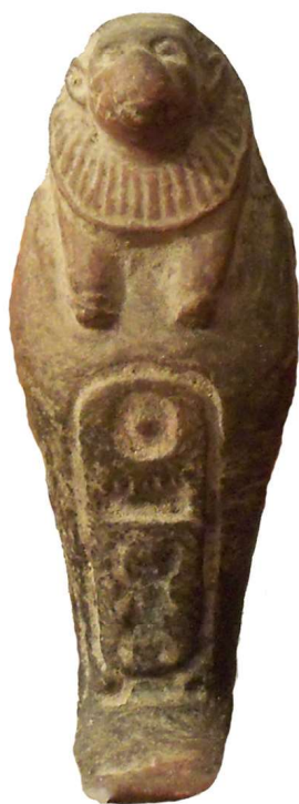
Figura 16. Amuleto del hijo de Horus Hapy, con inscripción jeroglífica.

Pequeño amuleto, en bulto redondo, que representa al hijo de Horus Hapy con inscripción jeroglífica al frente. Al contrario que en las cuatro piezas anteriores, la imagen aparece de frente y no de perfil. La cabeza del cinocéfalo está reproducida con todo lujo de detalles, las orejas, los ojos, y la melena que circunda su cabeza que se solapa a la peluca que porta. La inscripción jeroglífica incisa, dispuesta en vertical y dentro de un cartucho, hace referencia a Tutmosis III ( Mn-hpr-R c ), de arriba a abajo: disco solar Ra, en medio el signo del tablero del juego del senet ( mn ) y abajo el escarabajo hpr .