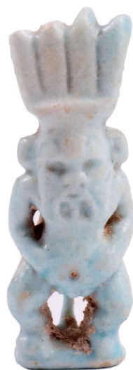
Figura 9. Amuleto dios Bes.

Amuleto realizado en fayenza azul, de procedencia desconocida y datación de Baja Época (715-332 a.C.). Dimensiones 4,2 x 1,5 cm. Muy buen estado de conservación. Posee una rotura en la parte distal izquierda del tocado de plumas.