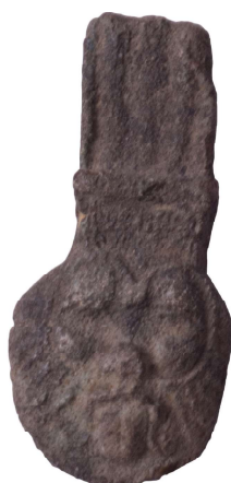
Figura 8. Placa del dios Bes.

Placa amuleto del dios Bes elaborado en fayenza, de procedencia desconocida y datación de Baja Época (715-332 a.C.). Dimensiones 4,7 x 2,3 cm. Estado de conservación regular con alguna pequeña falta de material.