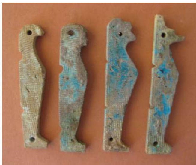
Figura 15. Amuletos de los 4 hijos de Horus.

Representación de los cuatro hijos de Horus toscamente elaborados en forma momiforme, de perfil y sin decoración. Todas las piezas han perdido la mayoría del vidriado azul que las recubría. Tres de ellos (Qebehsenuf, Hapy y Duamutef) presentan dos orificios de suspensión, uno a la altura de la cabeza y otro a la altura de los tobillos, mientras que Imset sólo posee el orificio de la cabeza. Éstos amuletos tenían la función de proteger las vísceras del cuerpo contenidas en los denominados vasos canopos, a saber: Imset, con cabeza humana protege el hígado; Hapy con cabeza de cinocéfalo los pulmones; Duamutef con cabeza de chacal el estómago y Qebehsenuf con cabeza de halcón los intestinos.