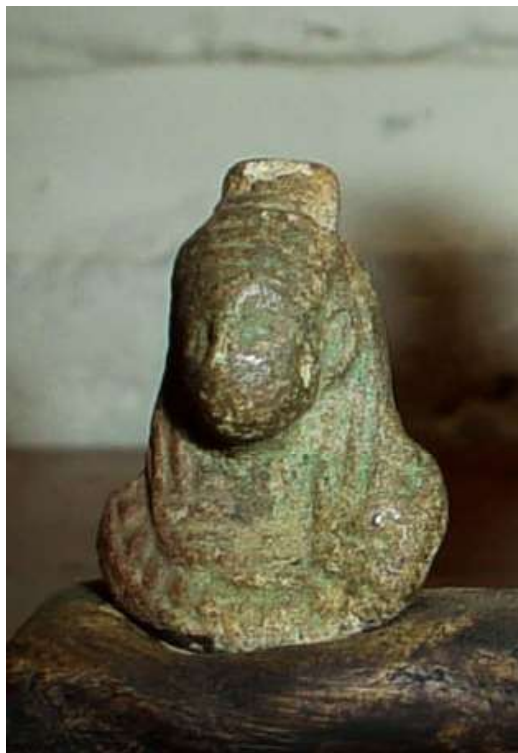
Figura 6. Cabeza de mujer.

Paralelos: En la colección egipcia de la Real Academia de Córdoba existe un ejemplar con la efigie de un babuino y número de inventario 1981/1/80 (Pons, coord., 1998, p. 59) y otro en el Museo Pelizaeus con número RPM 6175 (Plas y Saleh, 2006).