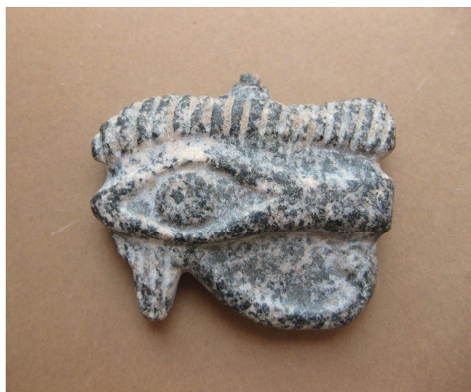
Figura 17. Gran ojo udjat en piedra.

Amuleto que representa el ojo udjat 9 , ojo izquierdo que fue restablecido a Horus por el dios Tot tras perderlo aquel en un combate contra su tío Set. Aquí aparecen perfectamente delimitados la ceja larga y espesa, el ojo con la pupila y los elementos decorativos representativos del ojo de halcón. Muestra un asa de suspensión sobre la ceja. Según la clasificación de Flinders Petrie (1994, p. 32) pertenecería al tipo B que se caracteriza por unos apéndices largos y la superficie plana. Fue uno de los amuletos más populares durante todo el Egipto faraónico y solía ser portado tanto por los vivos como por los difuntos. Este símbolo era uno de los más poderosos ya que ejercía una función protectora contra el mal de ojo, potenciaba la visión y fue empleado contra las enfermedades oculares. Este signo vendría a simbolizar la totalidad y la unidad restablecida y, también, es un símbolo de sanación.