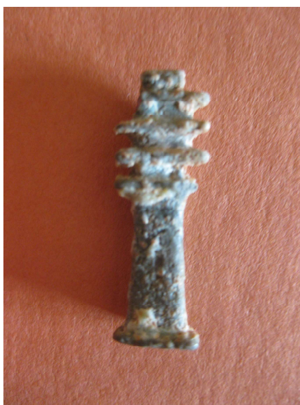
Figura 24. Amuleto de pilar djed anepigráfico.

Paralelos: Existen miles distribuidos en colecciones públicas y privadas, entre ellos un ejemplar en el Museo Egipcio de Barcelona (Caja de Burgos, Clos y González, 2011, p. 154), otro en la colección egipcia del Museo Emmanuel Liais de Chebourg Octeville con número de inventario desconocido (Loffet, 2007, pp. 79-80 n°116, 117) y, por último, otro paralelo en el Museo de Montserrat del que se desconoce su número de inventario (Uriach y Vivó, 2008, p. 158).