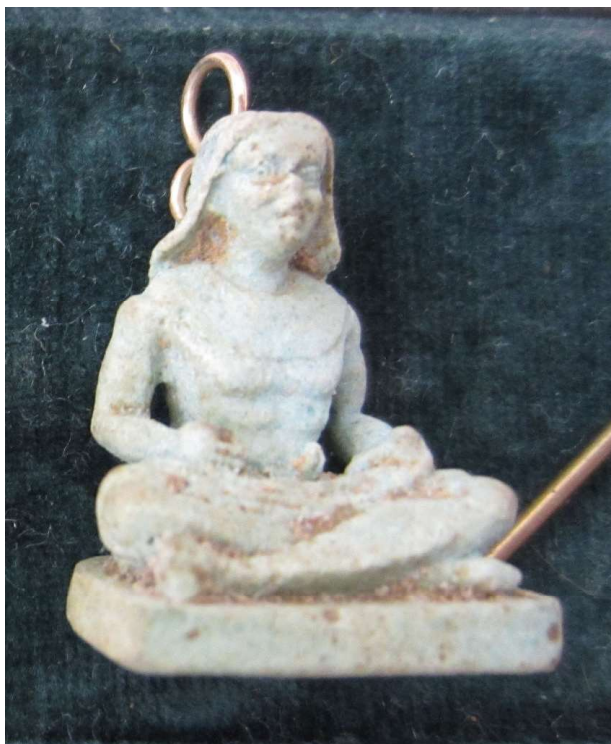
Figura 26. Falsificación escriba.

Amuleto realizado en fayenza azul, de procedencia y datación desconocidas. Dimensiones 2,7 x 2,2 cm. Excelente estado de conservación.