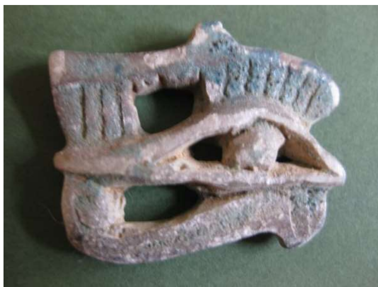
Figura 19. Amuleto ojo udjat calado.

de halcón. Muestra un asa de suspensión sobre la ceja. Según la clasificación de Petrie (1994, p. 33) pertenecería al tipo A de udjat inusuales.