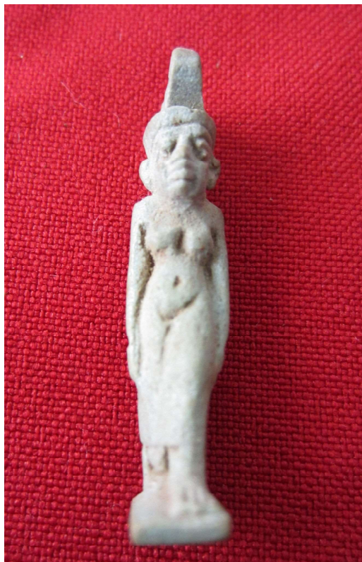
Figura 1. Amuleto diosa Neit de frente.

Grupo de amuletos que representan a diferentes dioses y diosas egipcios, así como animales sagrados. Pueden aparecer completamente humanos, con cabeza de animal o completamente zoomorfos. Según la clasificación de Petrie (1914) corresponderían a los denominados theophoric . Mostramos aquí 4 en forma humana y uno zoomorfo.