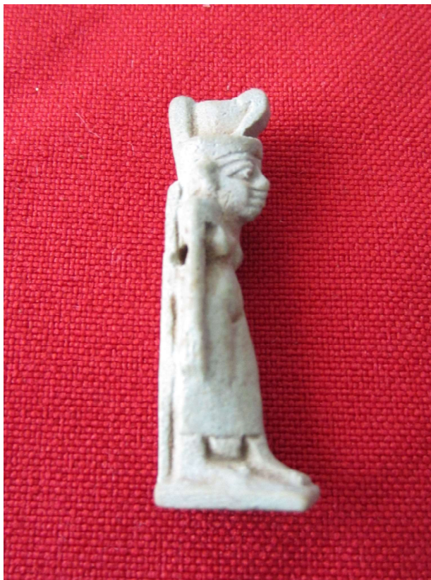
Figura 2. Amuleto diosa Neit de perfil.

Representación de la diosa Neit dando un paso al frente, portando la corona roja del Bajo Egipto y vistiendo un paño largo fino que cubre su cuerpo hasta los pies, así como un collar ancho uasej . La pieza se apoya en una base del mismo material y en un pilar dorsal anepigráfico 6 que le llega hasta la altura del cuello. Ambos brazos permanecen pegados al cuerpo. El agujero circular a través del cual la pieza era colgada se localiza a la altura del pecho atravesando transversalmente la misma. La diosa Neit junto con el dios Seth, su esposo, y su hijo Sobek forman la denominada tríada saita. En muchas ocasiones esta divinidad suele aparecer amamantando a dos cocodrilos, uno en cada pecho.