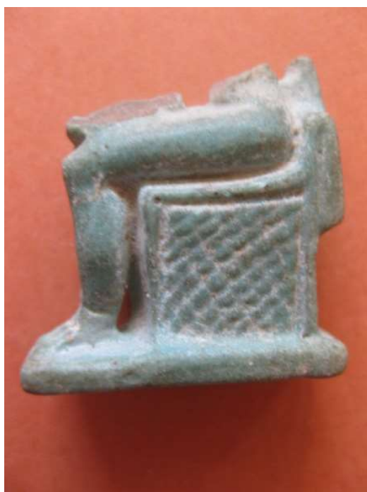
Figura 5. Fragmento amuleto de Isis (zona del trono y extremidades inferiores). Vista izquierda.

Miles de estas piezas eran fabricadas a molde y portadas por las mujeres ya que representan a la madre abnegada que cuida de sus hijos y simbolizan la fertilidad. En muchas ocasiones la diosa Mut era identificada con esta diosa en la faceta de madre. Isis, hermana y esposa de Osiris, es madre de Horus en la cosmogonía heliopolitana. Esta tríada divina se refleja en la realidad a través del matrimonio divino formado por el faraón, la gran esposa real y el hijo de ambos heredero del trono. Cuando el faraón gobernante fallecía se convertía en Osiris, mientras que el príncipe que accede al trono se convertía en Horus, el casaría con una esposa de sangre real que sería identificada con Isis. Es aquí donde se ve la estrecha relación entre la religión, la política y la vida cotidiana.