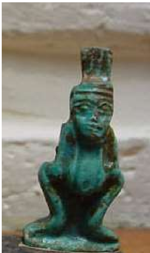
Figura 10. Amuleto del dios Bes.

Amuleto elaborado en fayenza azul, de procedencia desconocida y datación de Baja Época (Dinastía XXVI). Dimensiones 3,1 x 1,3 cm. Buen estado de conservación.