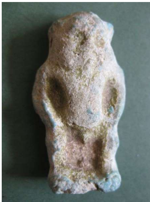
Figura 11. Amuleto del dios Bes.

Amuleto realizado en fayenza azul, de procedencia desconocida y datación de Baja Época (715-332 a.C.). Dimensiones 3,5 x 2 cm. Buen estado de conservación.