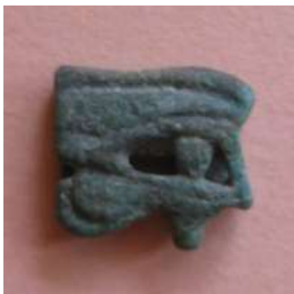
Figura 18. Amuleto pequeño ojo udjat .

Amuleto del ojo derecho 10 de Horus que contiene todas las características típicas del mismo como son: la ceja alargada, el ojo con la pupila bien delimitada así como los elementos decorativos representativos del ojo de halcón. Según la clasificación de Petrie pertenecería al tipo B.