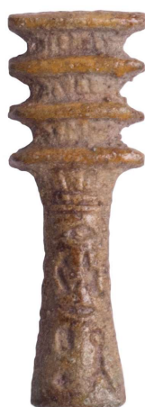
Figura 23. Amuleto de pilar djed con inscripción jeroglífica.

Paralelos: Amuletos de este tipo se encuentran repartidos por muchos museos alrededor del mundo, entre ellos, dos ejemplares en el Museo Real de Mariemont con número de inventario B447 y B472 (Derriks y Delvaux, 2009, pp. 250-251); otros cuatro de ejemplares en el Museo Emmanuel Liais de Cherbourg Octeville, de los que se desconoce su número de inventario actual (Loffet, 2007, pp. 79-80); en el University College hay varios ejemplares. Todos son anepigráficos. Existe un ejemplar con inscripción recogido por Andrews (1994, p. 98) perteneciente al escriba y mayordomo real Iy.