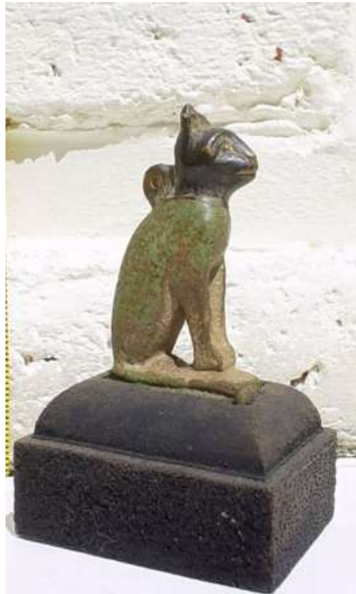
Figura 7. Amuleto diosa Bastet en forma de gata.

Paralelos: Varios ejemplares con bicromía en la colección del University College (Petrie, 1994, p. 46, nº 224d2 y 224f).