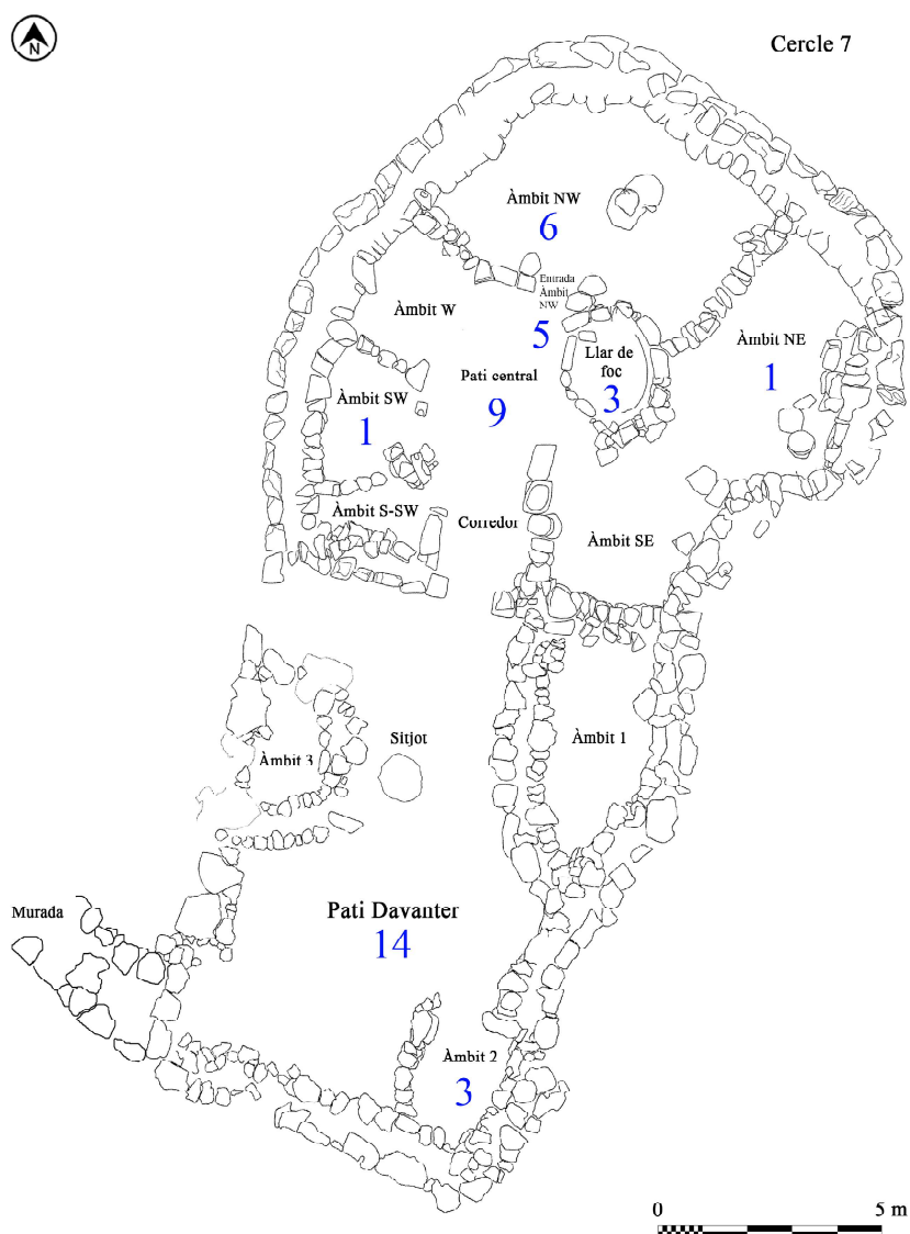
Fig. 1. Plànol del Cercle 7 i el Pati Davanter amb la distribució de les denes documentades.

documentar la ubicació original de la major part de l'utillatge domèstic (Ferrer et al. 2011; Carbonell et al. 2015; Ferrer i Riudavets 2015). Dins l'estructura s'hi van documentar, per altra banda, les restes de sis individus, contemporanis a l'abandonament de la casa. La seva deposició, en un àmbit domèstic, no correspon a cap ritual funerari d'època protohistòrica propi de l'illa, de forma que es podria relacionar amb algun esdeveniment inusual, que hauria motivat també l'abandonament definitiu de l'habitatge (Ferrer et al. 2008).