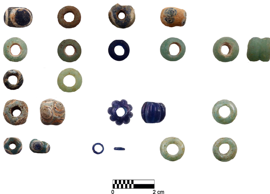
Fig. 2. Algunes de les denes documentades a l'àmbit NW, la seva entrada i el pati central del Cercle 7.

taula de Trepucó, lloc per al qual s'ha proposat que hauria funcionat com un centre de producció i/o distribució d'aquests elements (Murray 1938) interpretació posada en dubte, probablement de forma encertada, per De Nicolás (2014).