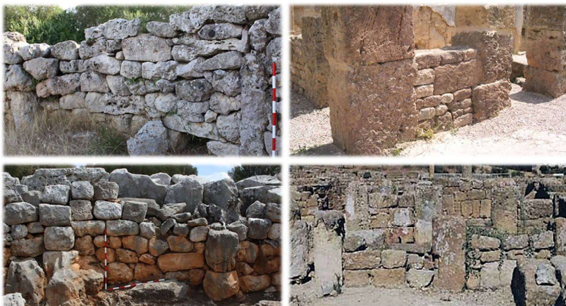
Fig. 4. El empleo del aparejo de pilares u opus africanum típicamente púnico en las viviendas de Cartago (derecha) también se detecta en las casas menorquinas, como en Sant Vicenç d'Alcaldús o Torre d'en Galmés.

La fragmentación es también un rasgo compartido, documentándose diversas habitaciones en torno al espacio central abierto. De forma más clara, las viviendas púnicas cuentan con infraestructuras asociadas y elementos arquitectónicos concretos que ilustran la funcionalidad del espacio. Es el caso de la cocina, con estructuras de combustión y mobiliario asociado; o de las dependencias para el almacenaje, con presencia mayoritaria de ánforas. Una de esas estancias, ubicada generalmente atravesando el patio longitudinalmente, es un ámbito destinado a la representación social. Estas habitaciones se identifican por su marcada estética, decoradas con mosaicos y pavimentos cuidados, mobiliario selecto o elementos de monumentalización concretos, como en su acceso. Todas estas características pueden relacionarse, en mayor o menor grado en función del caso, con los atributos que se observan en los círculos menorquines.