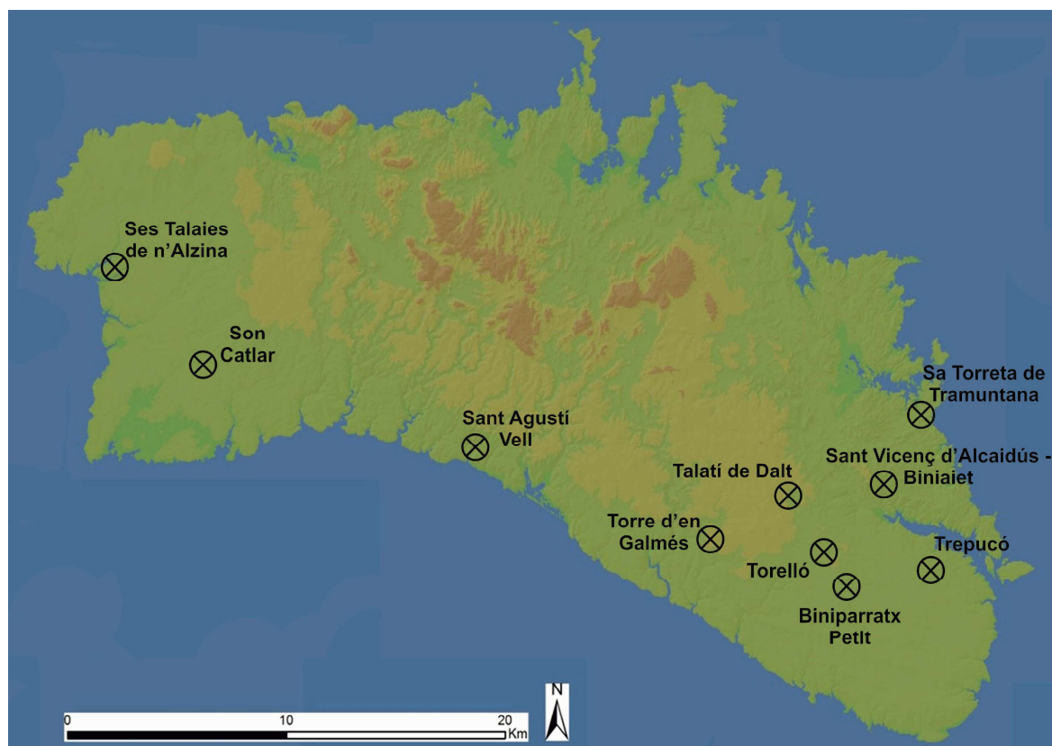
Fig. 1. Mapa de la isla menorquina donde aparecen señalados los yacimientos citados en el texto.

Ferrándiz 2005; Delgado 2010). Entiendo que estas situaciones de contacto se caracterizan generalmente por la adaptación de unas características propias de cada cultura, así como el rechazo de otras, generando finalmente un panorama socio-económico diferente al original. Por todo ello, en el caso que nos ocupa, las viviendas se perfilan como una herramienta idónea para calibrar ese contacto entre ambos factores (Rapoport 1969).