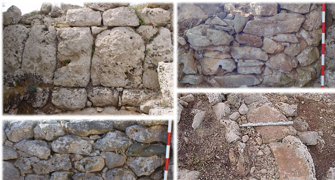
Fig. 2. Aparejo de lajas verticales exterior en Sant Vicenç d'Alcaldús (arriba izquierda), aparejos de mampostería trabada con tierra y ripio en los cercles de Sa Torreta de Tramuntana (arriba derecha y abajo izquierda), y vista del interior del muro perimetral de uno de los círculos de Biniparratx Petit (abajo derecha).

uso concreto sigue siendo confuso, especialmente teniendo en cuenta que probablemente no tuviesen una única funcionalidad (Pérez-Juez 2011). El hecho de que siempre se encuentren en pareja podría tener un significado relacionado con la composición de los grupos domésticos que desconocemos actualmente, como ya se ha señalado en otros trabajos (Plantalamor 1991a).