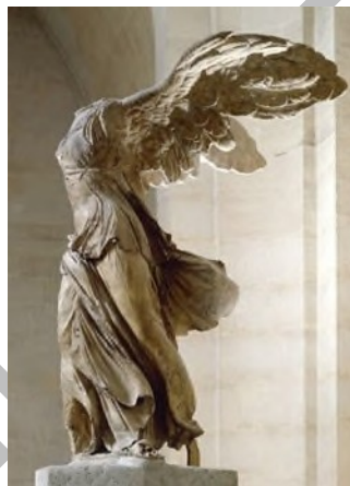
Victoria de Samotracia