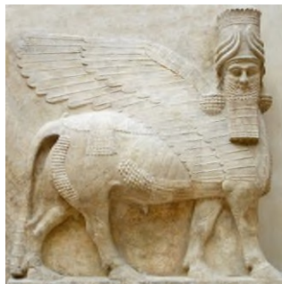
Toro alado de Khorsabad