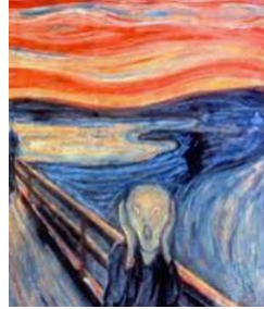
38. E. Munch, El grito