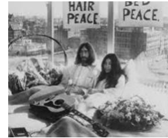
6. Yoko Ono, Beds-in for Peace