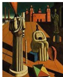
29. Giorgio de Chirico, Las musas inquietantes