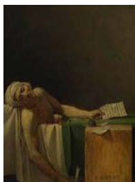
28. David, La muerte de Marat