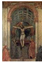
8. Masaccio, La Santísima Trinidad