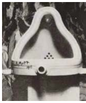
7. M. Duchamp, El urinario