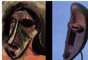
40. Máscara africana; Picasso, Las señoritas de Avignon