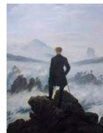
30. Caspar David Friedrich, El caminante sobre el mar de nubes