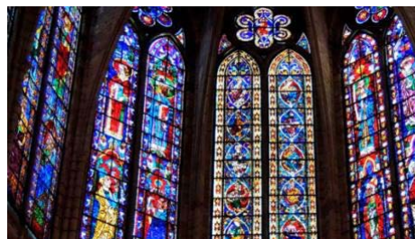
45. Vidrieras de la Catedral de León