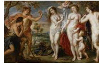
36. Rubens, El juicio de Paris