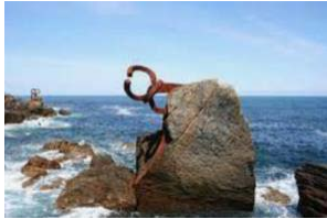
20. Chillida, Peine al viento