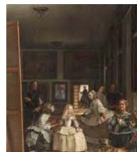
43. Velázquez, Las Meninas; Picasso, Las Meninas (Primera obra de la serie, 1957)