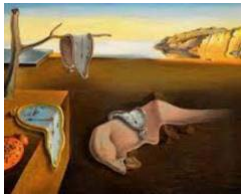
23. Dalí, La persistencia de los relojes