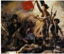
34. Eugène Delacroix, La libertad guiando al pueblo