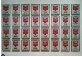
47. Warholl, La lata de sopa Campbell