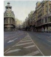
22. Antonio López, La gran vía madrileña