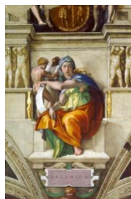
16. Miguel Ángel, La sibila