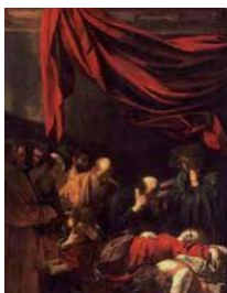
44. Caravaggio, La muerte de la Virgen