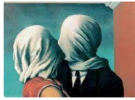
24. Magritte, Los amantes, Vrubel, Beso fraternal