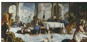
15. Tintoretto, El lavatorio