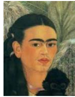
5. Frida Kahlo, Fulang Chang y yo