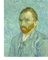
19. Van Gogh, Autorretrato