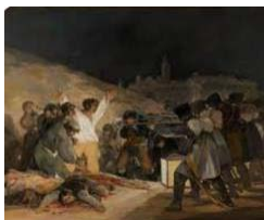
42. Goya, Los fusilamientos