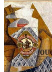
39. Juan Gris, La botella de anís