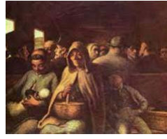
21. Daumier, El vagón de tercera