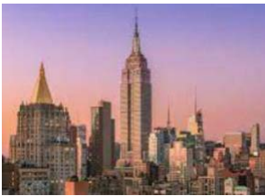
50. Empire State Building