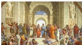
13. Rafael, La escuela de Atenas