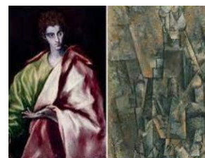
33. El Greco, San Juan Evangelista; Picasso, Hombre con clarinete