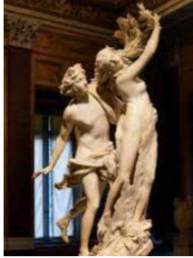
37. Bernini, Apolo y Dafne