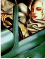
1. Tamara de Lempicka, Autoretrato en un Bugatti verde