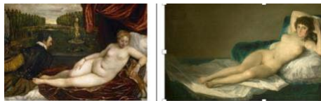
14. Tiziano, Venus recreándose con la música; Goya, La maja desnuda; Manet, Olympia