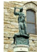
12. Donatello, Judith y Holofernes