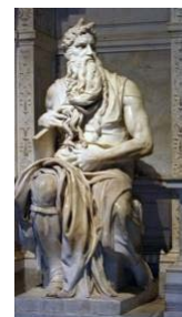
17. Miguel Ángel, Moisés