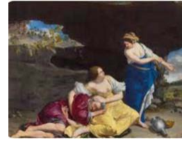
3. Artemisa Gentileschi, Lot y sus hijas