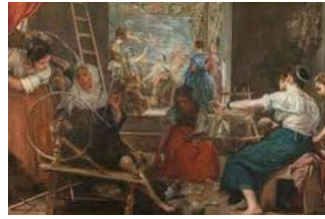
35. Velázquez, Las hilanderas