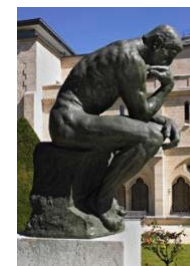
46. Rodin, El pensador