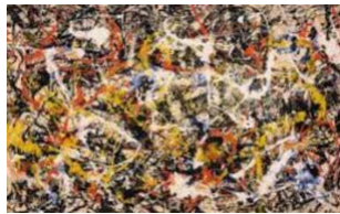
26. Jackson Pollock, Convergencias