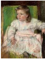
4. Mary Cassatt, La niña de la faja rosa