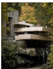
31. Wright, La casa de la Cascada