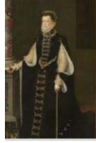
2. Sofonisba Anguissola, Retrato de la reina Isabel de Valois sosteniendo un camafeo con la imagen de Felipe II