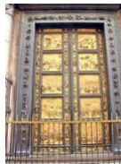
11. Ghiberti, Las puertas del Baptisterio