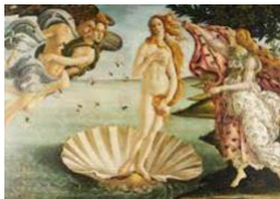
10. Botticelli, El nacimiento de Venus