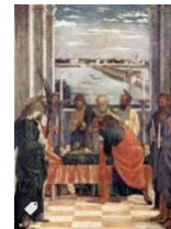
9. Mantegna, La muerte de la Virgen