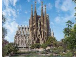
48. Gaudí, La Sagrada Familia