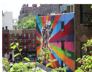
32. Mural arte urbano- High Line Nueva York