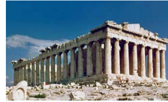
49. El Partenon