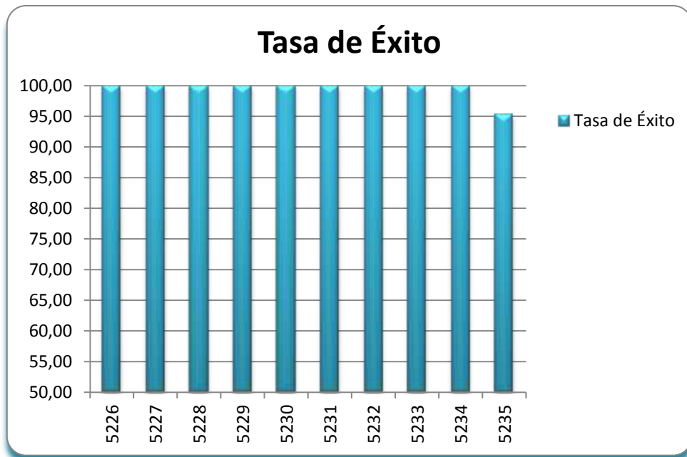
Figura 2- Tasa de Éxito de las asignaturas del Máster