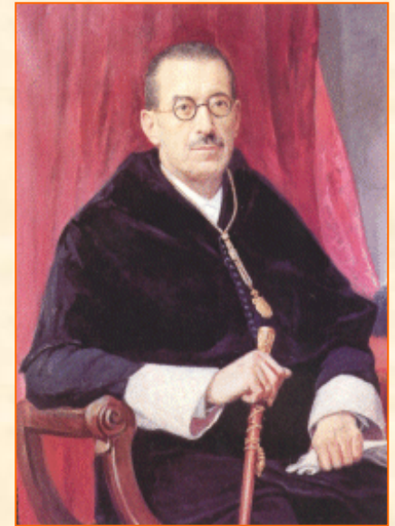
Rector de la UMU (1918-39)