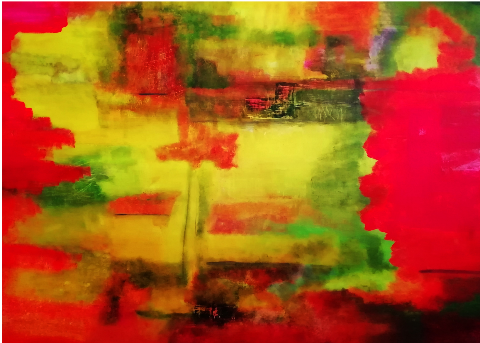
Hamlet Acrílico 101x137