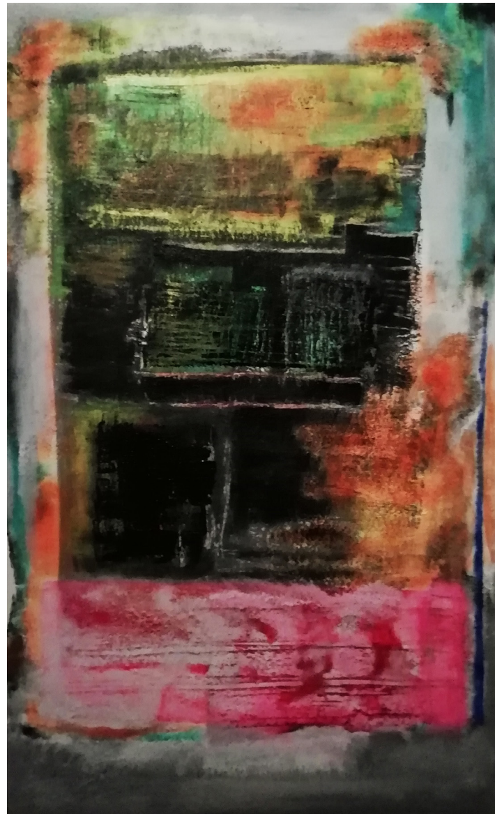
Celestina Técnica Mixta 120x70