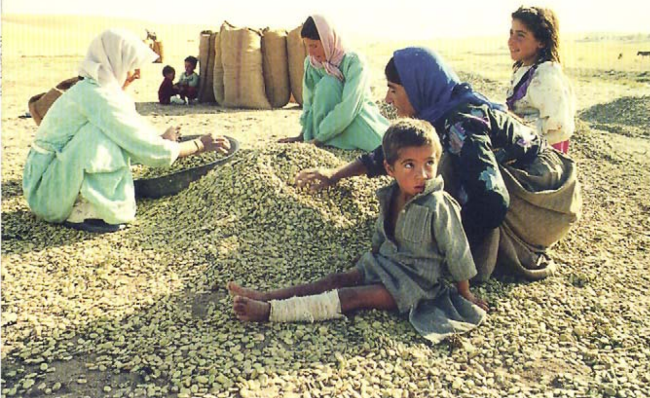
Aldea de Yoda Sagira. Era Comunal. 1993.

El desnucosillado de los habos, con los que se elabora el tradicional tul, incumbe a toda la familia.