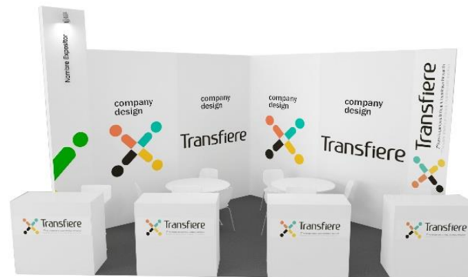
Ejemplo de Stand Estándar