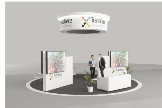
Ejemplo de Work Station Area