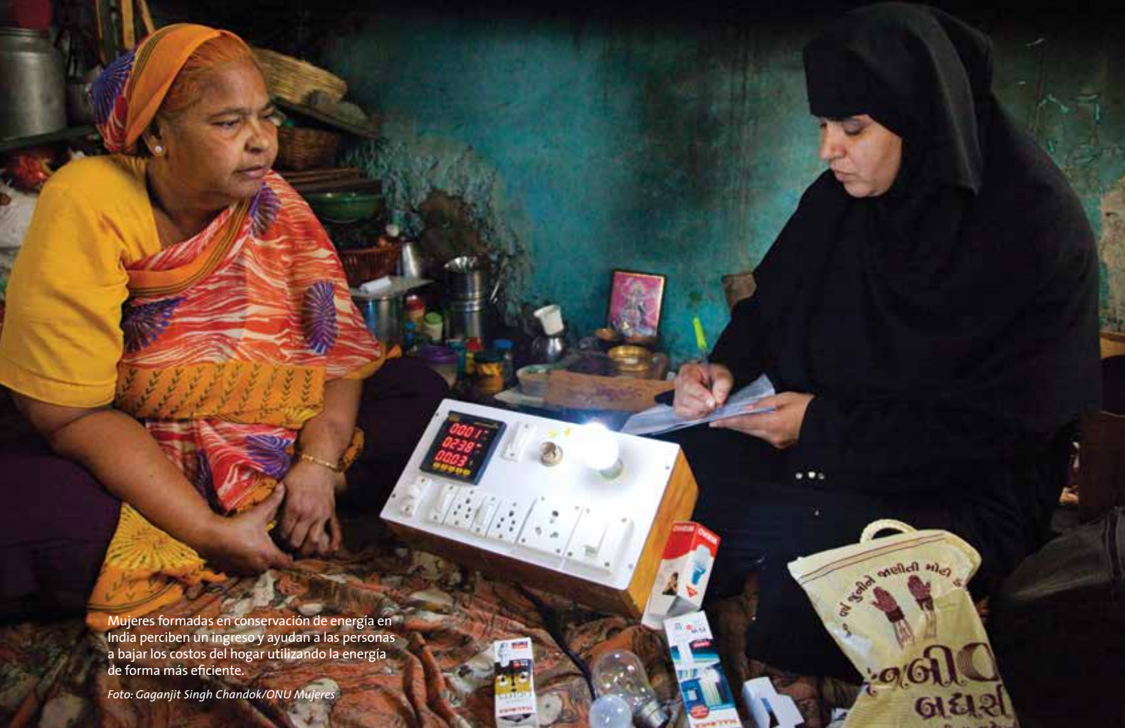
Mujeres formadas en conservación de energía en India perciben un ingreso y ayudan a las personas a bajar los costos del hogar utilizando la energía de forma más eficiente.