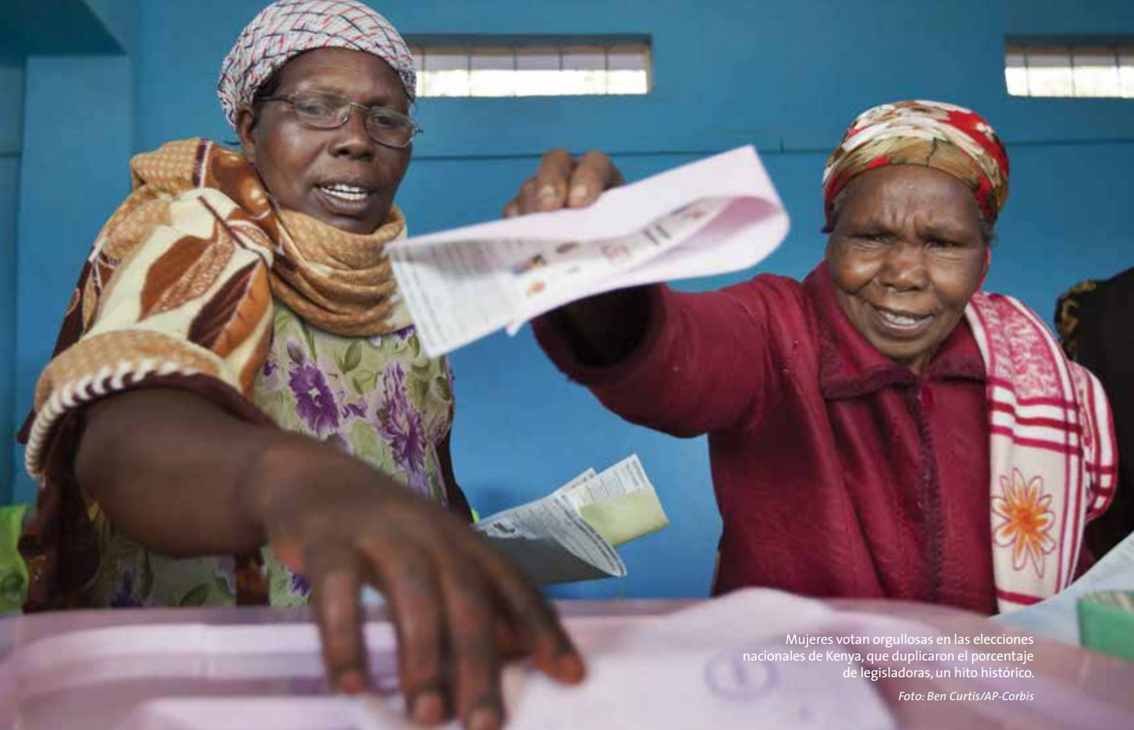
Mujeres votan orgullosas en las elecciones nacionales de Kenia, que duplicaron el porcentaje de legisladoras, un hito histórico.