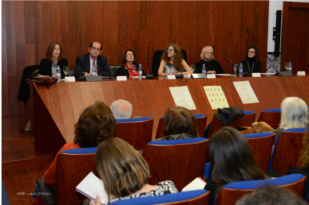
Colaboración en el 8 de marzo con DELETREARTES : Mesa Redonda: De Dulcinea a Lady Macbeth. Figuras femenina en torno a Cervantes y Shakespeare, en el Salón de Grados de la Facultad de Derecho.