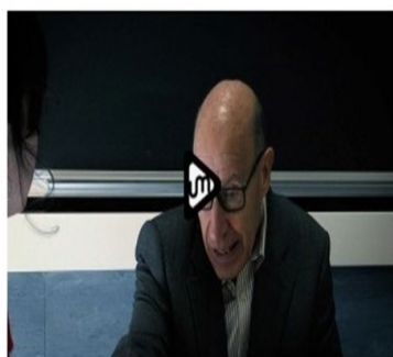
Spot 1 Campaña Esto es acoso