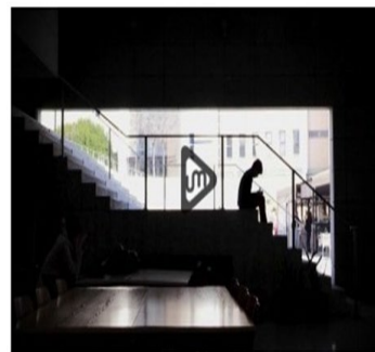
Spot 3 Campaña Esto es acoso

Por último, y como cuarta línea de actuación , se ha desarrollado una iniciativa largamente deseada como es la atención psicológica gratuita a víctimas de agresiones sexuales y/o violencia de género pertenecientes al alumnado de la UMU.