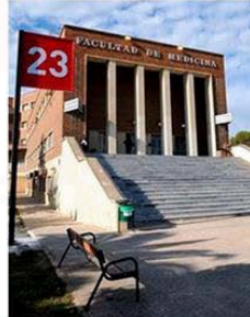
• CRAI Biblioteca Ciencias de la Salud