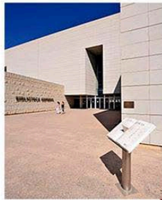
• Biblioteca General María Moliner (Óptica Veterinaria)