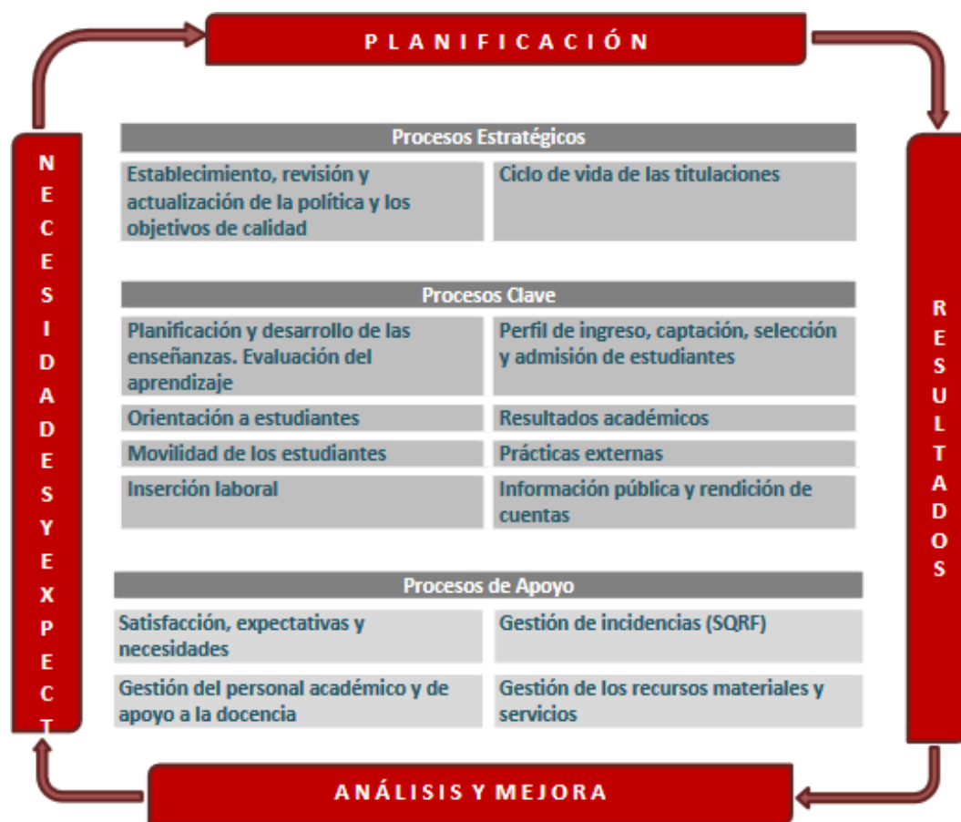
Figura 1. Mapa de Procesos del Sistema Aseguramiento Interno de Calidad.

El Programa de Orientación y Tutoría, en el caso de los Grados de la Facultad de Educación, consta de: