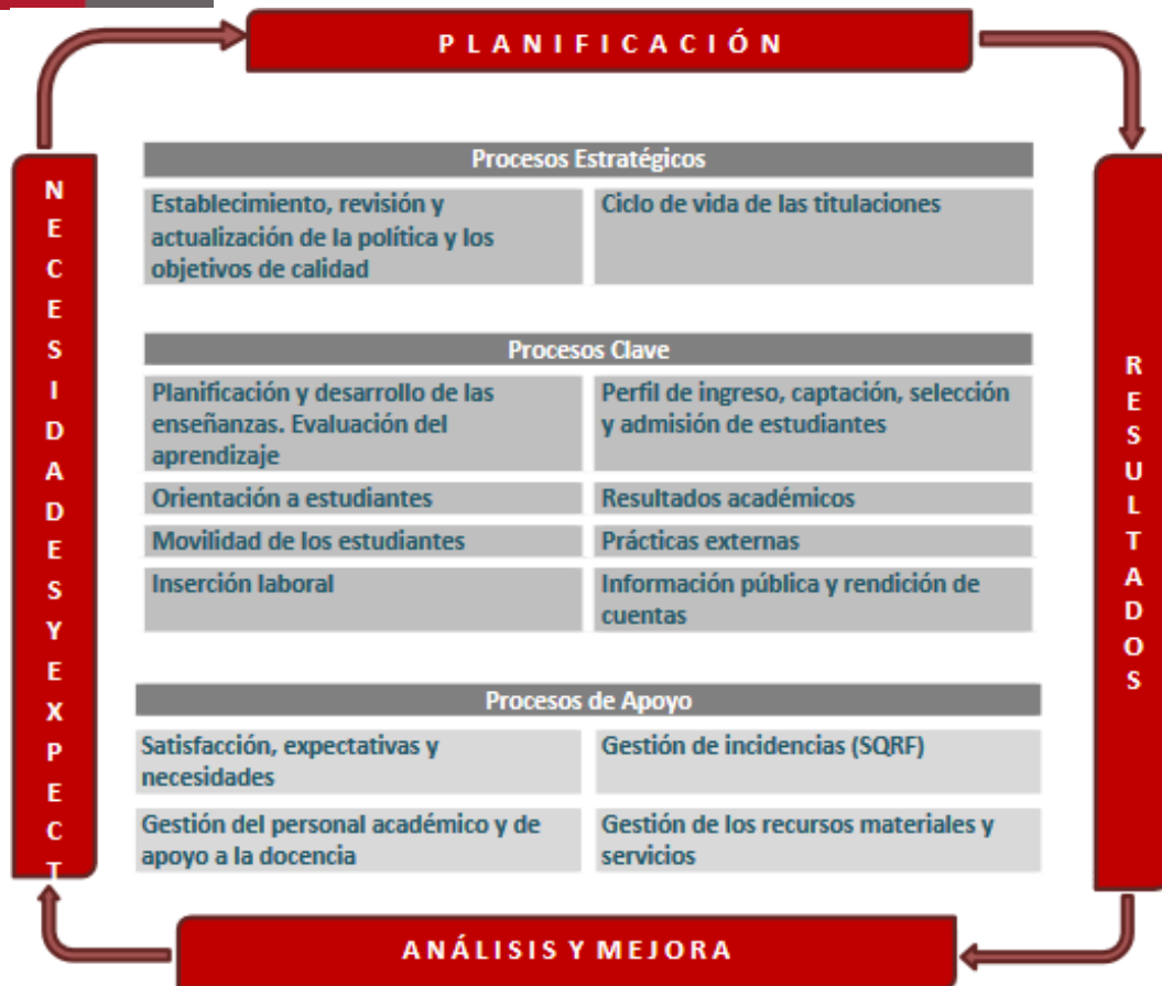
Figura 1. Mapa de Procesos del Sistema Aseguramiento Interno de Calidad.

El Programa de Orientación y tutoría, en el caso de los títulos de la Facultad de Educación, consta de: