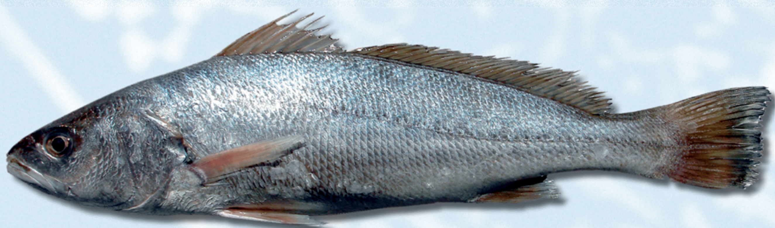
CORVINA , Argyrosomus regius

Método de cultivo: bateas Zonas: Galicia.