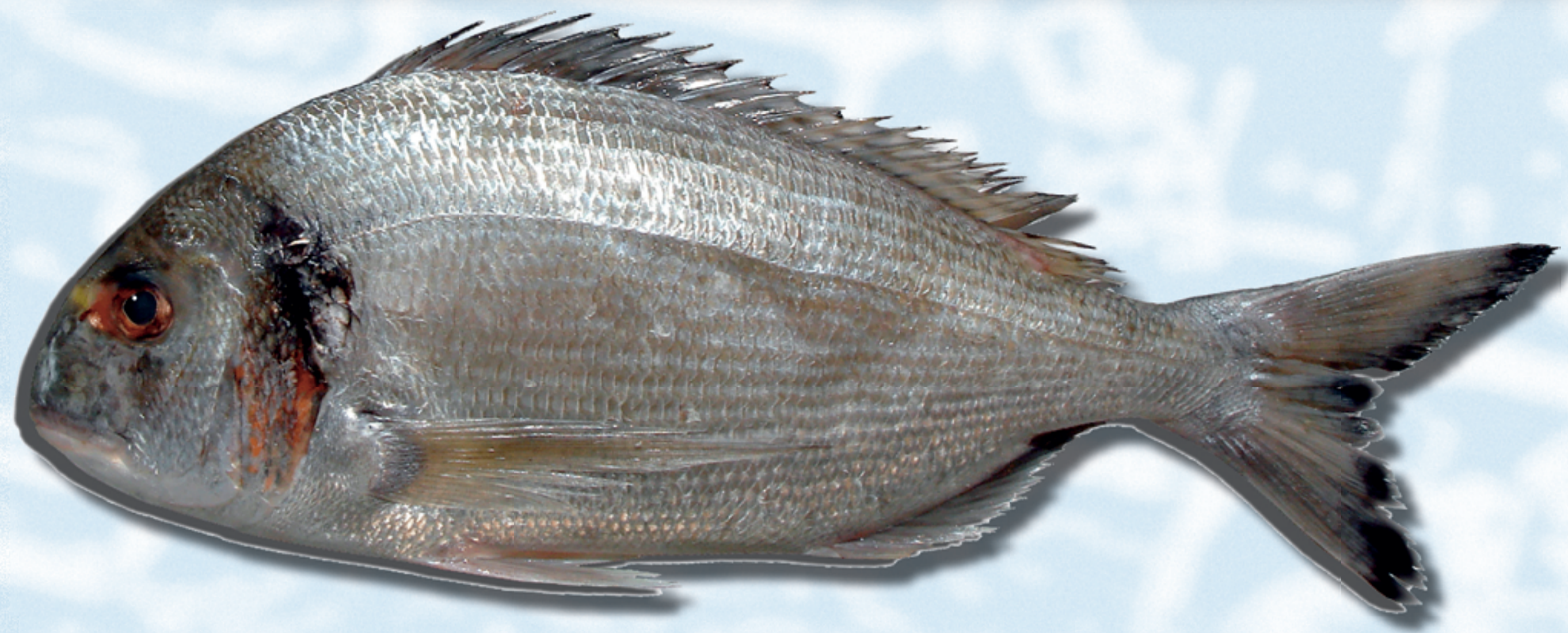
DORADA , Sparus aurata

Método de cultivo: jaulas y esteros Zonas: C. Valenciana, Andalucía, Canarias, Murcia, Cataluña y Baleares.