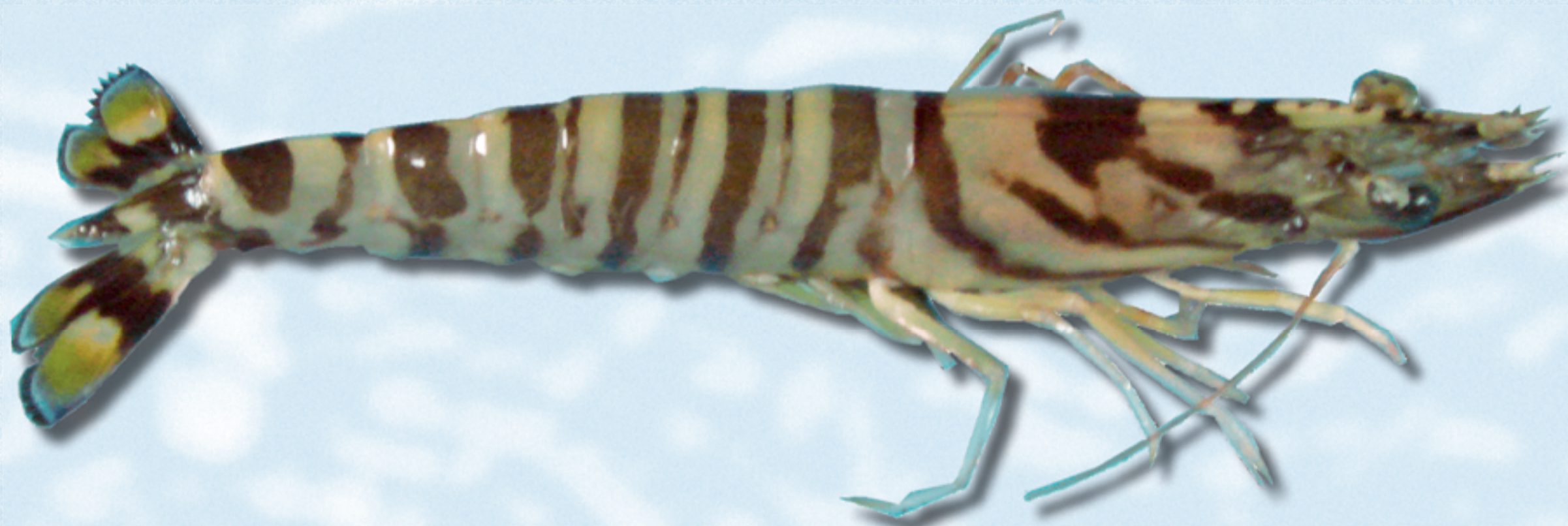
LANGOSTINO TIGRE , Marsupenaeus japonicus

Método de cultivo: jaulas y esteros Zonas: Andalucía, Canarias, Cataluña, C. Valenciana y Murcia.