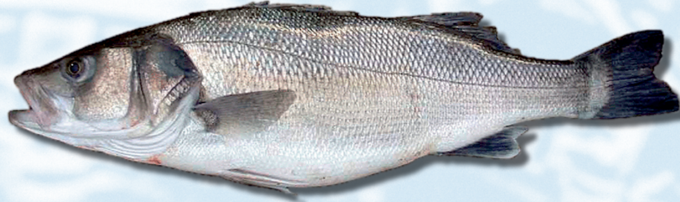
LUBINA , Dicentrarchus labrax

Método de cultivo: esteros y tanques Zonas: Andalucía, Galicia y Murcia.