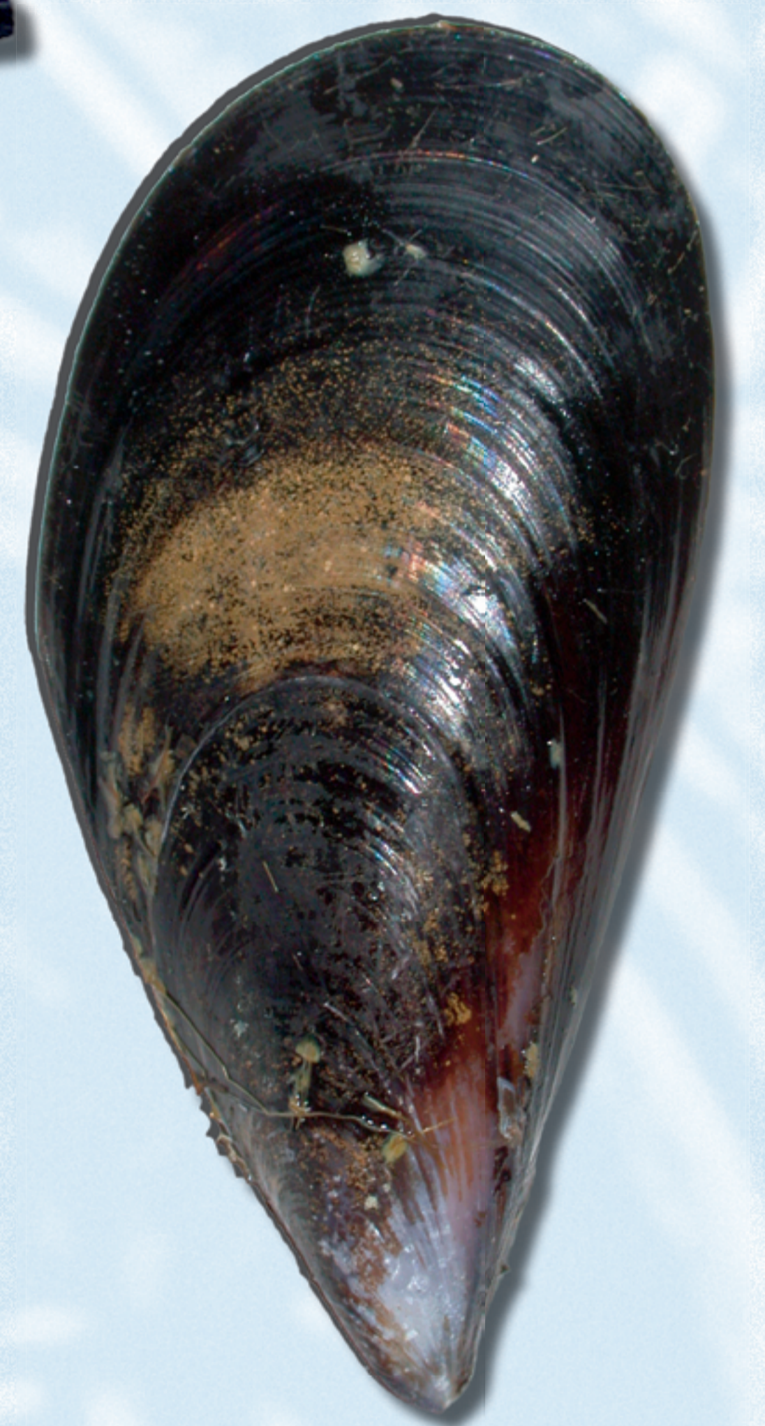
MEJILLÓN , Mytilus edulis

Método de cultivo: estanques de tierra Zonas: Andalucía.