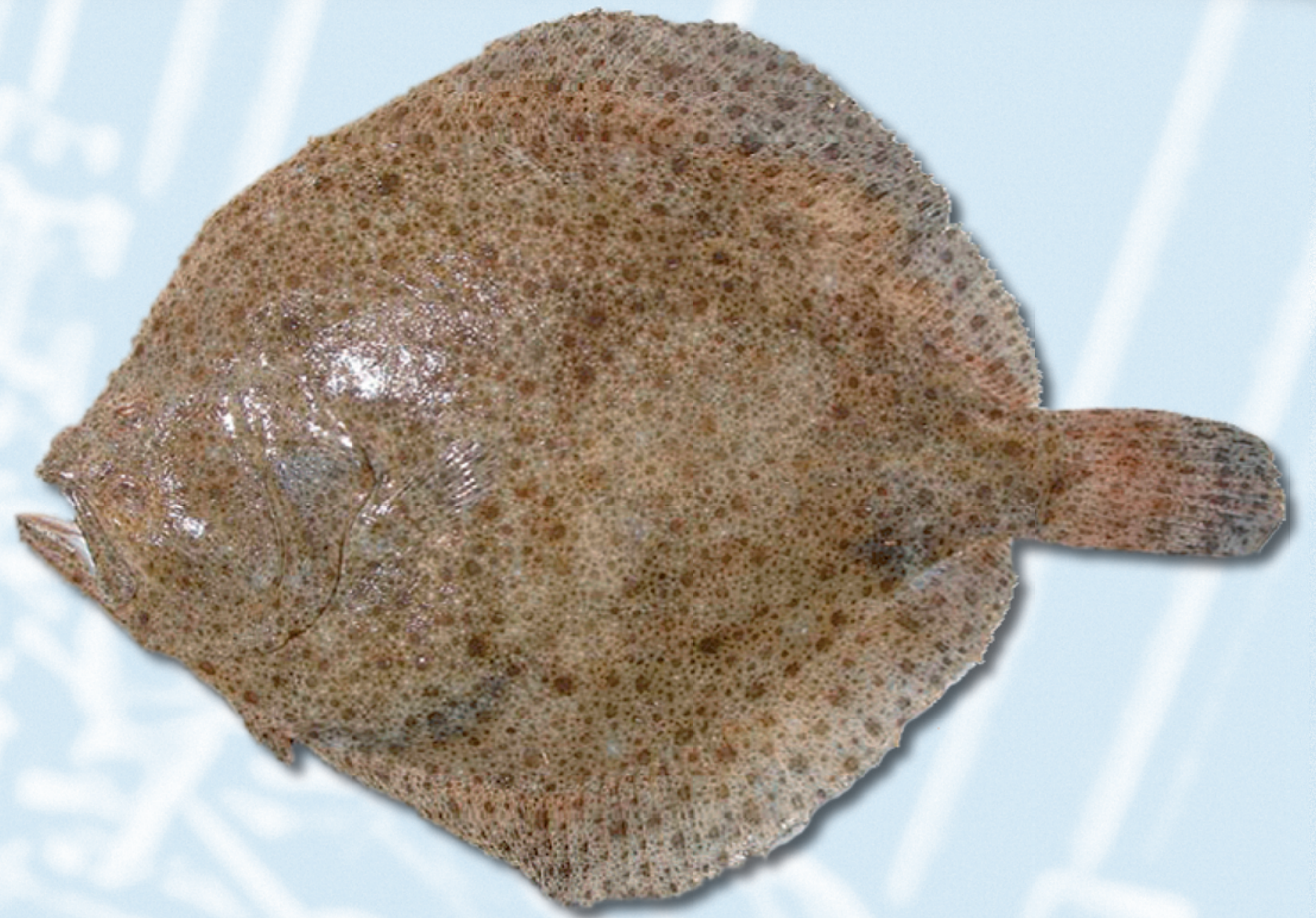
RODABALLO , Psetta maxima

Método de cultivo: jaulas y esteros Zonas: C. Valenciana, Andalucía, Canarias, Murcia, Cataluña y Baleares.