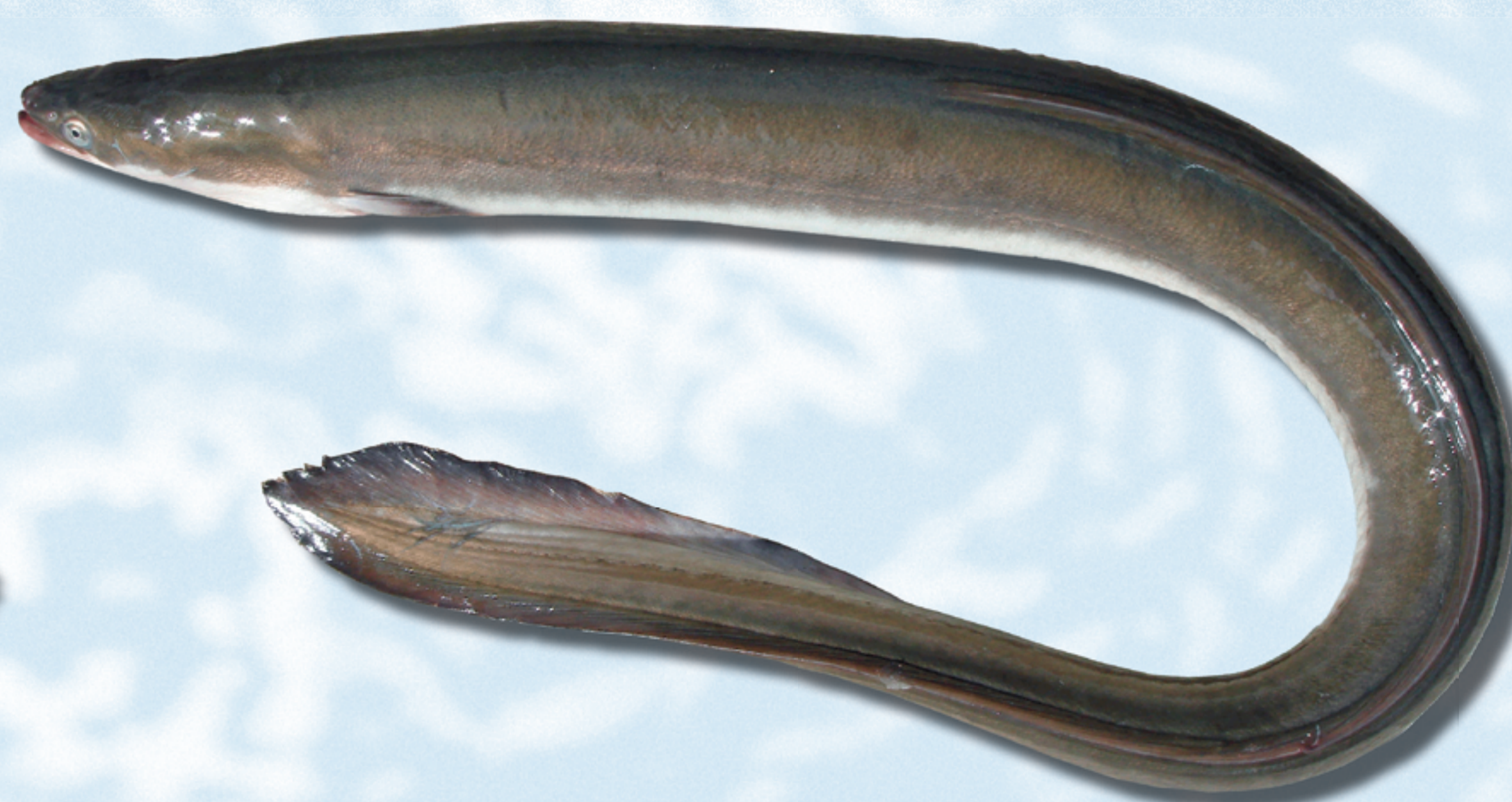
ANGUILA , Anguilla anguilla

Método de cultivo: tanques y jaulas Zonas: Cataluña, Murcia y C. Valenciana.