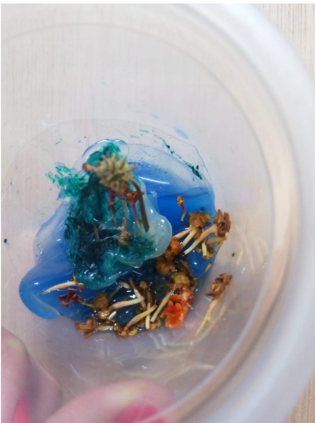
Prueba 1, acrílico, flores y cola sobre recipiente de plástico.