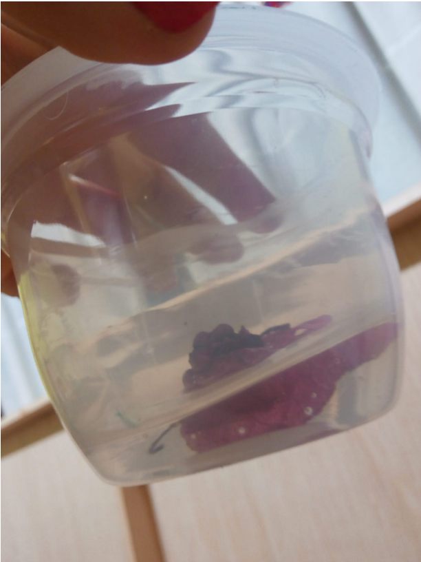
Prueba 2, flor y cola transparente sobre recipiente de plástico.