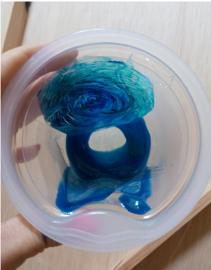
Prueba 3, acetato, acrílico y cola transparente sobre plástico.

En primer lugar, probé utilizar cola transparente, introduciendo diferentes elementos en su interior, incluso tintando la cola de diferentes colores a través de acrílico. Sin embargo, esta idea la descarté, ya que, la cola tardaba mucho en secar y no me permitía trabajar cómodamente. En sustitución de ella cola transparente, utilicé cola termofusible, pero no era buena opción, porque secaba con bastante rapidez y no me permitía introducir objetos en su interior.