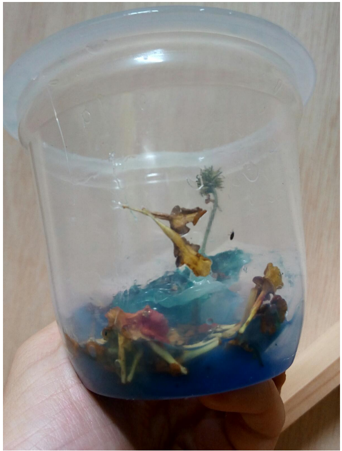
Prueba 1, cola transparente, termofusiblee y flores con acrílico.