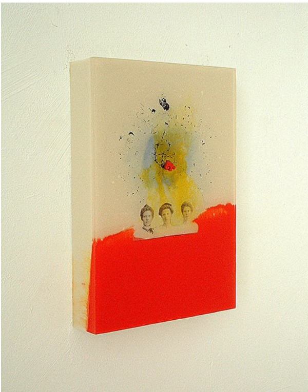
Sisters in blockspace, 1997, Resina de poliéster y collage 18 x 28 x 4 cm

Este escultor es uno de los referentes iniciales del proyecto, ya que utiliza el collage y a la vez que juega con las transparencias y el color.