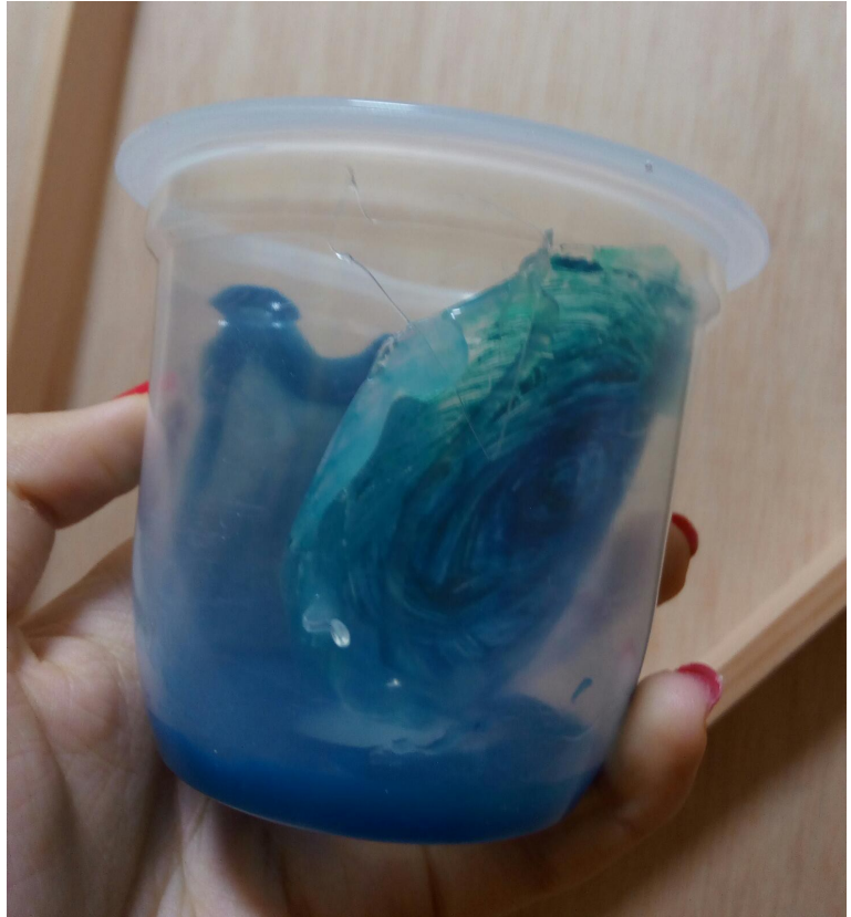
Pueba 3, acetato, cola y acrílico sobre plástico