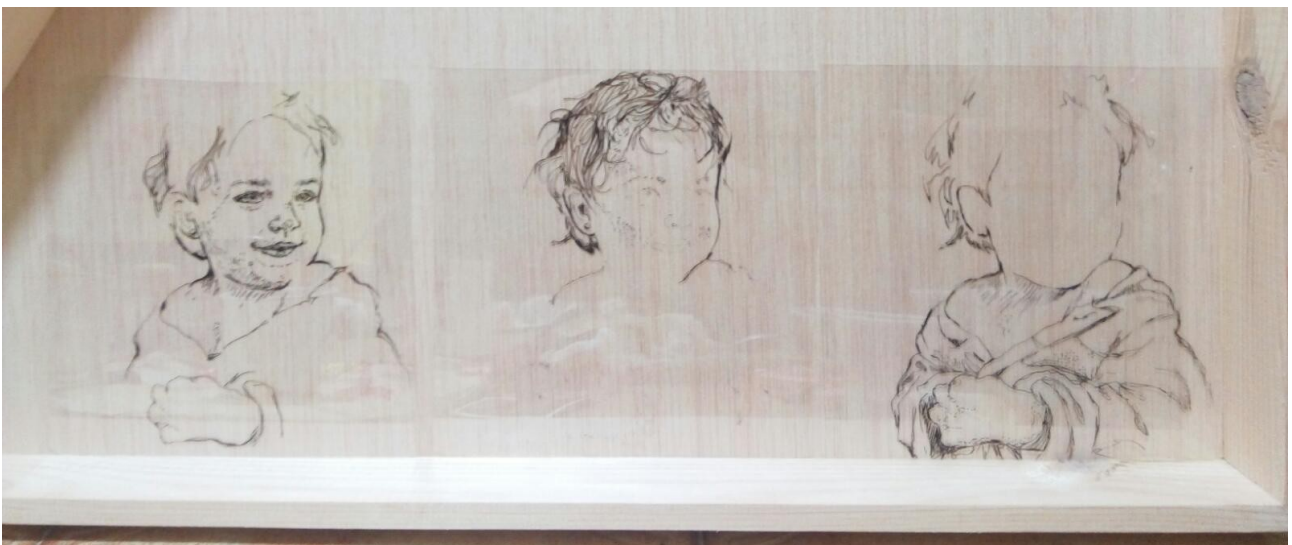
Rotulador permanente sobre acetato.

A continuación, comencé a dibujar retratos en blanco y negro, con rotulador permanente sobre el acetato, pero poco a poco fui introduciendo el color a través de acrílico, porque el soporte era transparente y necesitaba contrastar más los retratos para conseguir mayores resultados ópticos.