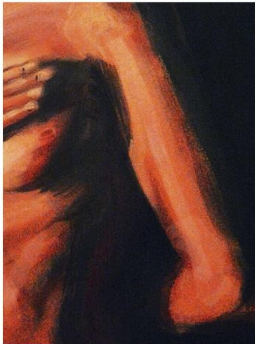
Caperucita "La roja". Lienzo 100x80cm. Imprimación en geso.