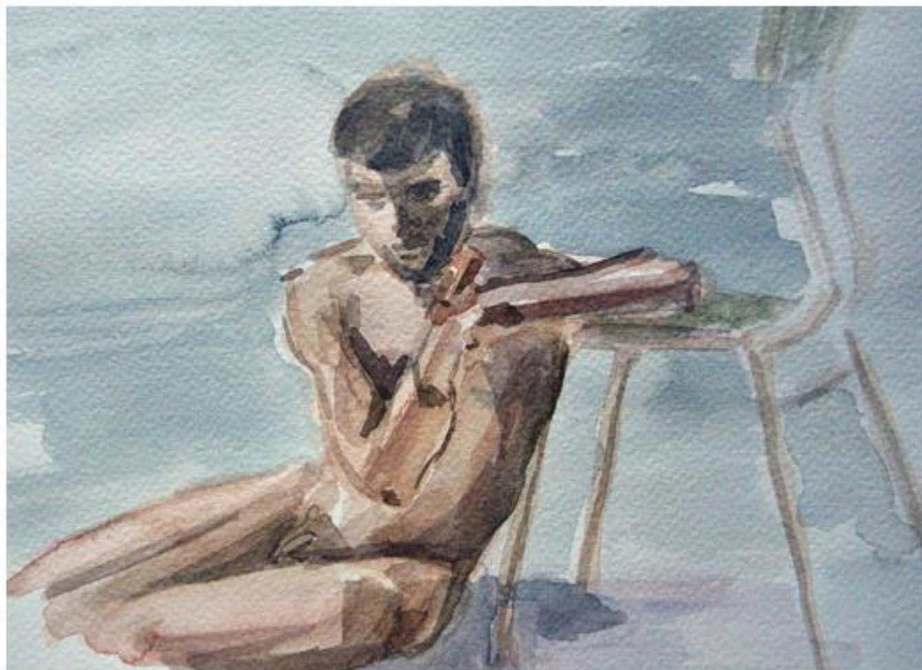
Modelo clase 40x30cm