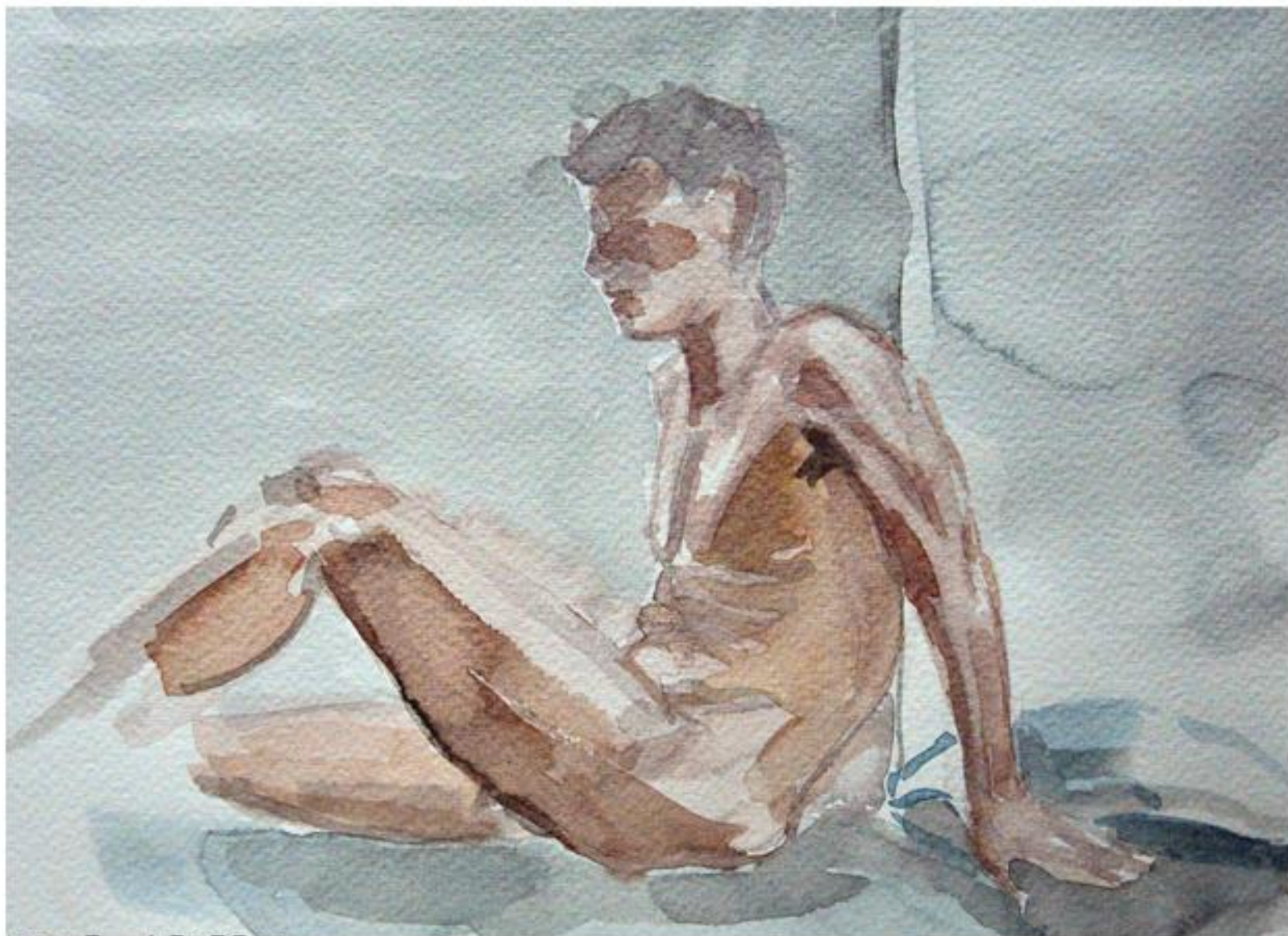
Modelo clase 3 40x30cm