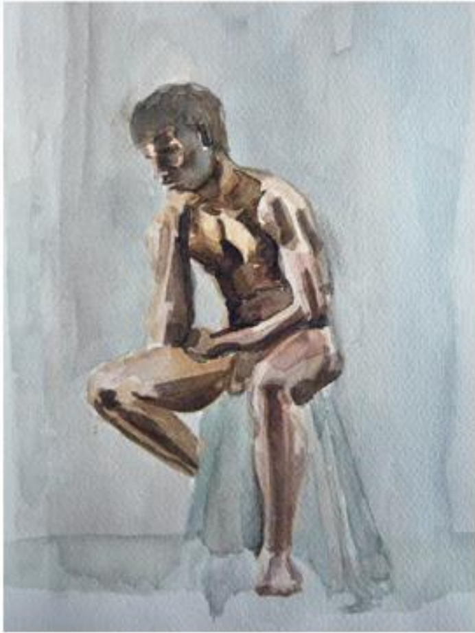
Modelo clase 1 40x30cm