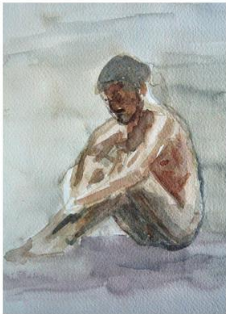
Modelo clase 4 40x30cm