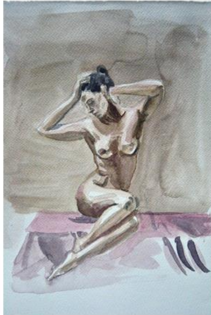
Libre 4 40x30cm