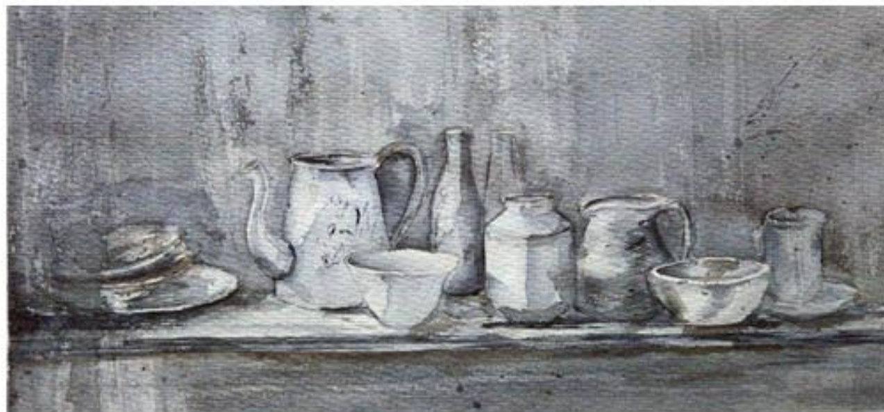
Libre 5 40x30cm