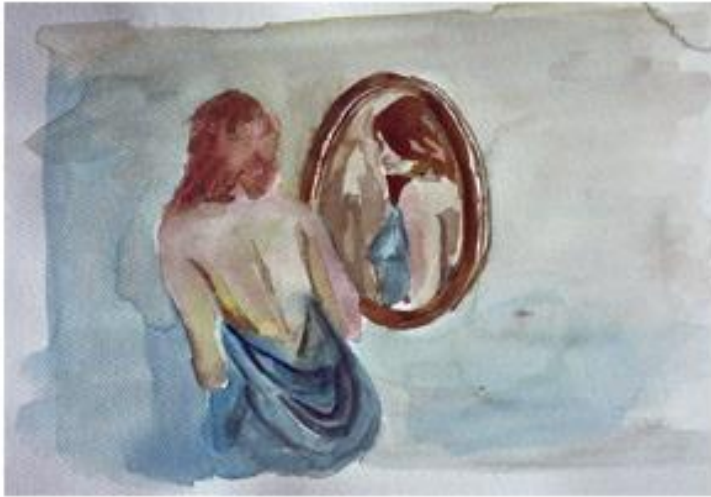
Libre 3 40x30cm