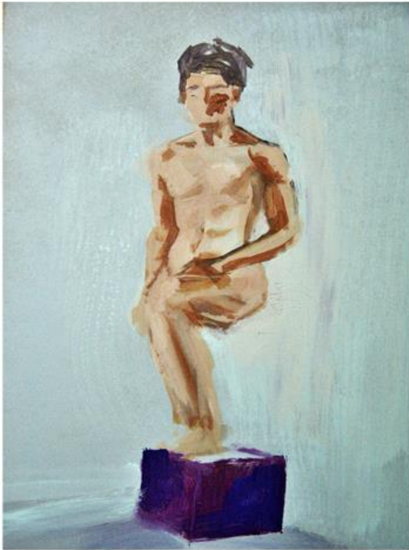
Modelo 1 y 2. DM 35x50 cm.