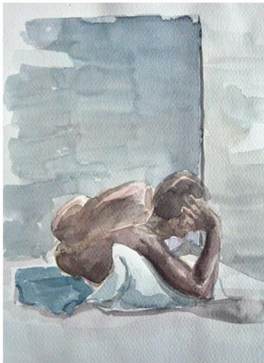
Modelo clase 5 40x30cm