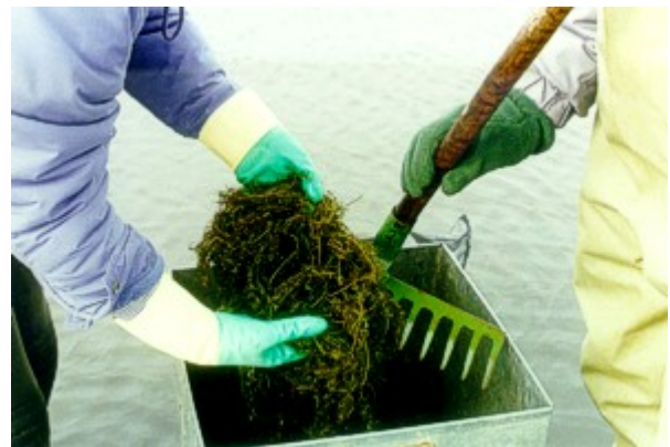
Foto 8.- Muestreo de biomasa en la comunidad de Chara globularis y Myriophyllum alterniflorum en la laguna Redos (León) en Diciembre de 1996.

Por su parte Blindow (1992a) reconoció también la exclusión espacial en lagos moderadamente eutróficos, con fuertes fluctuaciones del nivel del agua, en los que los cambios en la vegetación sumergida fueron estudiados interanualmente. Blindow (1992b) demostró que las diferencias en el nivel del agua en Mayo entre diferentes años causaron años de expansión y años de escasez o declive de Chara tomentosa .