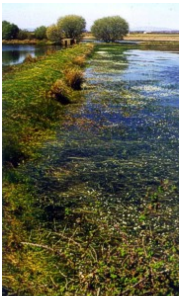
Foto 2.- La laguna de Chozas de Arriba (A), en el Páramo Leonés, Chozas de Arriba (A), que refleja Leonés, es semipermanente y muestra una elevada diversidad de especies (Mayo 1995).

( Foto 4 ). En estas dos lagunas, con tiempos diferentes de retención del agua, se realizó un estudio que puso en evidencia la influencia del régimen hídrico en el esquema de cambio temporal de la abundancia, distribución y diversidad de las especies de macrófitos (Fernández Aláez et al. 1999a). Las dos lagunas poseen una comunidad macrofítica bien desarrollada, de notable diversidad ( Tabla 2 ), indicando con ello que se trata de cuerpos de agua de llenado predecible, que mantienen agua durante varios meses (Comín y Williams 1994). Sin embargo, la mayor persistencia del agua en Chozas C crea mayor disponibilidad de recursos y heterogeneidad ambiental, que se reflejan en valores más altos de diversidad. Cuando la temporalidad es más acusada, como es el caso de Chozas A, la laguna es ambientalmente más uniforme, está ocupada en gran parte por Littorella uniflora y la diversidad es menor.