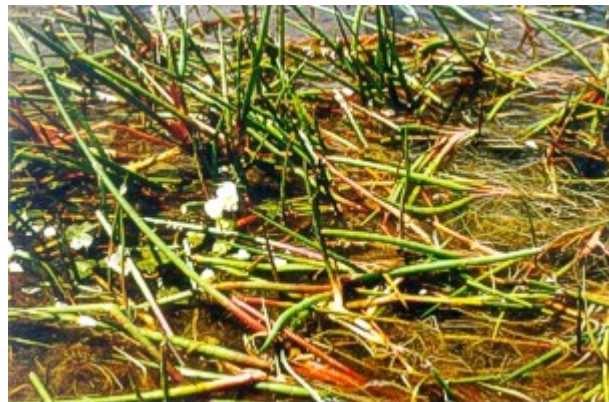
Foto 6.- Juncus heterophyllus en la laguna de Chozas de Arriba (A).