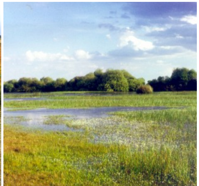
Foto 4.- La laguna de Chozas de Arriba (C) en el Páramo Leonés, Chozas de Arriba (C), que refleja Leonés, es semipermanente y muestra una elevada diversidad de especies (Mayo 1995).