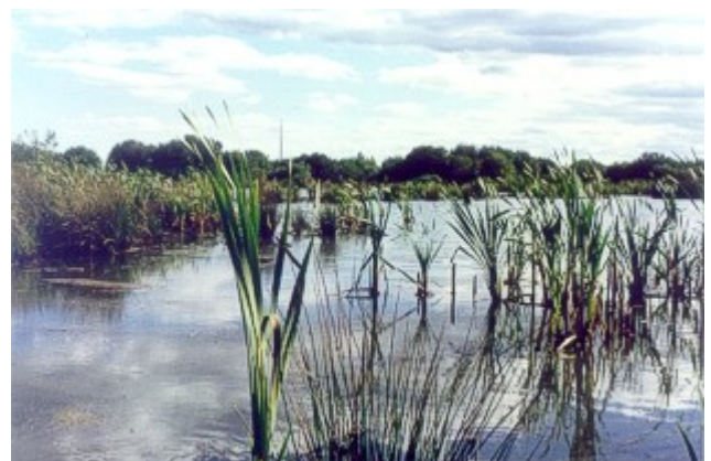
Foto 1.- Laguna de Villadangos situada en el Páramo Leónés.

Son extraordinariamente importantes en la Cuenca del Duero los conjuntos palustres que reciben la descarga de largos flujos regionales, que se relacionan con los acuíferos subterráneos de las grandes formaciones detríticas terciarias. Pero son también de gran singularidad las características lagunas esteparias, someras, parcial o totalmente endorreicas, como las situadas en los Páramos de León ( Foto 1 ) y Palencia. Estas formaciones palustres están asociadas a los depósitos terciarios,