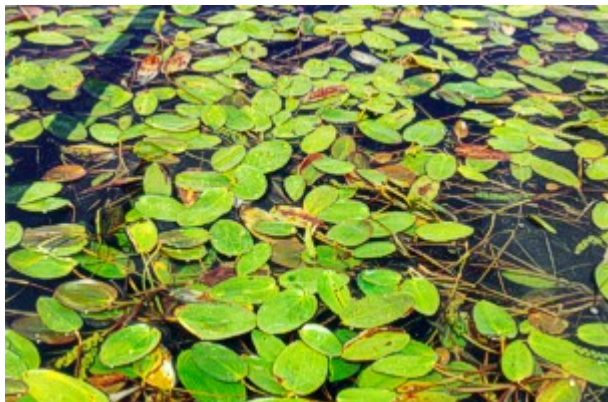
Foto 5.- Formación de Potamogeton natans en la laguna de Chozas de Arriba (C).