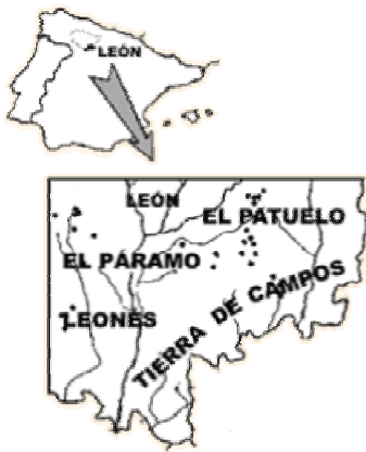
Figura 2.- Localización de las lagunas estudiadas en el sureste de la provincia de León.

En relación con un estudio realizado en 1981 (Fernández Aláez 1984), la riqueza y composición de especies en estas lagunas se han mantenido muy constantes (Fernández Aláez et al. 1999b). No resulta sorprendente esta constancia, puesto que las extinciones locales de las especies de lagunas temporales son raras, a pesar de las posibles variaciones interanuales en la disponibilidad de hábitats (Zedler 1981). Además, las características de estas especies, entre las que se citan su tamaño pequeño, muchas semillas por unidad de biomasa y alta plasticidad reproductiva y vegetativa, reducen la probabilidad de extinción (Williams 1985).