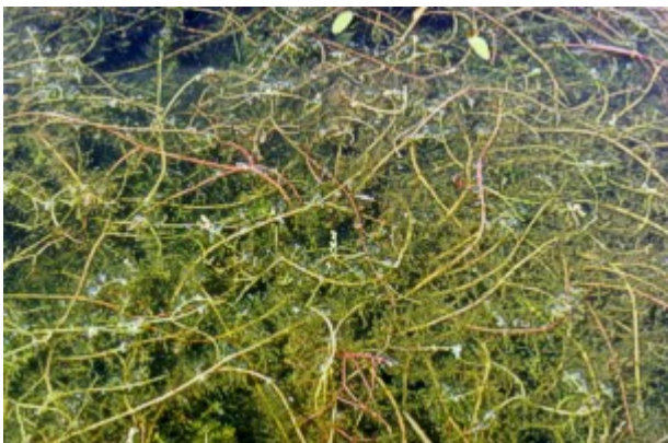
Foto 7.- Comunidad de Chara globularis y Myriophyllum alterniflorum en la laguna Redos (Junio 1996).

comunidad de hidrófitos de Juniode 1996. Es conocido que las angiospermas crecen a mayor profundidad que los carófitos, y que las especies que forman un dosel como Myriophyllum pueden ser mejores competidores que las plantas que tienen una forma de crecimiento que cubre el fondo (Blindow 1992b, Van der Bijl et al. 1989, Van der Berg et al. 1998). Por otra parte, el aumento de turbidez en el agua debió de afectar también al crecimiento de Chara globularis en la primavera de 1997. La laguna Redos permaneció turbia un cierto tiempo después del periodo de llenado, debido a la resuspensión del sedimento (partículas de materiales arcillosos), lo que redujo la disponibilidad de luz para la vegetación sumergida y favoreció a Myriophyllum alterniflorum frente a Chara globularis . En definitiva, Myriophyllum fue mejor competidor que Chara en la laguna Redos.