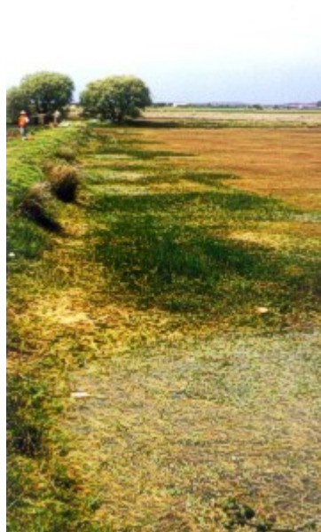
Foto 3.- Aspecto de la cubeta de la laguna de Chozas de Arriba (A), que refleja Leonés, es semipermanente y muestra una elevada diversidad de especies (Mayo 1995).