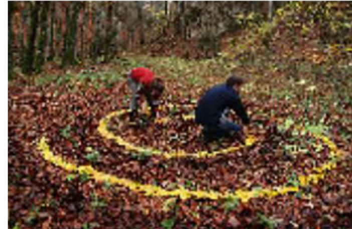
Propuestas de acciones Land Art en la Escuela Infantil