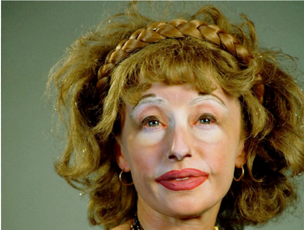
Fig 2. Sin Título Cindy Sherman (2000), http://www.moma.org/interactives/exhibitions/2012/cindysherman/#/8/