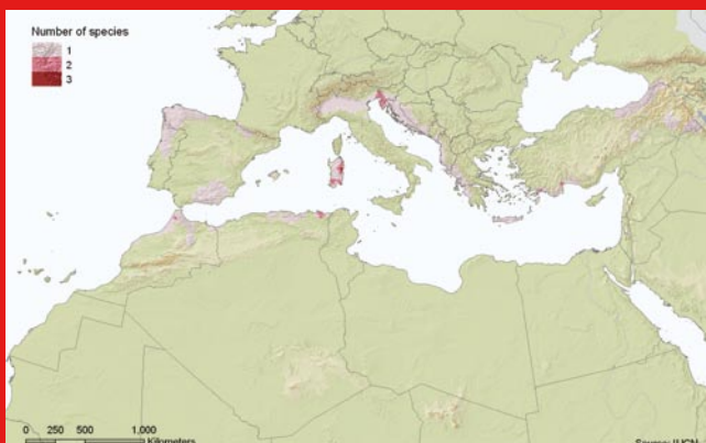
Riqueza de especies de anfibios amenazadas en la cuenca mediterránea.

A pesar de que el porcentaje de anfibios amenazados es alto en la cuenca mediterránea, existen únicamente unos pocos lugares donde se concentran estas especies en peligro, especialmente en Cerdeña, el norte de Argelia, el oeste de Eslovenia y el suroeste de Turquía.