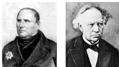
Figura 6.2: Ostrogradski (izquierda) y Hermite

cuya solución es: A = 3/8 = F, B = D = E = 0, C = 5/8 .