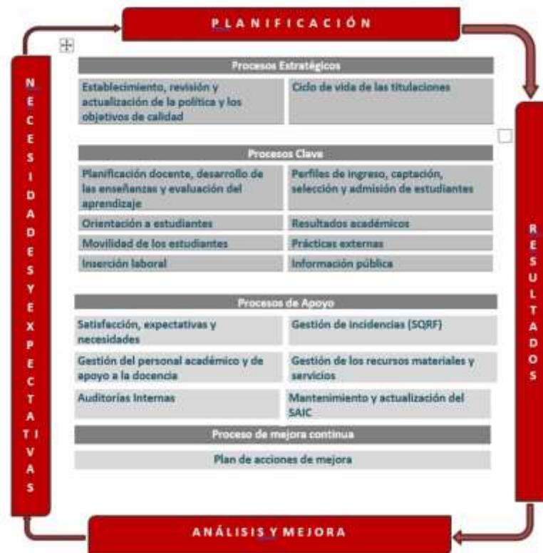
Figura 1. Mapa de Procesos del Sistema Aseguramiento Interno de Calidad.

El Programa de Orientación y tutoría, en el caso de los títulos de ISEN Centro Universitario, consta de: