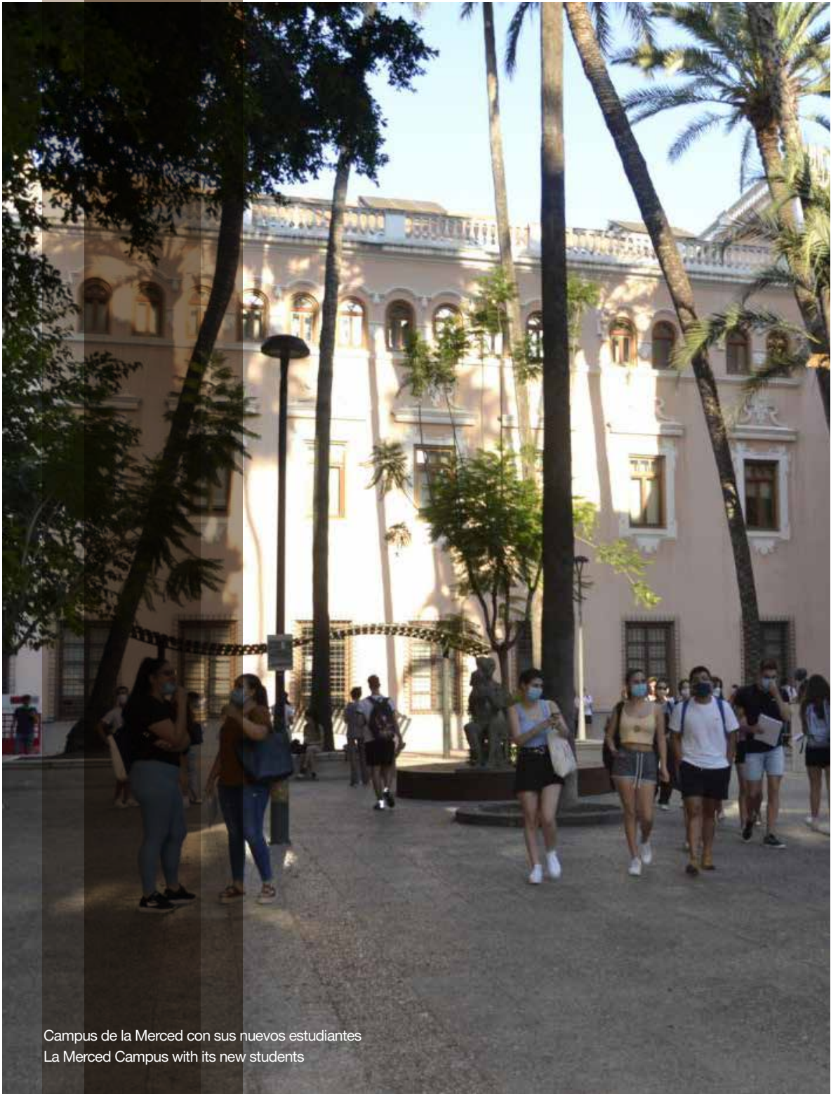
Campus de la Merced con sus nuevos estudiantes La Merced Campus with its new students