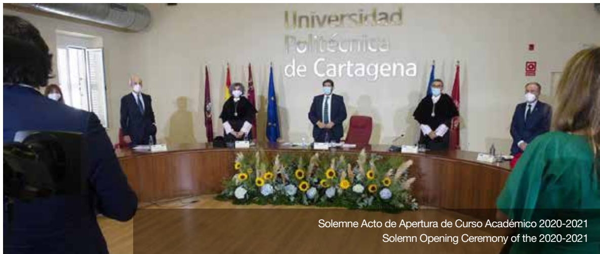
Solemne Acto de Apertura de Curso Académico 2020-2021 Solemn Opening Ceremony of the 2020-2021