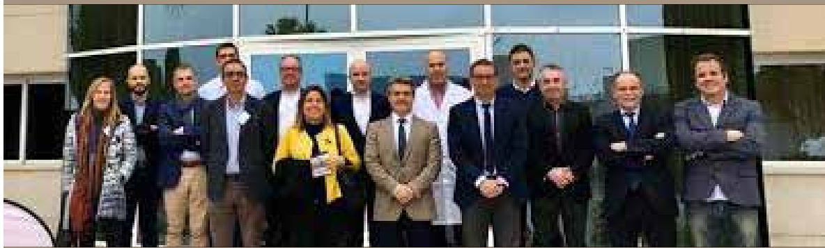
Visita institucional a LINASA Institutional visit to LINASA