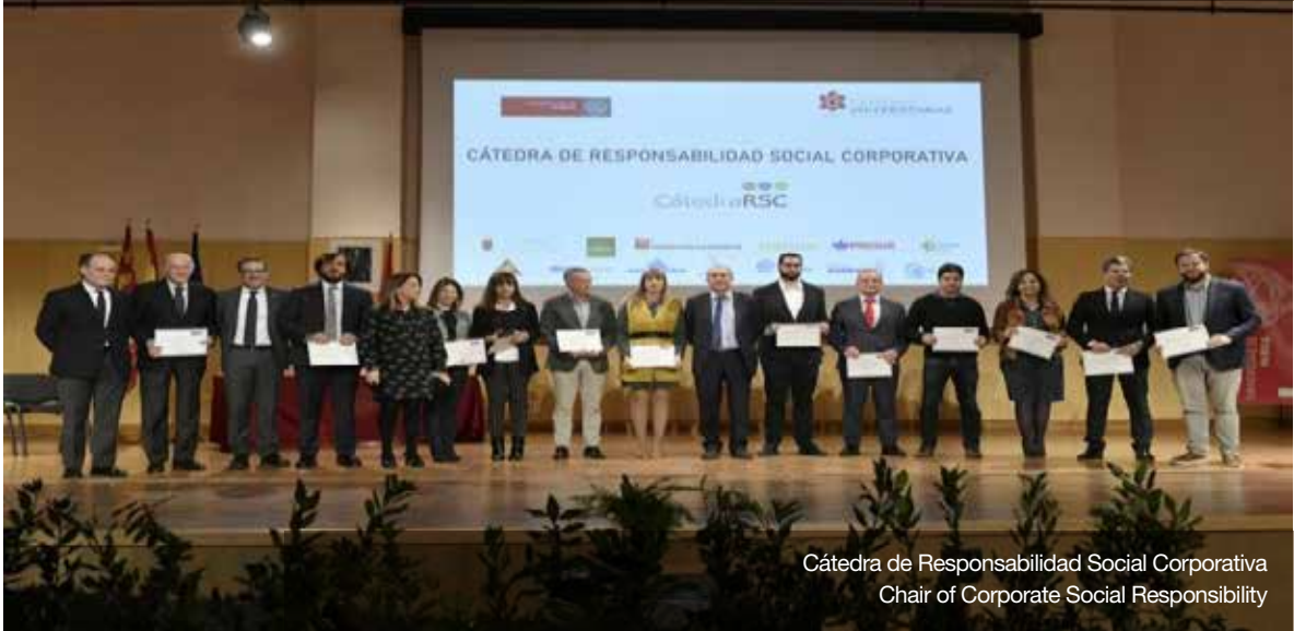
Cátedra de Responsabilidad Social Corporativa Chair of Corporate Social Responsibility