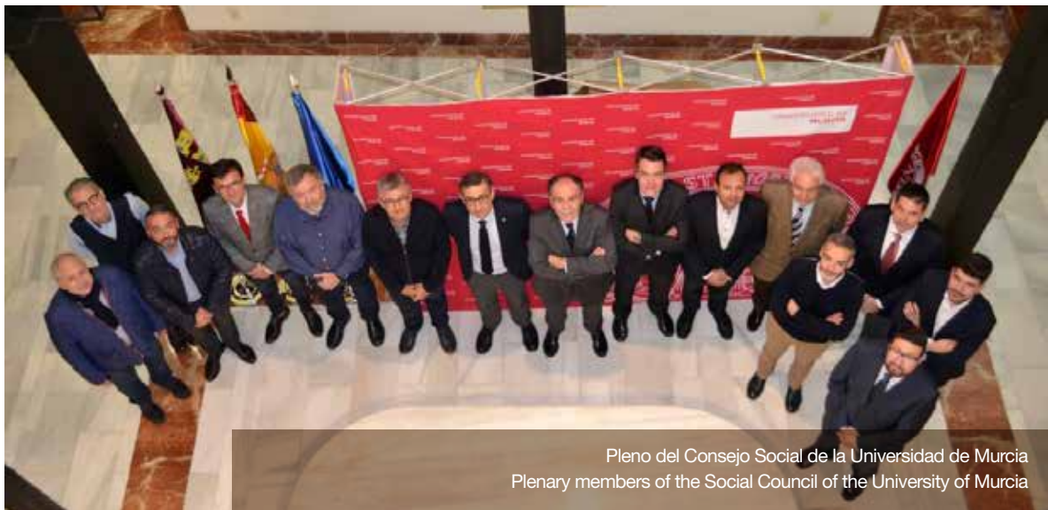
Pleno del Consejo Social de la Universidad de Murcia Plenary members of the Social Council of the University of Murcia