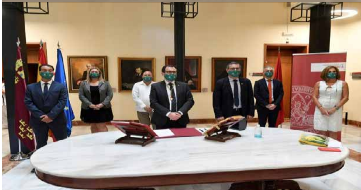
Toma posesión Equipo Decanal de la Facultad de Veterinaria de la Universidad de Murcia Taking office of the Dean and Dean Team of the Faculty of Veterinary of the University of Murcia