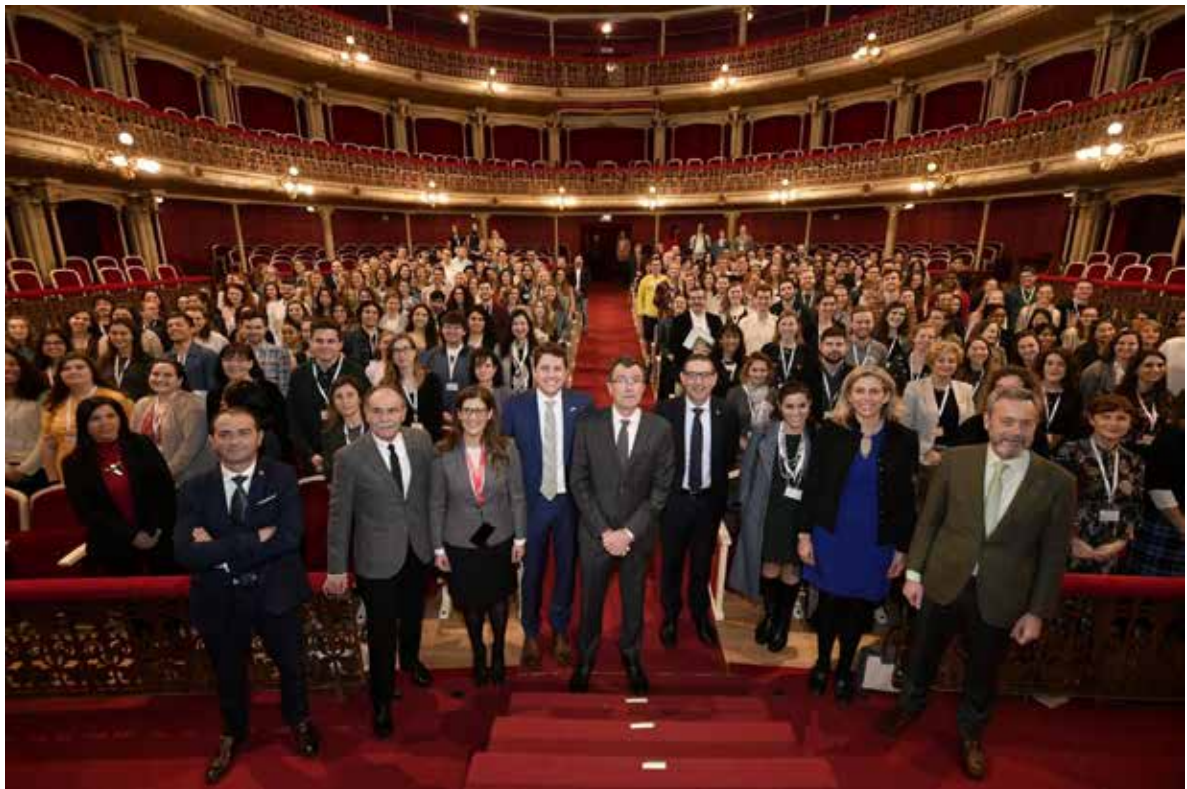
Celebración del Fulbright Mid-Year 2020, en el Teatro Romea de Murcia During the celebration Fulbright Mid-Year 2020 in the Teatro Romea of Murcia

El Presidente ha asistido a los actos de inauguración siguientes: VI Jornadas: “Una Educación para el siglo XXI. Miradas desde las Ciencias y las Artes”, Seminario en Teatro Romea: del Fulbright Mid-Year 2020 del Área de Relaciones Internacionales del Vicerrectorado de Investigación e Internacionalización, Semana Cultural Japonesa del dicho Vicerrectorado, inauguración de ODSesiones del Responsabilidad Social y Transparencia, inauguración oficial del nuevo Centro Tecnológico de Gestión Sostenible del Agua Dinapsis: “Dinapsis, el futuro del agua”, entre otros.