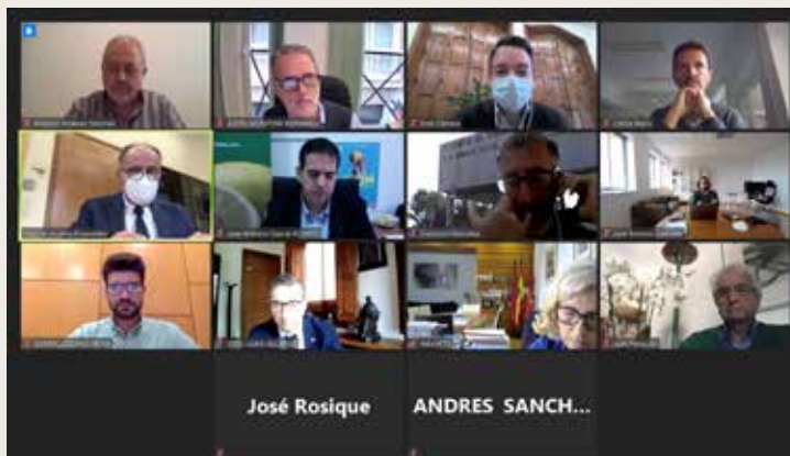
Pleno del Consejo Social de la Universidad de Murcia Plenary Session of the Social Council of the University of Murcia