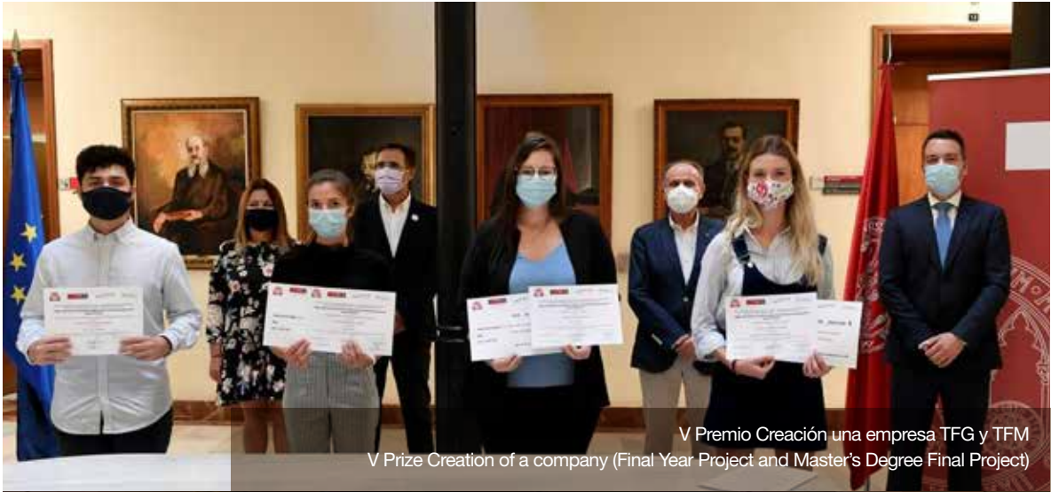
V Premio Creación una empresa TFG y TFM V Prize Creation of a company (Final Year Project and Master's Degree Final Project)