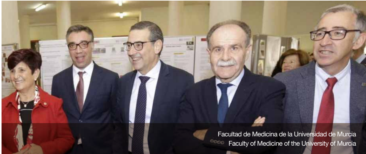
Facultad de Medicina de la Universidad de Murcia Faculty of Medicine of the University of Murcia