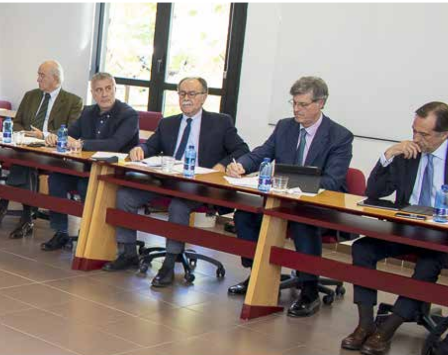
Reunión del Patronato Fundación Universidad Empresa de la Región de Murcia