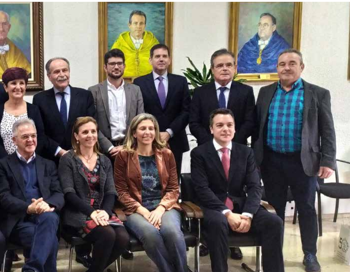
Pleno del Consejo Social en el Salón de Actos de la Facultad de Medicina Plenary members of the Social Council of the University of Murcia in the Faculty of Medicine