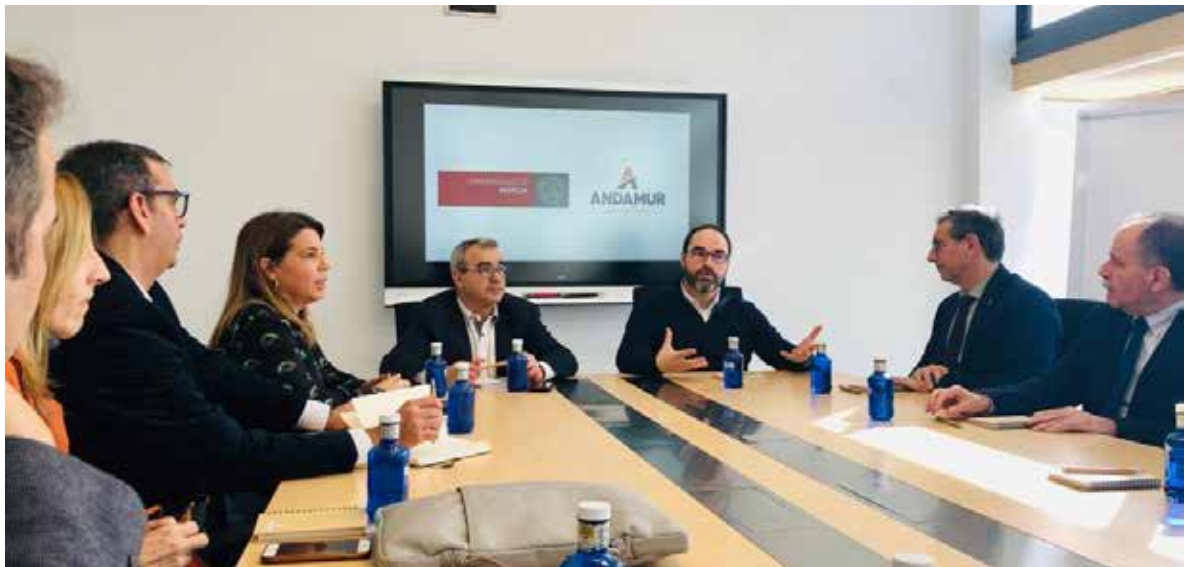
Visita institucional a ANDAMUR Institutional visit to ANDAMUR

El Presidente, junto a parte del Equipo de Gobierno de la Universidad de Murcia, ha participado en las visitas a diferentes instituciones regionales como al Ayuntamiento de La Unión, y a sedes de empresas murcianas, tan relevantes como la empresa ANDAMUR, en sus instalaciones de Lorca. Así como a la Industria Jabonera Lina SAU – (LINASA), en Torres de Cotillas, Murcia. Igualmente, ha colaborado en las reuniones de trabajo con representantes de diferentes sectores empresariales, celebradas en nuestra Universidad.