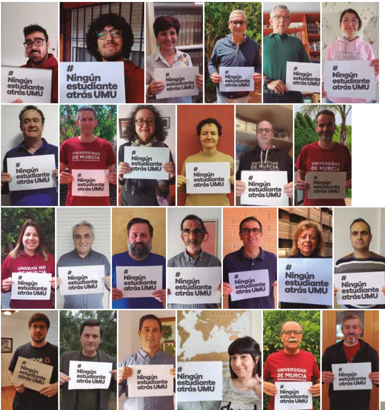
Campaña “#Ningún estudiante atrás UMU” / Campaign “# No student behind UMU