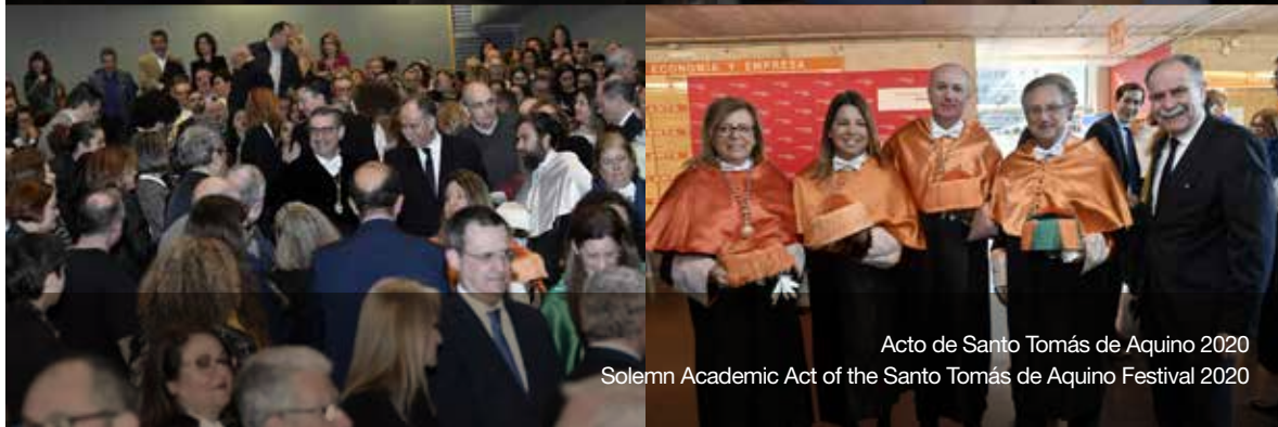
Acto de Santo Tomás de Aquino 2020 Solemn Academic Act of the Santo Tomás de Aquino Festival 2020