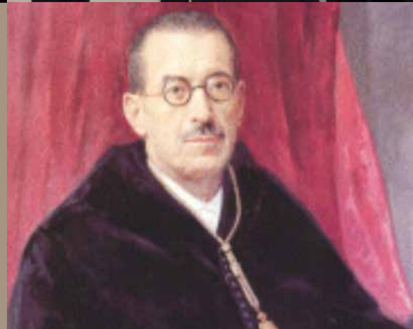
Convocatoria del: Premio ‘José Loustau 2020’ al Espíritu Universitario y Valores Humanos Announcement of: ‘José Loustau 2020’ Award to the University Spirit and Human Values