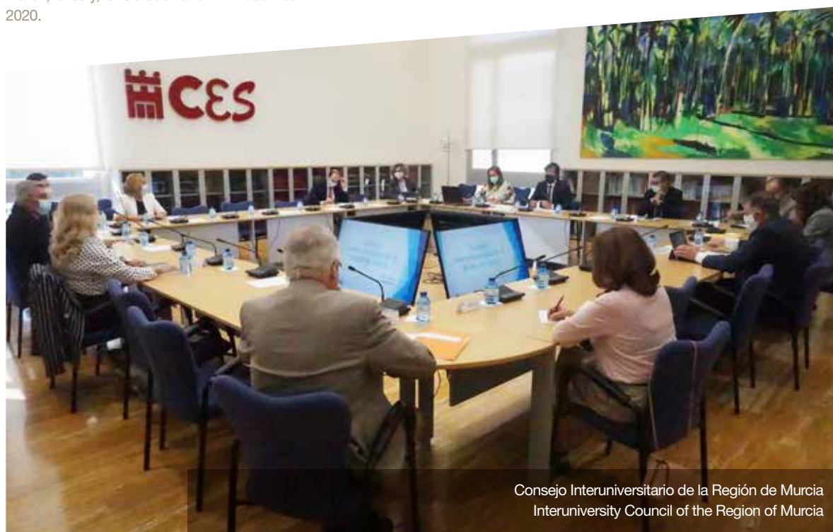
Consejo Interuniversitario de la Región de Murcia Interuniversity Council of the Region of Murcia