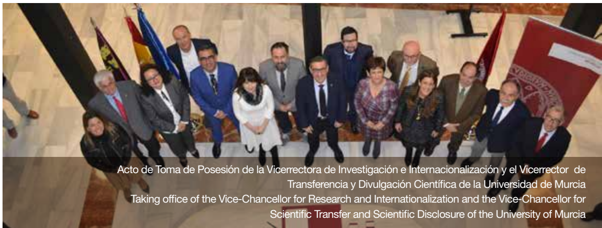
Acto de Toma de Posesión de la Vicerrectora de Investigación e Internacionalización y el Vicerrector de Transferencia y Divulgación Científica de la Universidad de Murcia Taking office of the Vice-Chancellor for Research and Internationalization and the Vice-Chancellor for Scientific Transfer and Scientific Disclosure of the University of Murcia

También, a los actos de toma de posesión de los nuevos Vicerrectorados del Equipo Rectoral, llamados Investigación e Internacionalización y Transferencia y Divulgación Científica, además de actos de toma de posesión de decanos, decanas y sus respectivos equipos decanales, de catedráticos y catedráticas, profesores y profesoras titulares, así como del personal de administración y servicios.