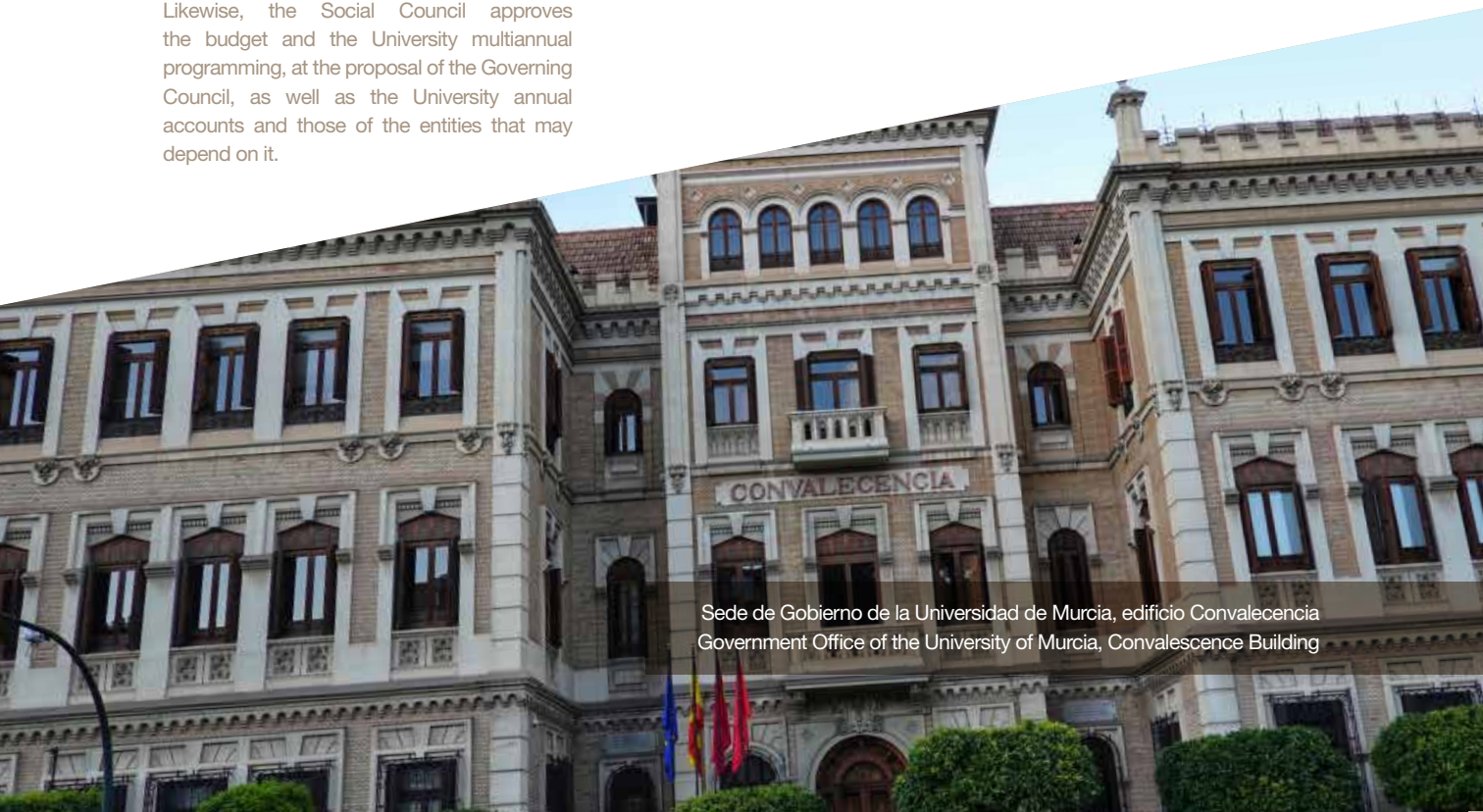
Sede de Gobierno de la Universidad de Murcia, edificio Convalecencia Government Office of the University of Murcia, Convalescence Building

Igualmente, aprueba el presupuesto y la programación plurianual de la Universidad, a propuesta del Consejo de Gobierno, así como de sus cuentas anuales y de las entidades que de ella puedan depender.