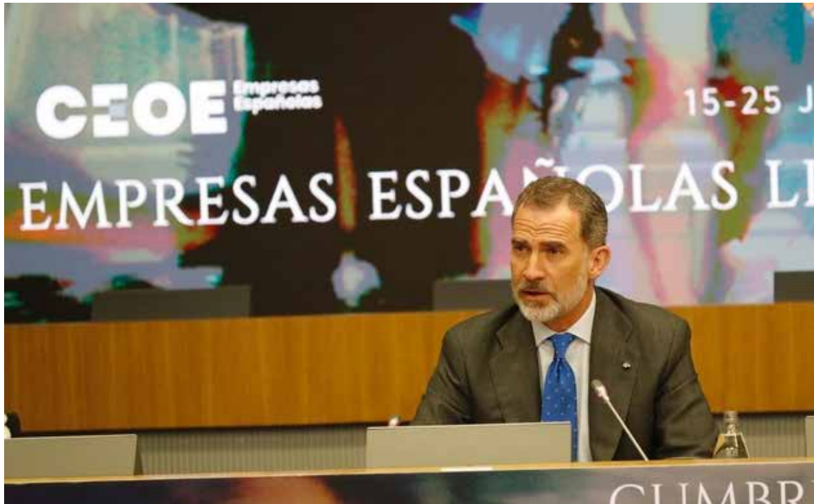
Su Majestad el Rey Don Felipe VI ha presidido el acto de clausura en el que se han presentado las conclusiones del Foro “Empresas españolas liderando el futuro” de la Cumbre Empresarial organizada por la CEOE His Majesty King Felipe VI during the development of the closing ceremony of the Business Summit, “Spanish companies leading the future”

Debemos destacar la participación del Presidente del Consejo Social de la Universidad de Murcia, en el acto Clausura de la Cumbre Empresarial, “Empresas españolas liderando el futuro”, organizado por la Confederación Española de Organizaciones Empresariales (CEOE), con la participación de la Conferencia de los Consejos Sociales de las Universidades Españolas, presidido por Su Majestad el Rey Don Felipe VI.