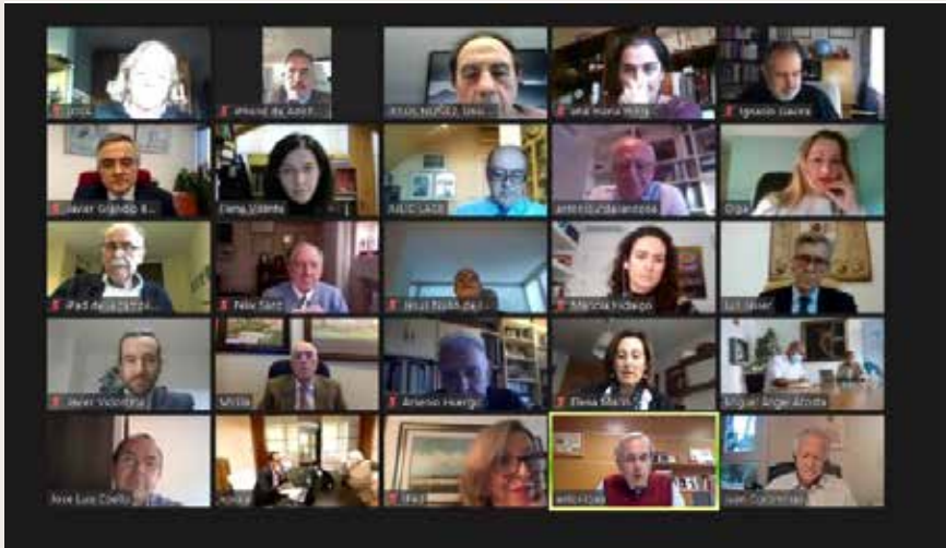
Asamblea General de la Conferencia Sociales de las Universidades Españolas General Assembly of the Conference of Social Councils of Spanish Universities