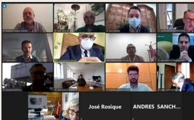
Reunión del Pleno del Consejo Social de la Universidad de Murcia Plenary Session of the Social Council of the University of Murcia