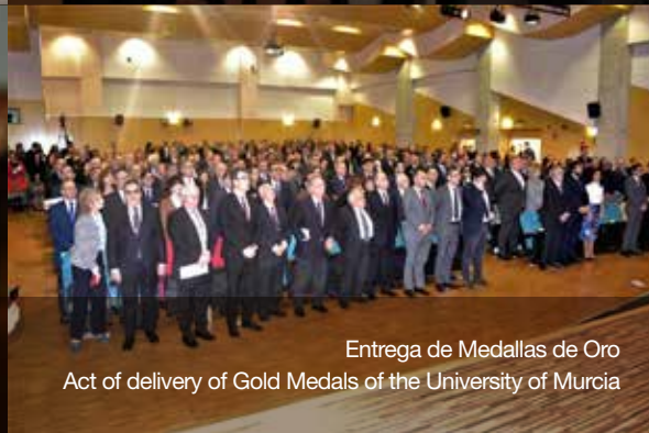
Entrega de Medallas de Oro Act of delivery of Gold Medals of the University of Murcia