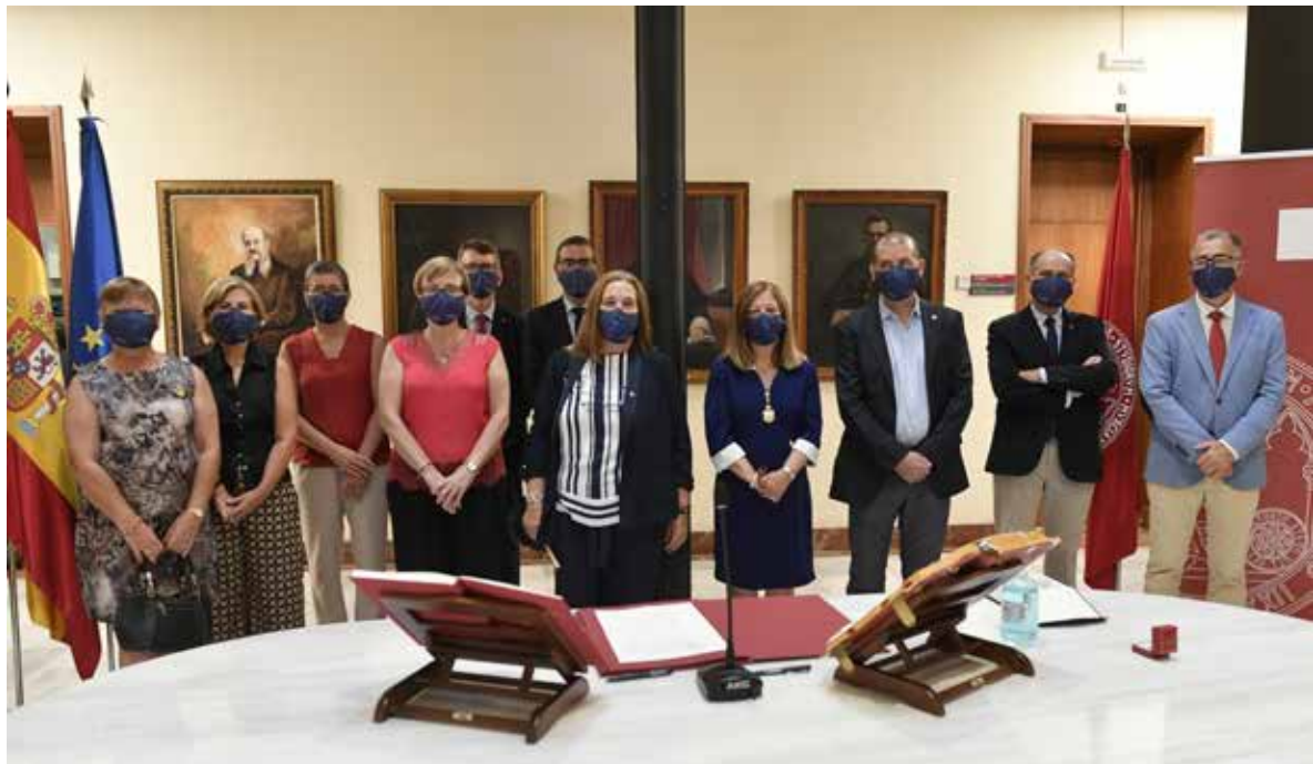
Toma Posesión Equipo Decanal de la Facultad de Biología de la Universidad de Murcia Taking office of the Dean and Dean Team of the Faculty of Biology of the University of Murcia