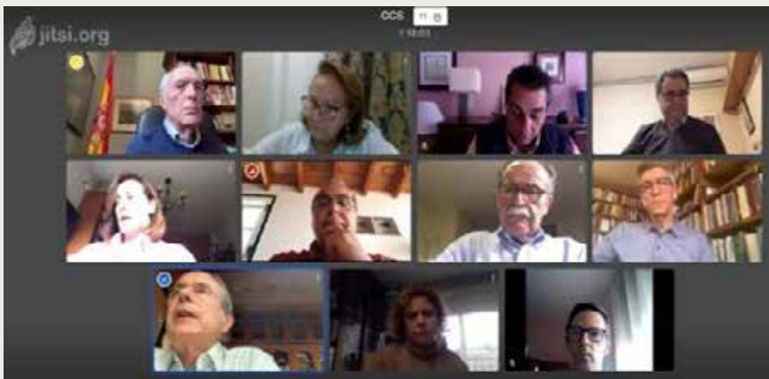
Comité Ejecutivo de la Conferencia de Consejos Sociales de Universidades Españolas Executive Committee of the Conference of Social Councils of Spanish Universities