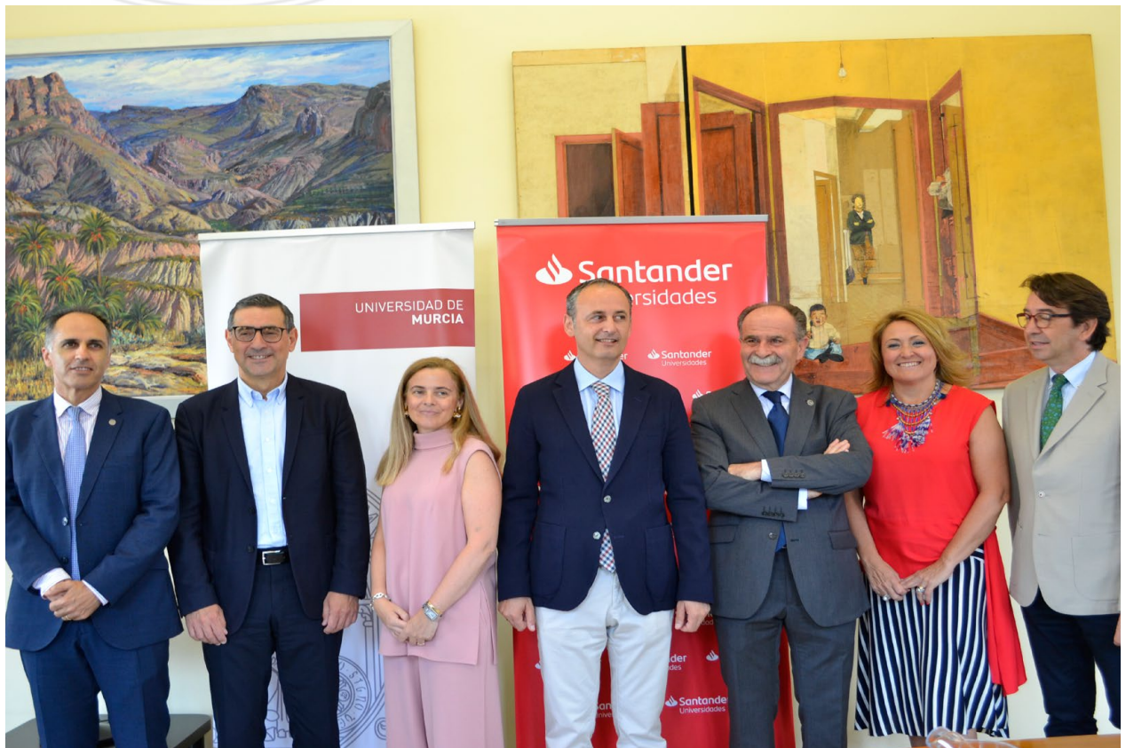
Banco de Santander, CARM, Universidad de Murcia y Universidad Politécnica de Cartagena Santander Bank, CARM, University of Murcia and Polytechnic University of Cartagena