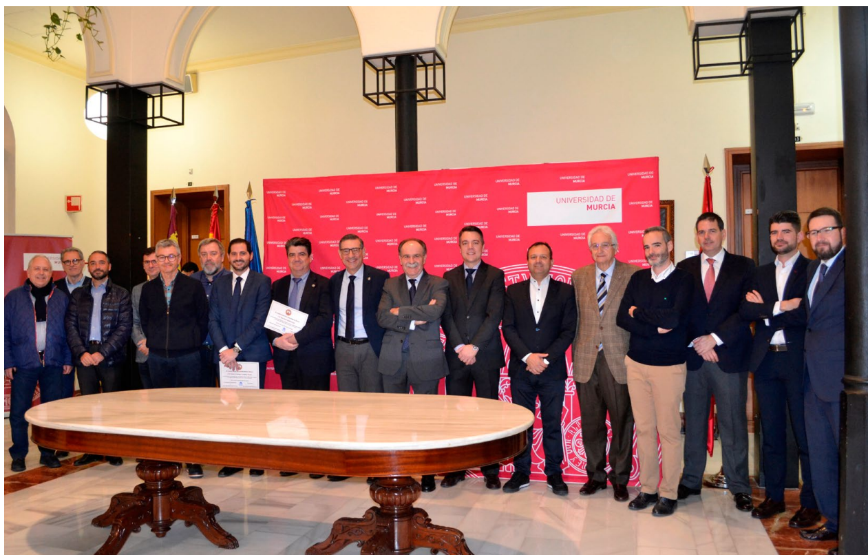
Pleno del Consejo Social de la Universidad de Murcia / Plenary members of the Social Council of the University of Murcia