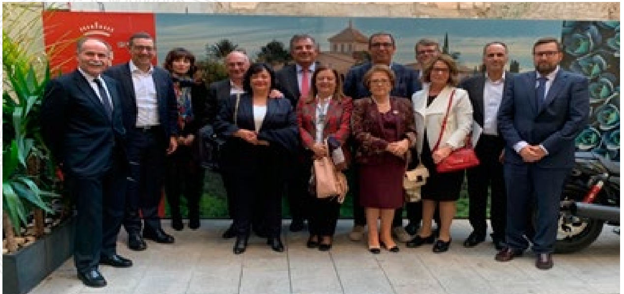
Doctor Honoris Causa Excmo. Sr. D. Francisco Juan Martínez Mojica / Doctor Honoris Causa of the Hon. Mr. Francisco Juan Martínez Mojica