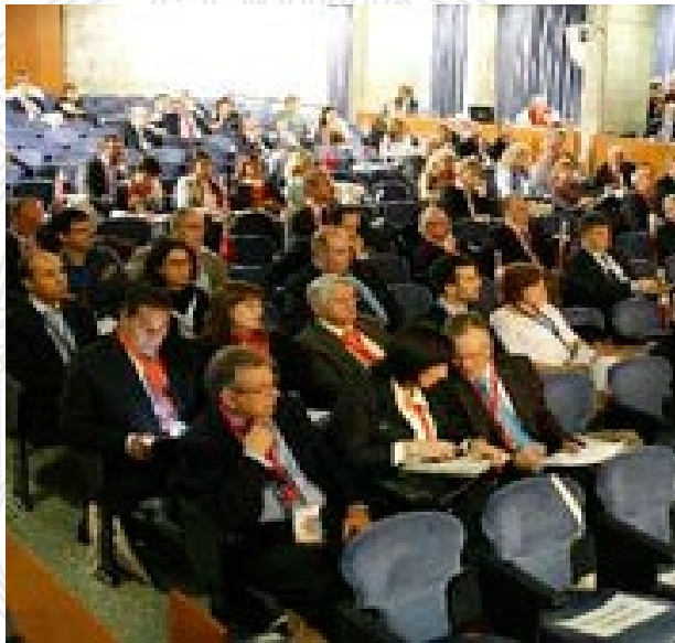
Asamblea General General Assembly