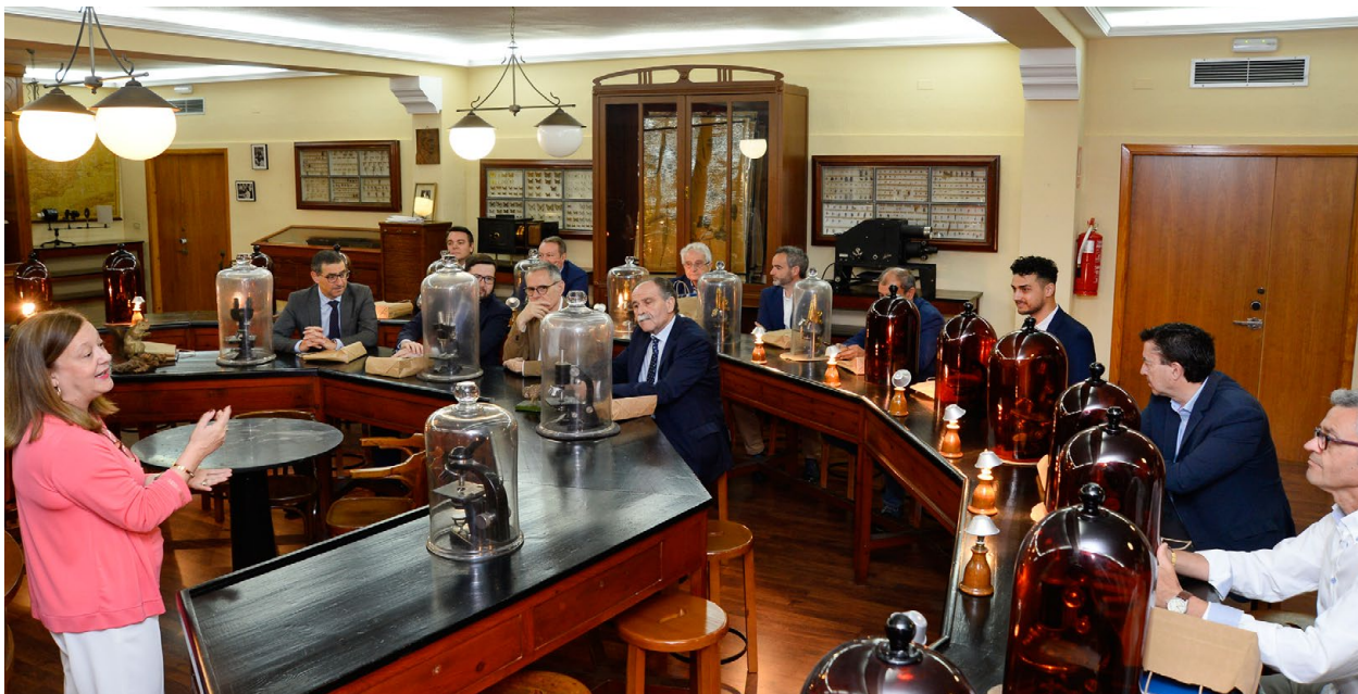
Pleno Consejo Social de la Universidad de Murcia en el Museo Loustau de la Facultad Biología Plenary session of the Social Council of the University of Murcia in the Loustau Museum of the Faculty of Biology

En cada visita, se volcaron los Equipos Decanales, participando y mostrando activamente la historia de sus centros, las principales actividades realizadas, sus proyectos e inquietudes.