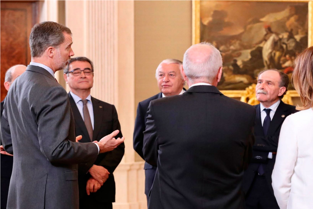
Su Majestad el Rey Felipe VI durante el desarrollo de la audiencia con el Comité Ejecutivo de Consejos Sociales. His Majesty King Felipe VI during the development of the audience with the Executive Committee of Social Councils