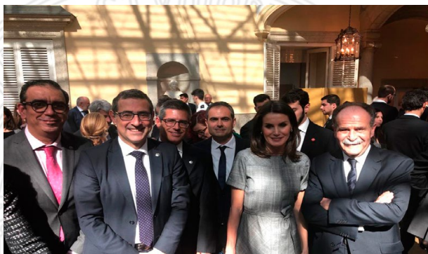
Junto a S.M. la Reina D. a Letizia Ortiz The President next to Queen Letizia Ortiz