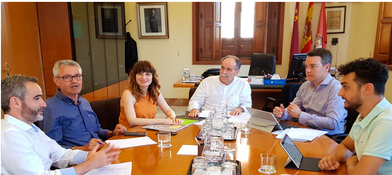
Reunión de la Comisión Académica del Consejo Social / Meeting of the Committee on Academic Affairs of the Social Council