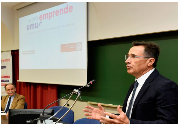
Inauguración UMU Emprende Inauguration of UMU Emprende

A este respecto, el Consejo Social ha financiado la oficina de internacionalización de la Facultad de Economía y Empresa como prueba piloto para su difusión por el resto de Facultades de la Universidad de Murcia.