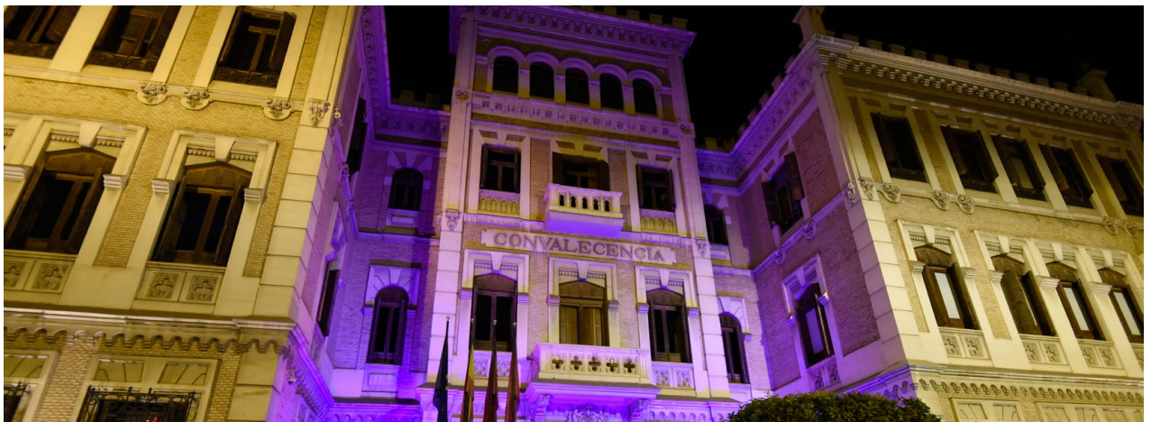
Sede de Gobierno de la Universidad de Murcia, edificio Convalecencia contra la Violencia de Género Government Office of the University of Murcia, Convalescence building against Gender Violence

Likewise, the Social Council approves the budget and the University multiannual programming, at the proposal of the Governing Council, as well as the University annual accounts and those of the entities that may depend on it.