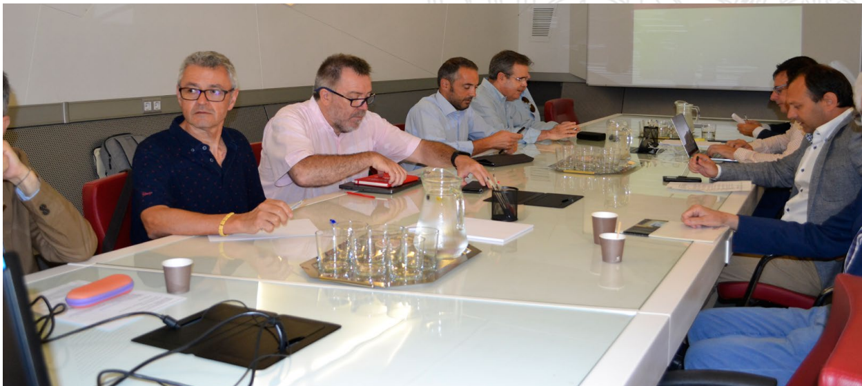
Reunión del Pleno del Consejo Social de la Universidad de Murcia / Plenary Session of the Social Council of the University of Murcia