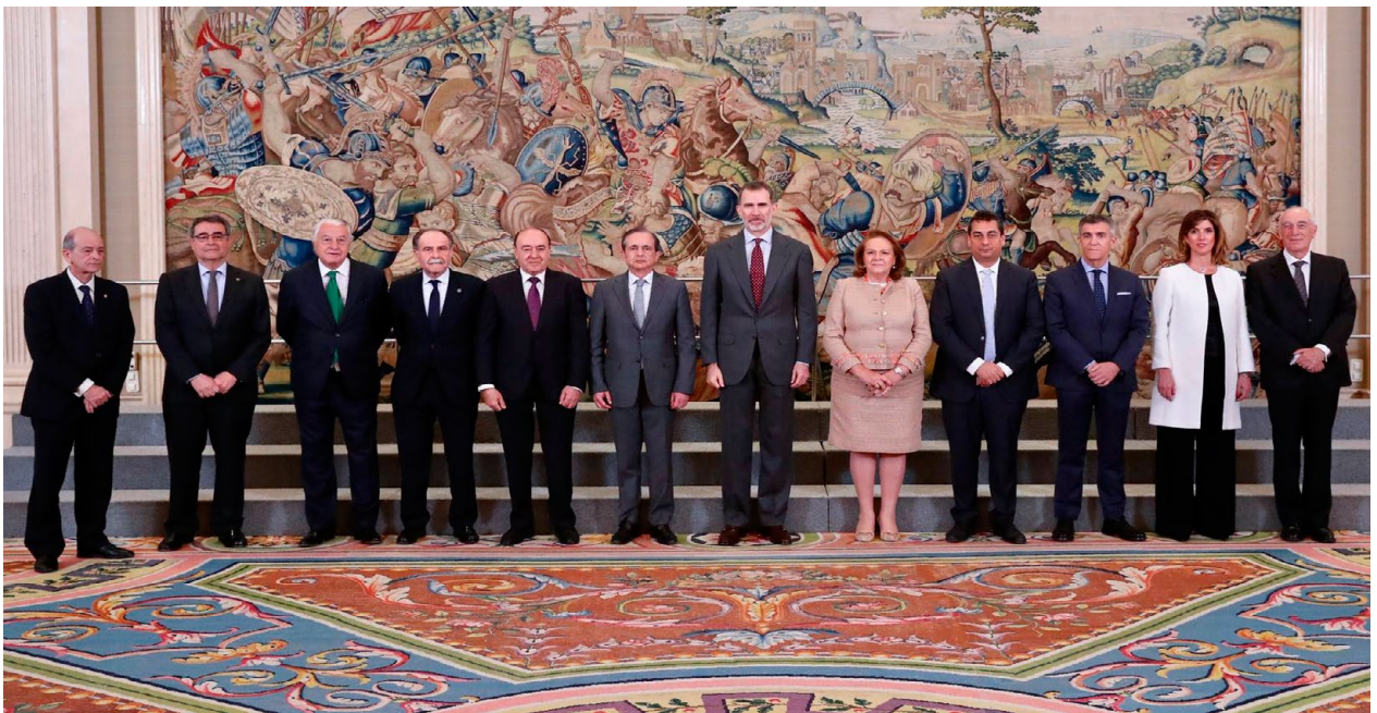
S.M. el Rey Felipe VI con el Comité Ejecutivo de la Conferencia de Consejos Sociales de las Universidades Españolas en el Palacio de la Zarzuela His Majesty King Felipe VI with the Executive Committee of the Conference of Social Councils of Spanish Universities at the Zarzuela Palace

Especialmente outstanding was last 3 April, 2019, when King Felipe VI held an audience with the Executive Committee of the Conference of Social Councils of Spanish Universities at the Zarzuela Palace. During this audience, the Executive Committee transmitted to His Majesty the King the “extraordinary importance of the university in the training of talent, the true engine of economic development and social welfare”.