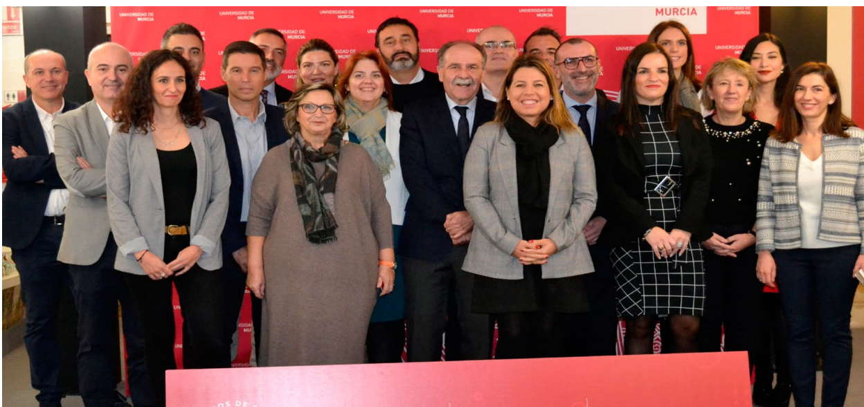
Reunión con Empresas en la sede UMU / Meeting with regional companies at the headquarter of UMU