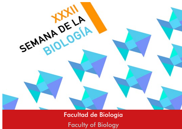
Facultad de Biología Faculty of Biology