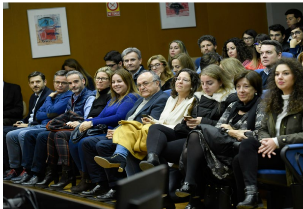
Público asistente a UMU Emprende Audience at UMU Emprende