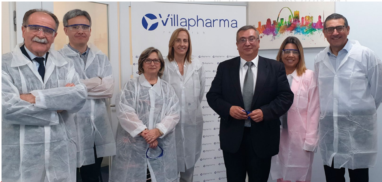
Visita a Villapharma Research S.L. (Fuente Álamo, Murcia) / Visit to Villapharma Research S.L. (Fuente Álamo, Murcia)

Igualmente, ha colaborado en las reuniones de trabajo con representantes de diferentes sectores empresariales, celebradas en nuestra Universidad.