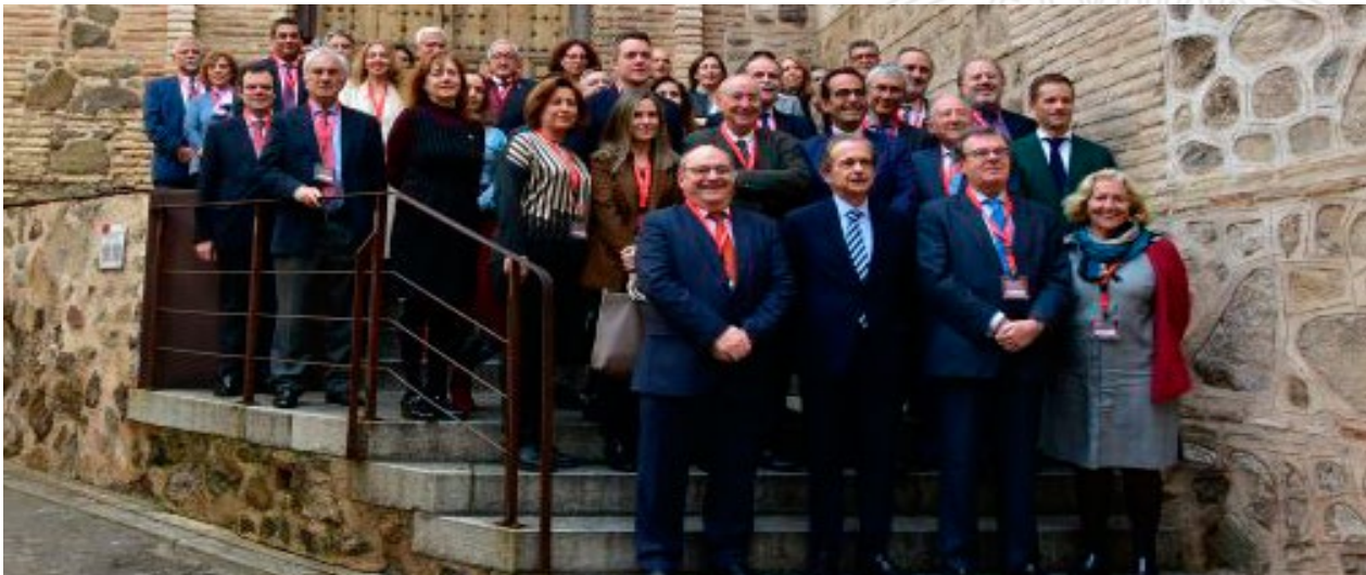
Jornadas Anuales de la Conferencia de Consejos Sociales de las Universidades Españolas en Toledo. Annual Conference of the Conference of Social Councils of Spanish Universities in Toledo

The President of the Social Council of the University of Murcia is still part of the Executive Committee of the CSC, being one of its eleven members. In addition, he is also a member of the Academic Committee and the Transfer and Relations with Society Committee of the Conference of Social Councils.