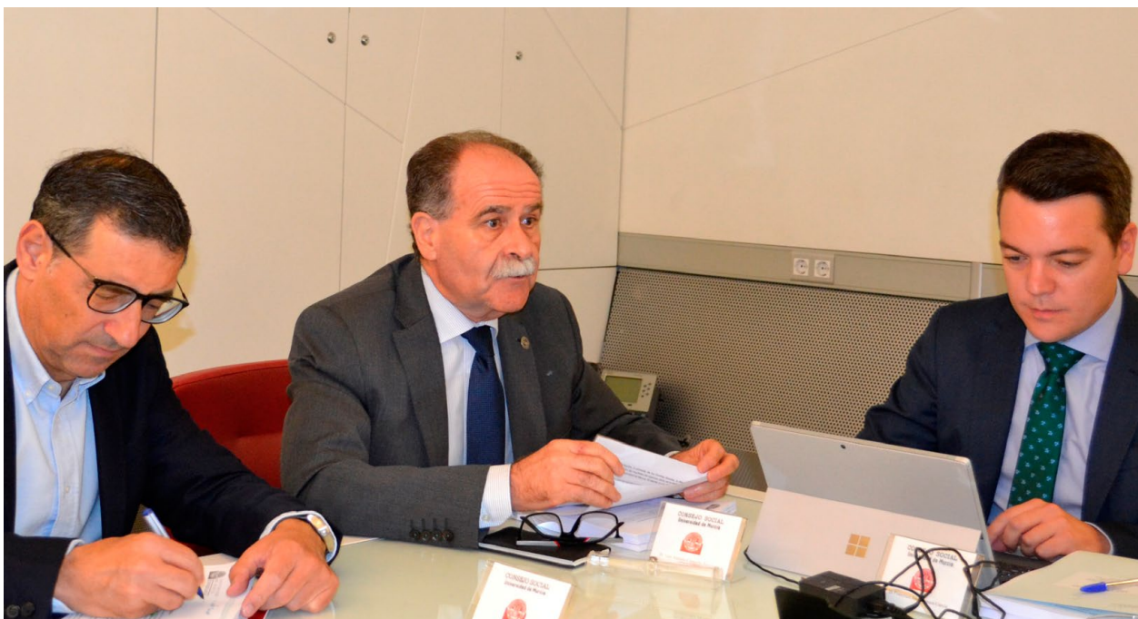
El Rector, el Presidente y el Secretario durante el desarrollo de una sesión del Pleno del Consejo Social de la Universidad de Murcia The Chancellor, the President and the Secretary during the development of an Ordinary Plenary Session of the Social Council of the University of Murcia