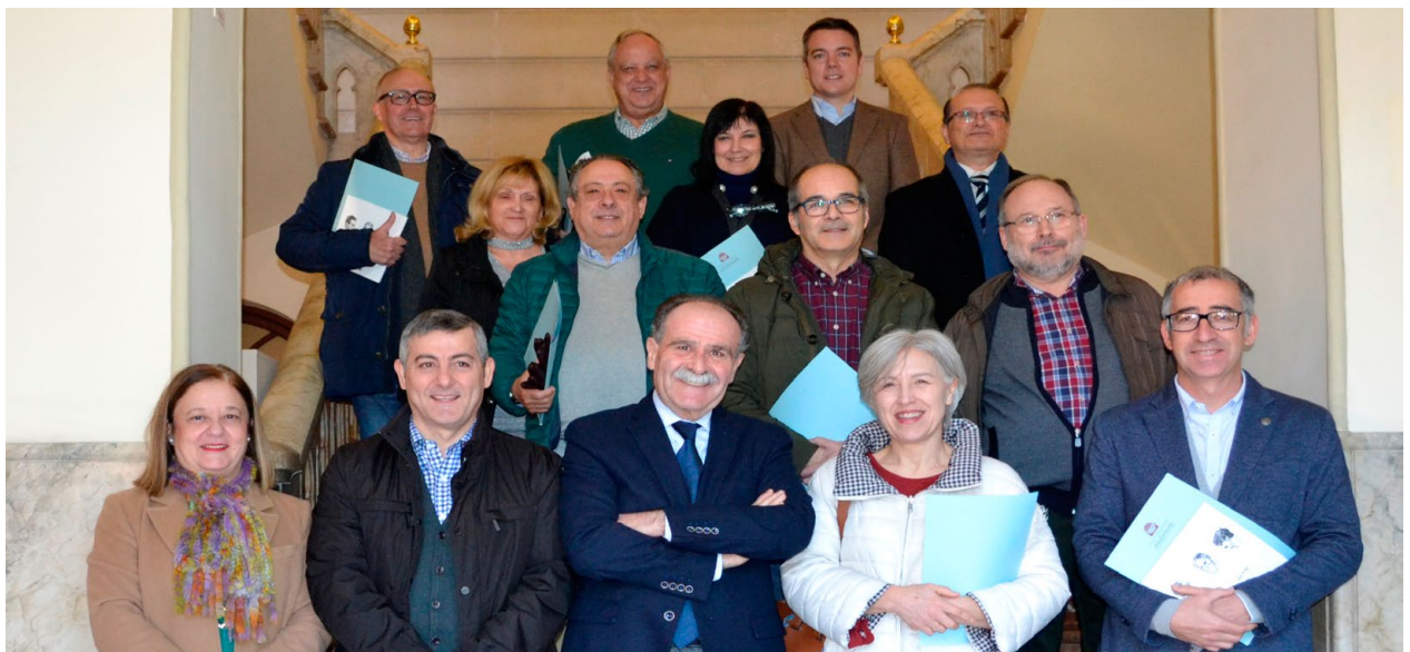
Jurado del Premio José Loustau 2018, entregado en Santo Tomas de Aquino 2019 / The jury of the José Loustau 2018 Award given in Saint Thomas Aquinas 2019