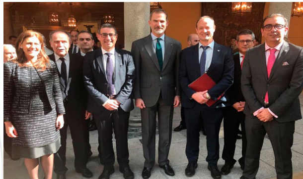
Junto a S.M. el Rey D. Felipe VI de España The President next to King Felipe VI of Spain