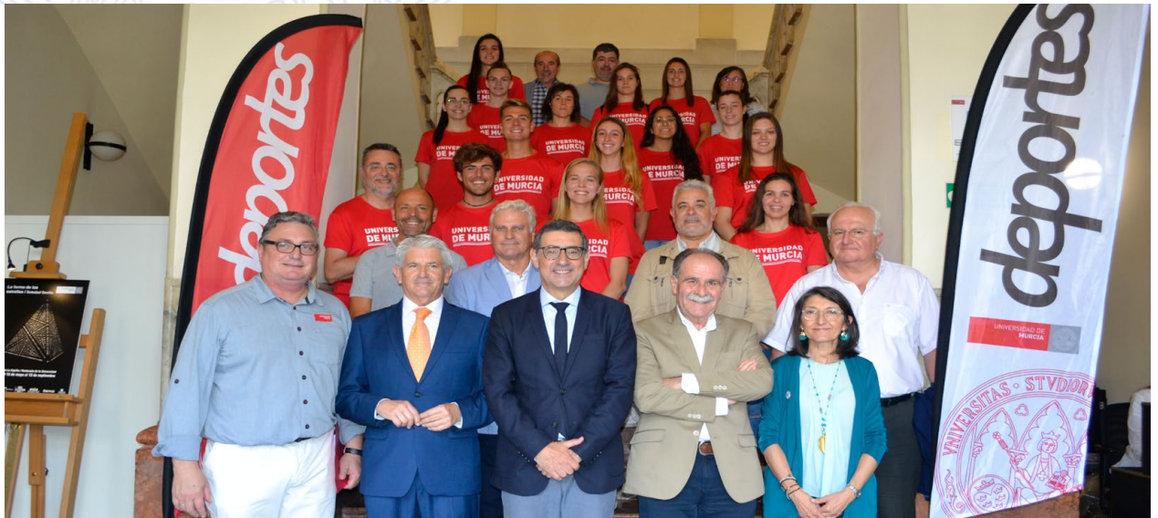
Recepción de Deportistas de la Universidad de Murcia / Reception of the Sport Team of the University of Murcia

Por otra parte, el Presidente ha asistido a numerosos foros, conferencias, jornadas, seminarios y almuerzos-coloquios relativos tanto a temas de interés académico como de interés socioeconómico, entre los que cabe destacar la transparencia, la sostenibilidad, los recursos hídricos, la empresa, la investigación y el desarrollo, la tecnología, la inversión, el sistema universitario, la economía, el sector financiero, la sociedad digital, la igualdad entre mujeres y hombres, la financiación autonómica, la trata de seres humanos y protección de las víctimas, la industria, el control de la corrupción, la alimentación o el deporte. También ha formado parte de los tribunales de valoración de distintos premios convocados en la Universidad de Murcia y por entidades de la sociedad murciana.