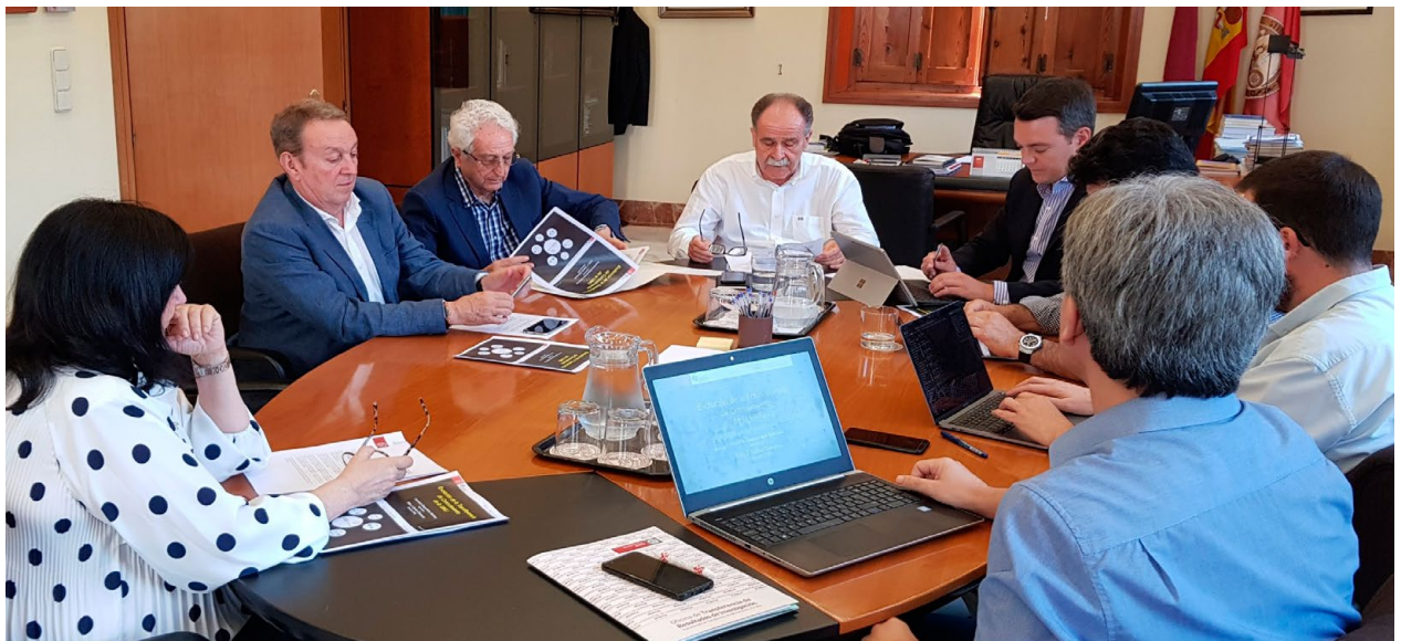
Reunión de la Comisión Económica del Consejo Social / Meeting of the Committee of Economic and Budgetary Affairs of the Social Council