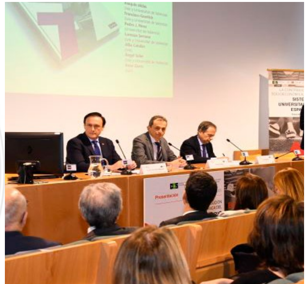
Seminario en materia Académica Seminar on Academic Matters

Especialmente destacado fue el pasado 3 de abril de 2019, cuando S.M. el Rey Felipe VI recibió en audiencia en el Palacio de la Zarzuela, al Comité Ejecutivo de la Conferencia de Consejos Sociales de las Universidades Españolas. Durante la misma, el Comité Ejecutivo transmitió a S.M. el Rey la “extraordinaria importancia de la universidad en la formación del talento, verdadero motor del desarrollo económico y del bienestar social”.