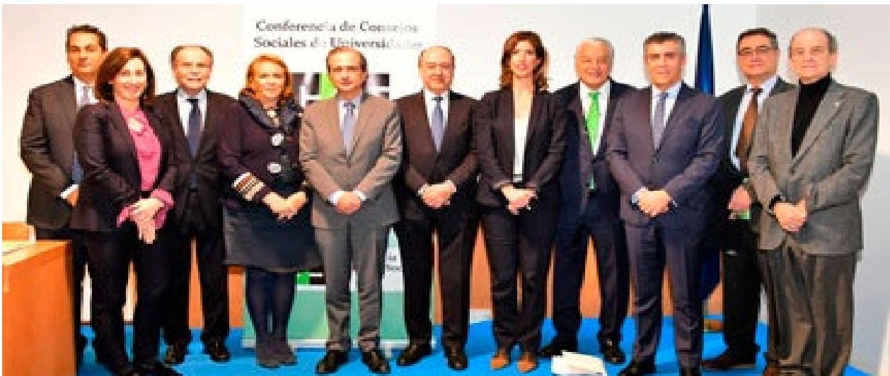
Comisión Ejecutiva de la Conferencia de Consejos Sociales de las Universidades Españolas The Executive Committee of the Conference of Social Councils of Spanish Universities

El Presidente del Consejo Social de la Universidad de Murcia continúa formando parte de la Comisión Ejecutiva de la Conferencia de Consejos Sociales, siendo uno de sus once miembros. Además, también es miembro de la Comisión Académica y de la Comisión de Transferencia y Relaciones con la Sociedad de dicha Conferencia de Consejos Sociales.