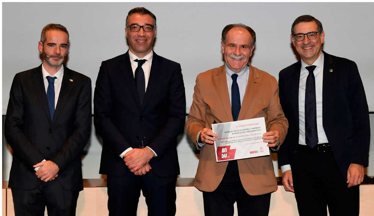
XX Aniversario de la Facultad de Economía y Empresa / XX Anniversary of the Faculty of Economics and Business

Also noteworthy is the President's assistance to awards ceremonies held in the Region, mostly of them related to business, innovation, knowledge and entrepreneurship, and inauguration ceremonies of different members of other institutions.