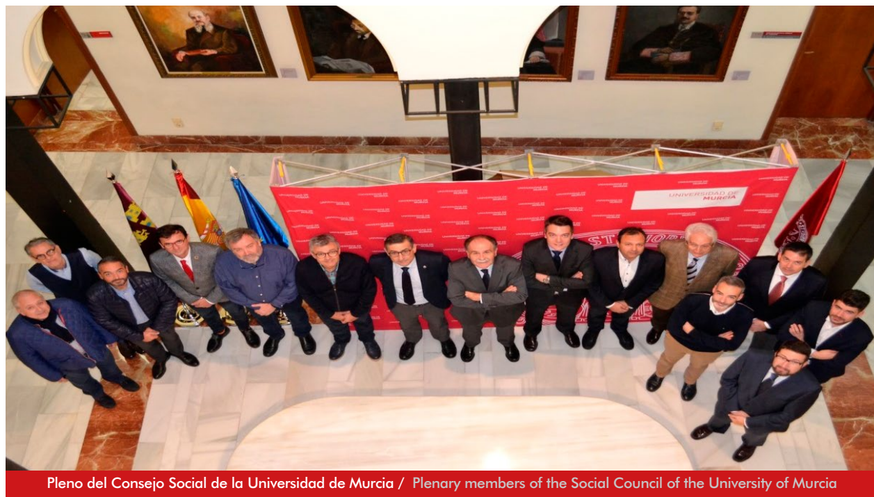
Pleno del Consejo Social de la Universidad de Murcia / Plenary members of the Social Council of the University of Murcia