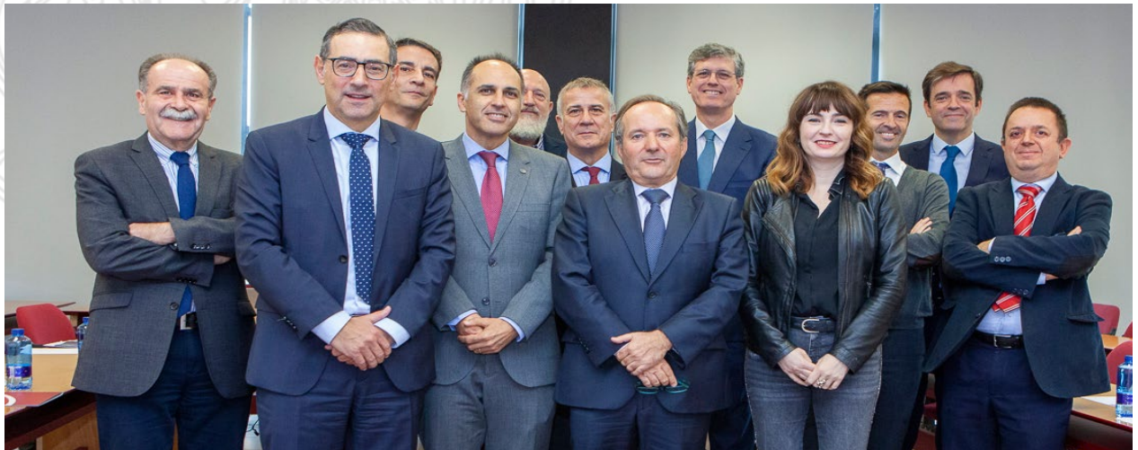
Reunión del Patronato Fundación Universidad Empresa de la Región de Murcia Meeting of the Board of Trustees of the University Business Foundation of the Region of Murcia