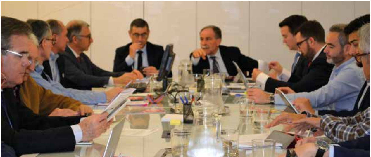
Sesión ordinaria de Pleno del Consejo Social | Ordinary Plenary Session of the Social Council

- Aprobación de la propuesta de Distribución de Becas Colaboración para el curso 2018/2019 del Ministerio de Educación y Formación Profesional, así como el límite máximo de 2 becas por Departamento.