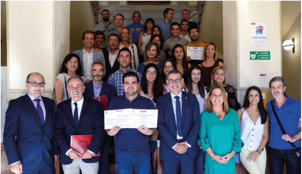
Mejor proyecto, Mejor idea de negocio | Best project Award, Best Business Idea Award