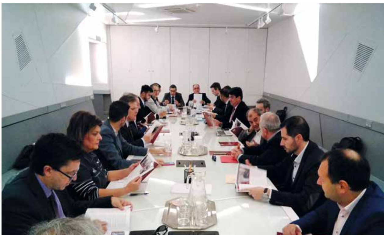
Sesión ordinaria del Pleno del Consejo Social | Ordinary Plenary Session of the Social Council

his position in the Social Council Plenary session held on October 10 th , 2018.