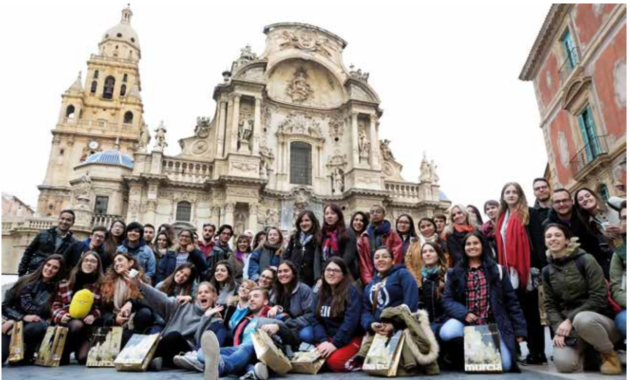
Bienvenida a estudiantes Internacionales en Plaza del Cardenal Belluga | International Students' welcome in Cardenal Belluga Square