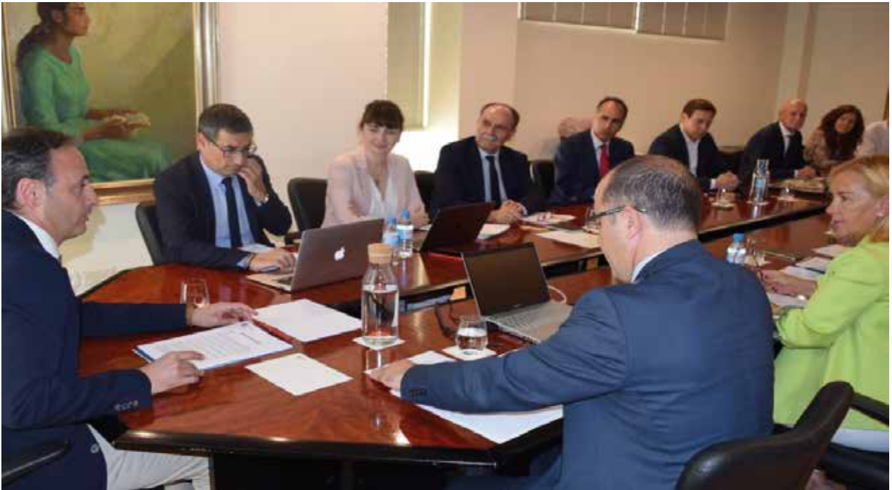
Consejo Interuniversitario de la Región de Murcia | Interuniversity Council of the Region of Murcia