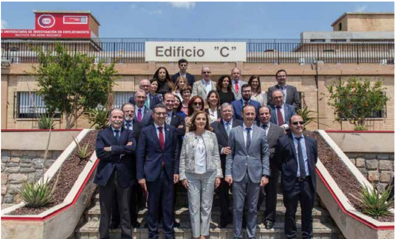
Visita al Instituto de Envejecimiento | Visit to the Aging Institute

En la ciudad de Murcia, el día 14 de diciembre de 2018, se reunió la Comisión de Valoración, con el objeto de fallar sobre los investigadores merecedores de los Premios 2018 a la Transferencia de Conocimiento en la Universidad de Murcia.