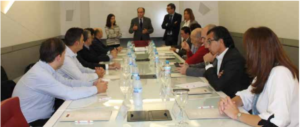
Desayuno con empresas del COIE | Breakfast with companies of the COIE

En diferentes reuniones mantenidas entre el Consejo Social y empleadores de la Región de Murcia, éstos nos han trasladado cierto desfase entre las competencias transversales requeridas por los empleadores y las aportadas por los egresados de nuestra Universidad. Es por esto que el Consejo Social ha considerado conveniente la adopción de decisiones para minimizar la brecha existente entre las competencias transversales adquiridas por el estudiantado y las demandadas por la sociedad.