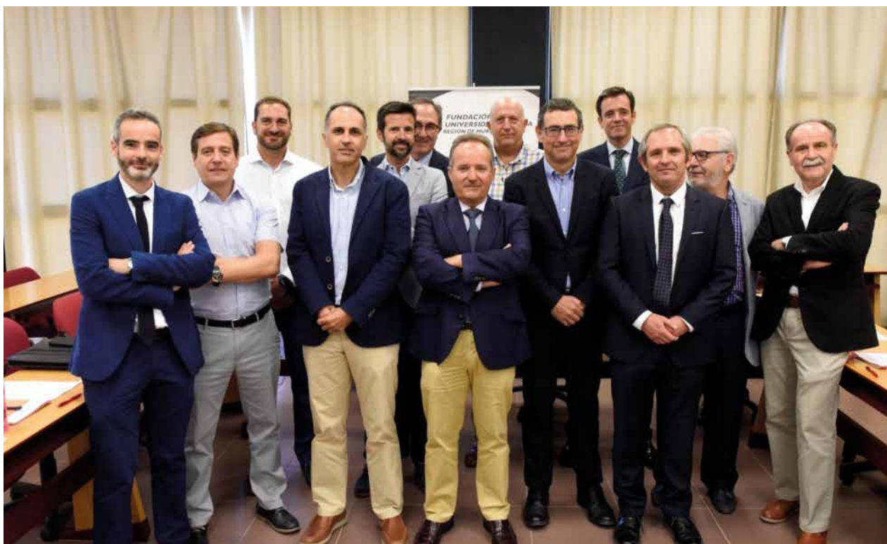
Reunión del Patronato FUEM | Board meeting of FUEM

The main objective of the University Business Foundation is promoting communication, dialogue and joint actions between the University and the companies, as well as the promotion and development of all kind of studies and research interesting for both institutions, thus contributing to the growth and development of the Region of Murcia. In this way, the Foundation develops its activity mainly through the School of Business Management and Business Administration (ENAE).