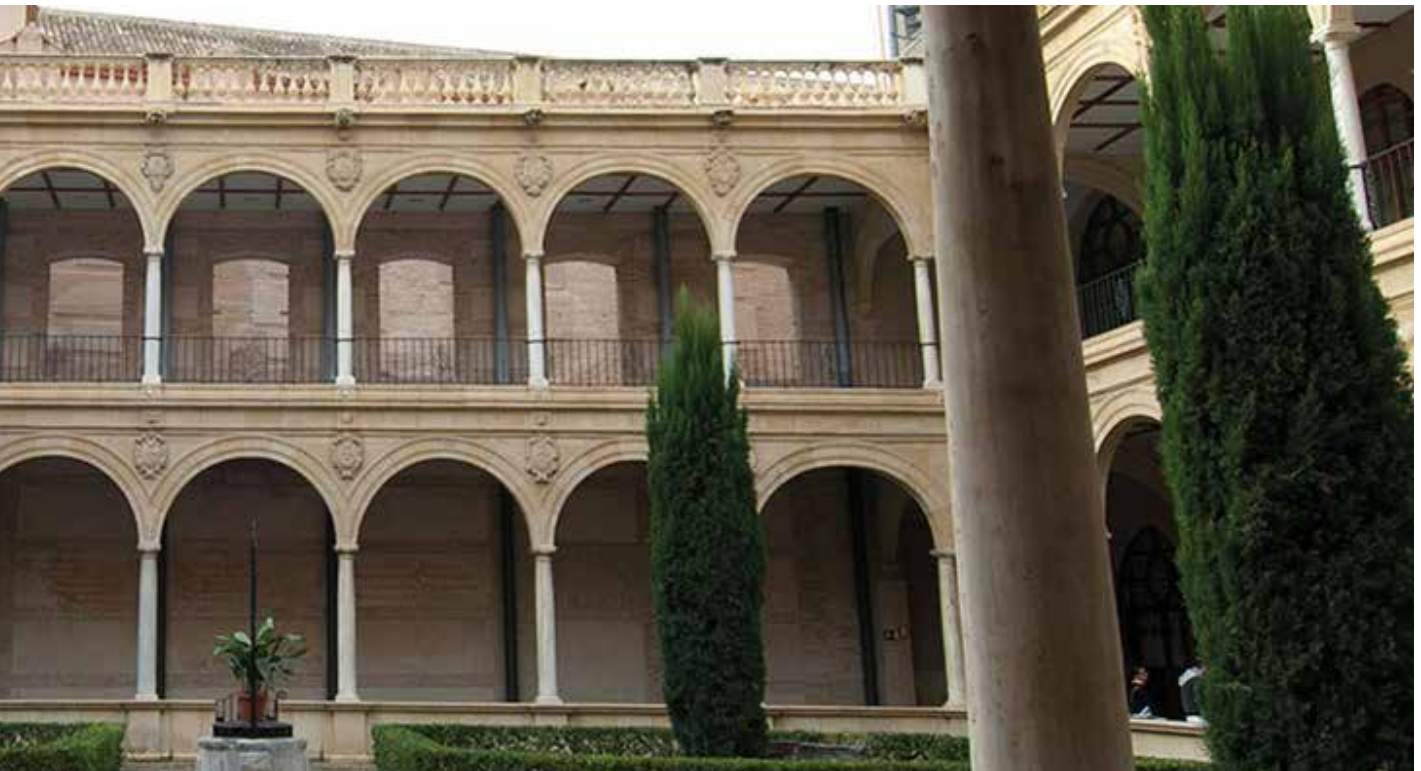
Patio de la Merced, Campus de Murcia | Courtyard of La Merced, Campus of Murcia