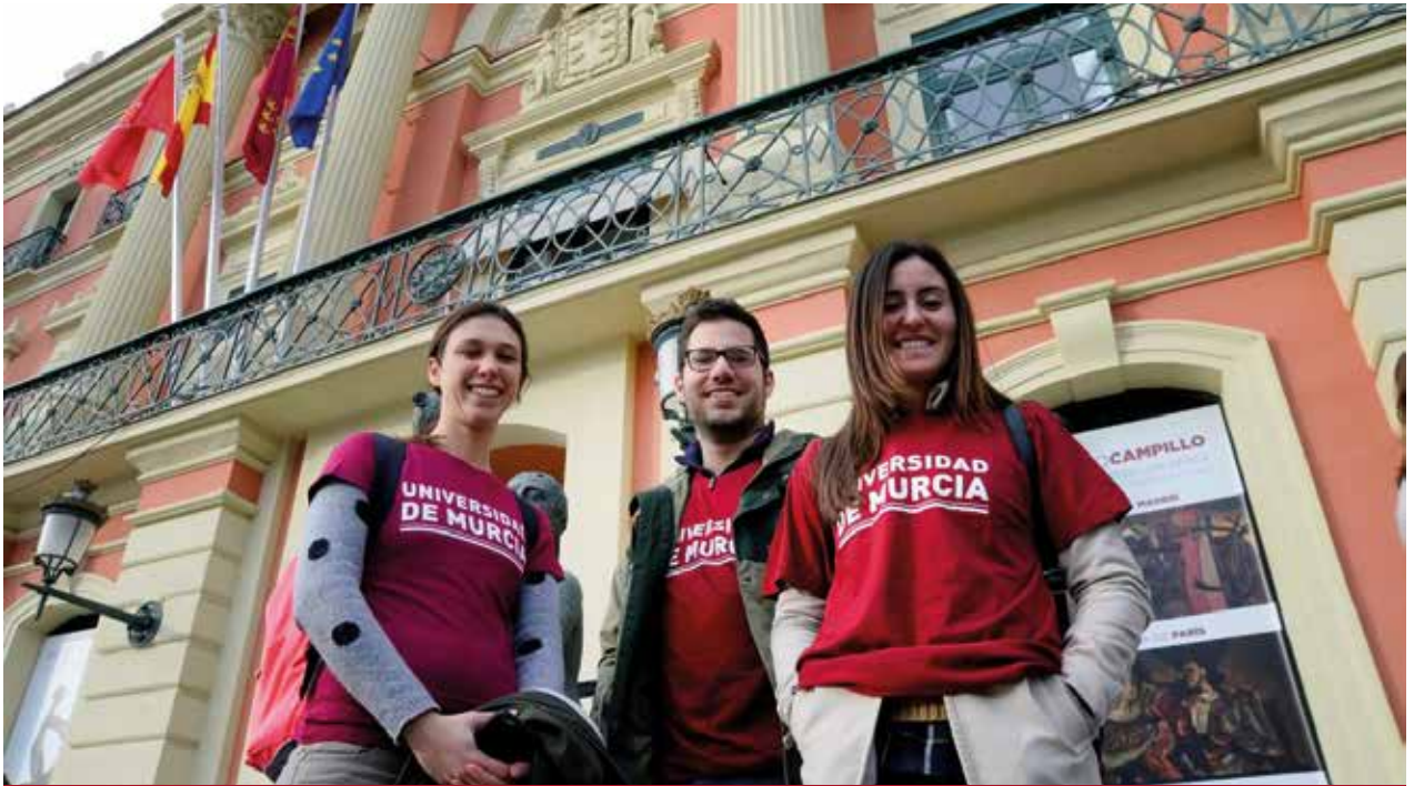
Bienvenida a estudiantes en el Ayuntamiento de Murcia | Students' welcome at the Town Hall of Murcia