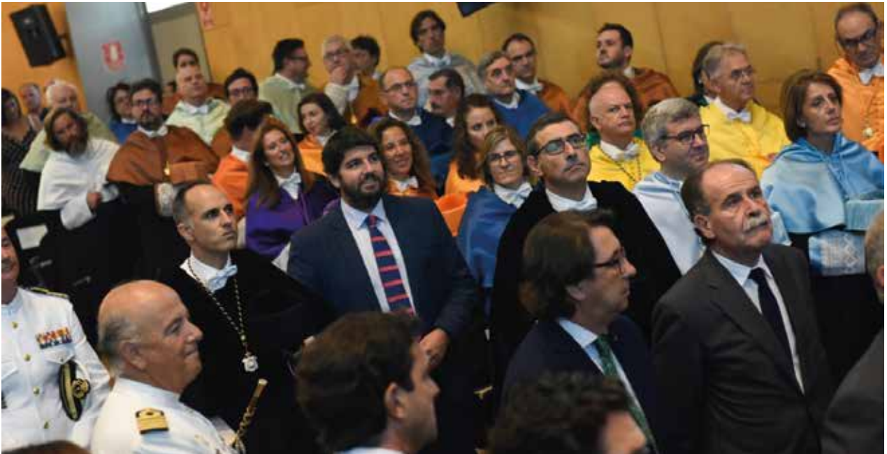
Apertura de Curso Académico 2018/2019 en la UPCT (Cartagena) | Opening act of 2018/2019 academic year in UPCT (Cartagena)

Con esta fórmula, la Universidad de Murcia podría obtener financiación para el desarrollo de diferentes actividades, canalizando la inversión en publicidad de las principales empresas de la Región de Murcia a través de un “acontecimiento de excepcional interés público”.