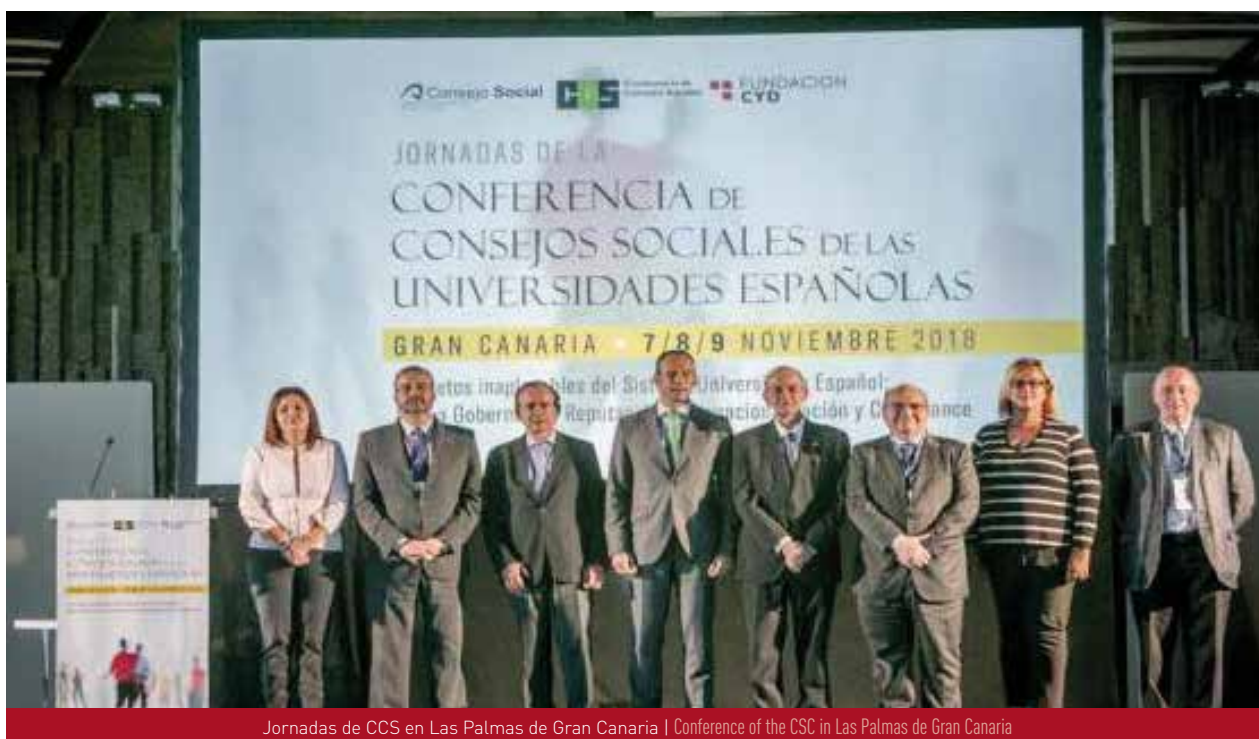
Jornadas de CCS en Las Palmas de Gran Canaria | Conference of the CSC in Las Palmas de Gran Canaria