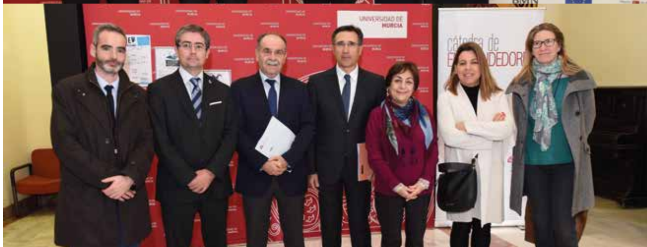
Presentación del programa "Inicia El Vuelo" | Presentation of the program "Inicia el Vuelo"