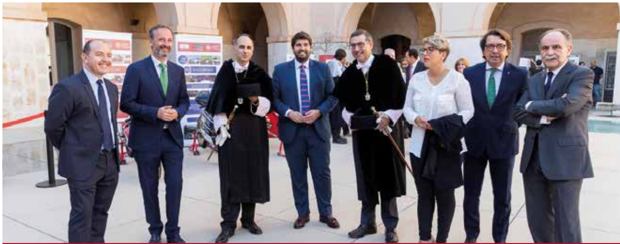
Apertura de Curso Académico en la UPCT (Cartagena) | Opening act of 2018/2019 academic year in UPCT (Cartagena)

On the other hand, the President has attended numerous forums, conferences, event-Days, seminars and luncheon-colloquiums related to matters of both academic and socio-economic interest, among which it is worth noting transparency, sustainability, water resources, business, research and development, technology, investment, the university system, economy, the financial sector, digital society, women, autonomic financing, human being trafficking and victim's protection, industry, the control of corruption, food or sports. He has also been part of the Selection Committees of the various awards called by the University of Murcia and by Murcian society companies.