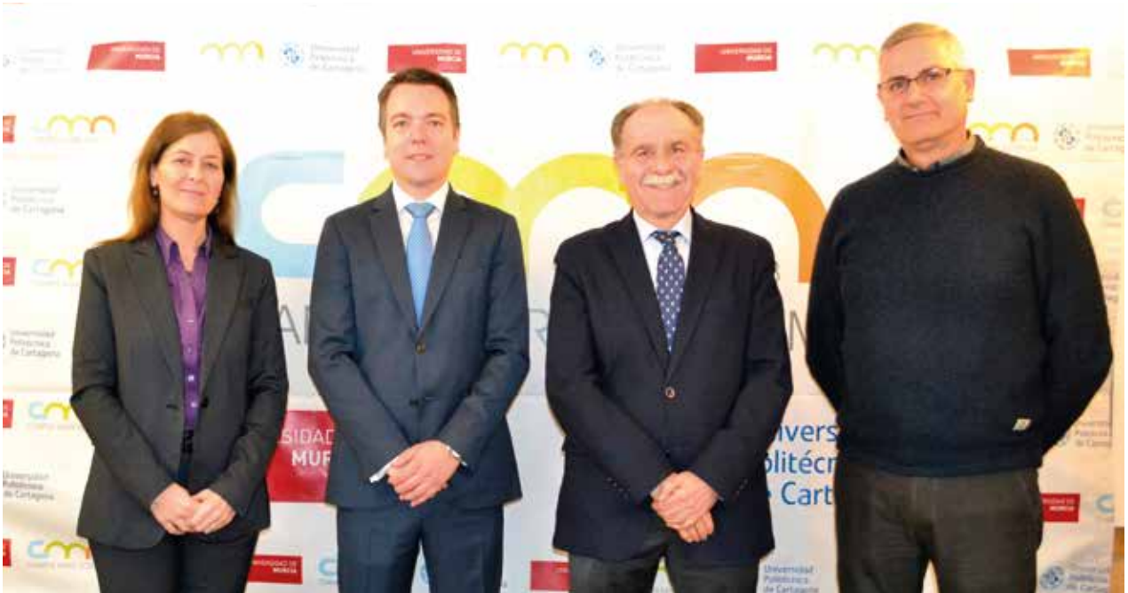
Secretaría del Consejo Social, junto al Presidente | Secretary-Office of the Social Council, beside the President