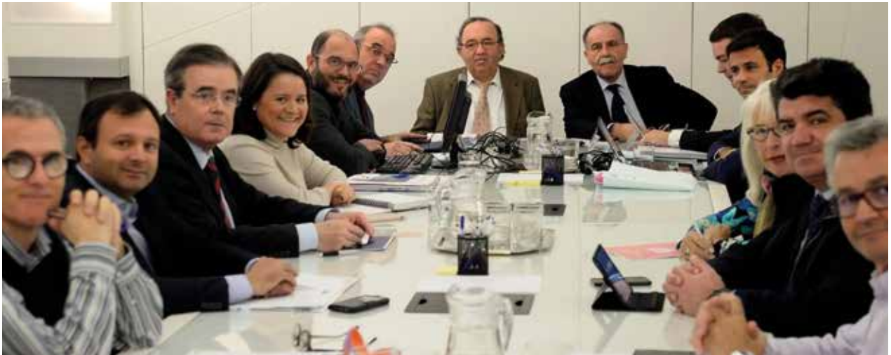
Sesión ordinaria de Pleno del Consejo Social | Ordinary Plenary Session of the Social Council