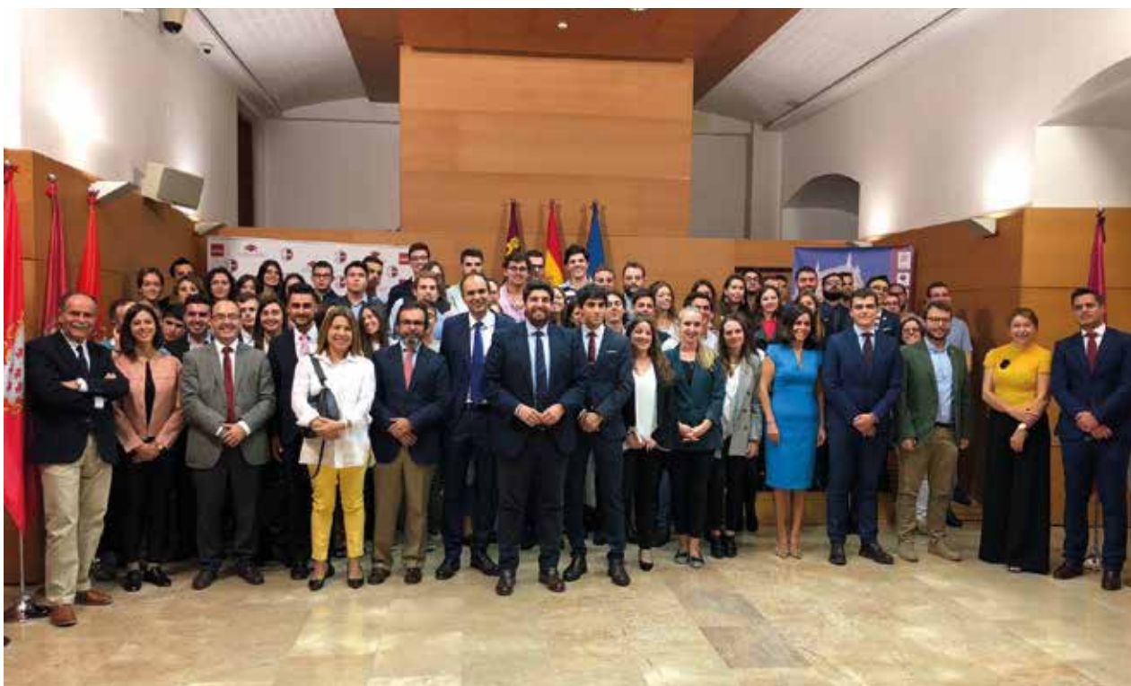
Inauguración del XVI Congreso Nacional de Estudiantes de Derecho | Opening Act of the XV National Congress of Law Students

and Services positions relation and its modifications, as well as the creation of scales in the Administration and Services staff and its modifications, according to the required qualification groups, in accordance with the public function general legislation. In any case, this information must specify the whole economic cost, which must be approved by the Autonomous Community.