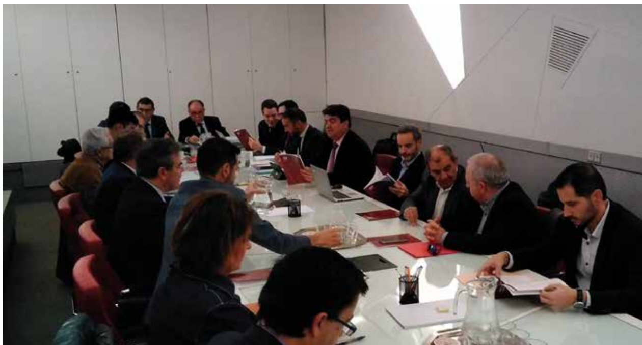
Sesión ordinaria del Pleno del Consejo Social | Ordinary Plenary Session of the Social Council