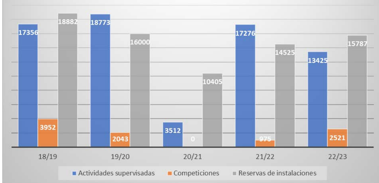
Ilustración 2: Evolución de inscripciones y reservas desde el curso 2018/19.