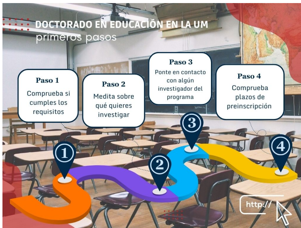
Figura 1: Primeros pasos a realizar en el Doctorado en Educación

Elaborar una Tesis Doctoral implica realizar un trabajo de investigación original y exigente en el que va a ser clave la persona que nos acompañe, ya sea como directora o como tutora. Aunque más adelante [Puntos 4 y 5] se explicará detenidamente la diferencia entre ambos roles, la figura del tutor se debe elegir en el mismo momento de la preinscripción por lo que es muy recomendable que la persona candidata al programa llegue a la preinscripción con un acuerdo verbal con un investigador que participe en este Programa de Doctorado (Figura 1).