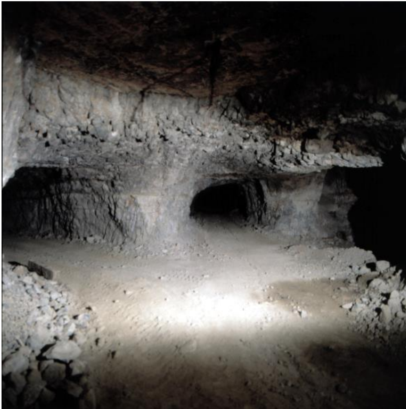
Sierra Lújar: encrucijada de galerías en San Luís.