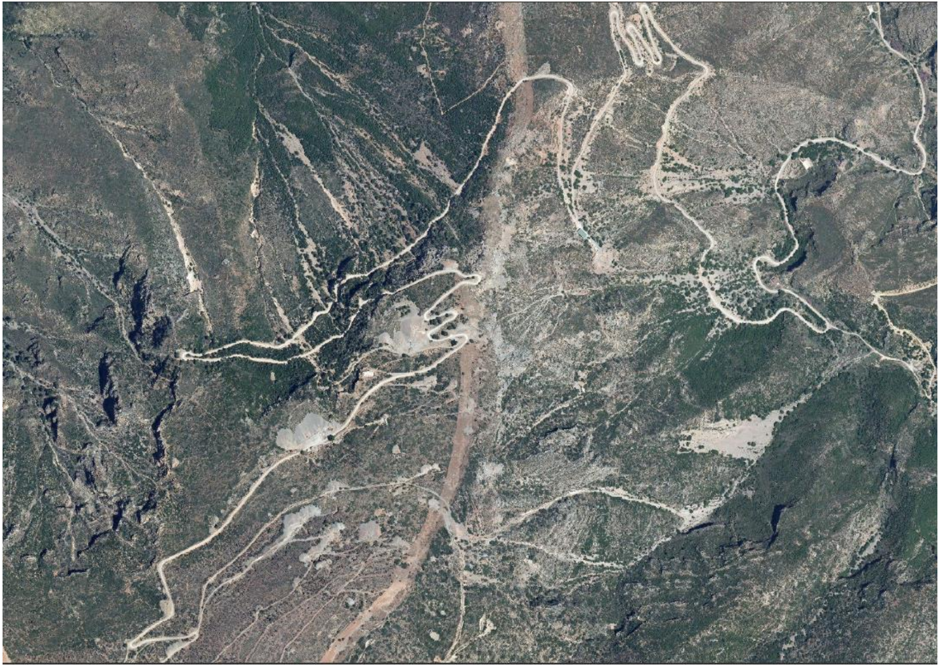
Sierra Lújar: San José, 2011