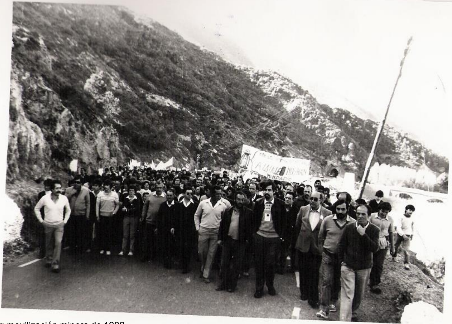
Sierra Lújar: movilización minera de 1982.