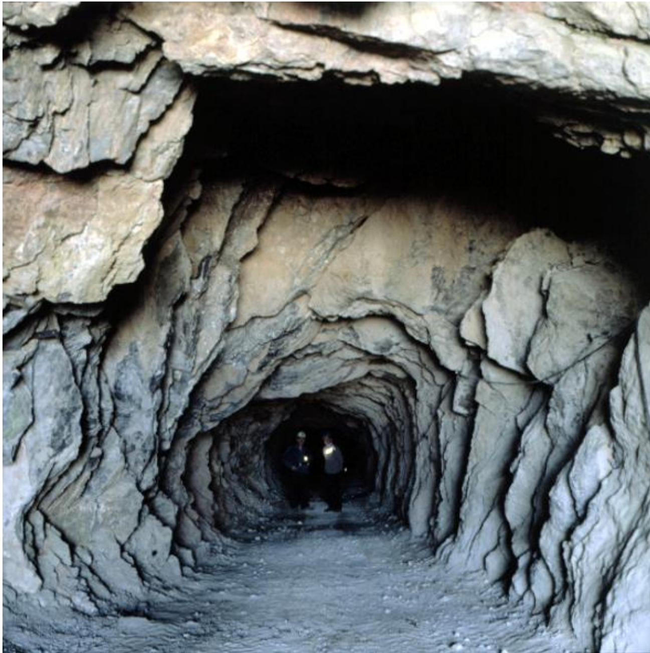
Sierra Lújar: galería principal de San Luís, 2001.