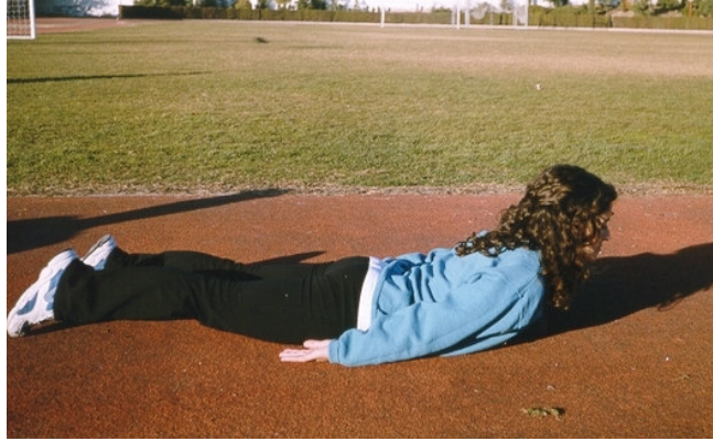
Figura 3. Extensión lumbar en decúbito prono, restringiendo el rango de movimiento.

eléctrica del erector spinae es bastante mayor y el índice de peligrosidad menor (39,60% versus 74,20%). De este modo, la extensión en decúbito prono, de menor rango de movimiento que la circunducción, es menos peligrosa y más eficaz (Lisón y Sarti, 1998).