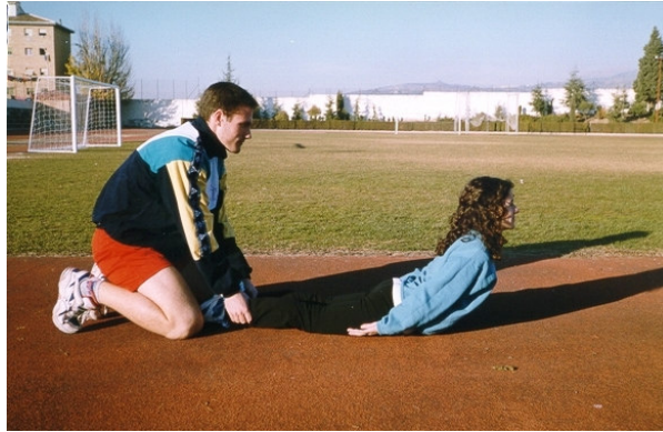
Figura 1. Elevación del tronco desde decúbito prono sobre superficie horizontal y fijación distal en los pies.

En la sala de musculación puede realizarse el ejercicio en la máquina de hiperextensiones, en decúbito prono con los talones en los rodillos y apoyando el pubis en el soporte, de manera que sobresalga todo el tronco. Desde ahí, se flexiona la pelvis por las articulaciones coxofemorales, manteniendo la espalda totalmente recta, para subir seguidamente hasta pasar unos veinte grados de la horizontal (Pérez y cols., 1997).