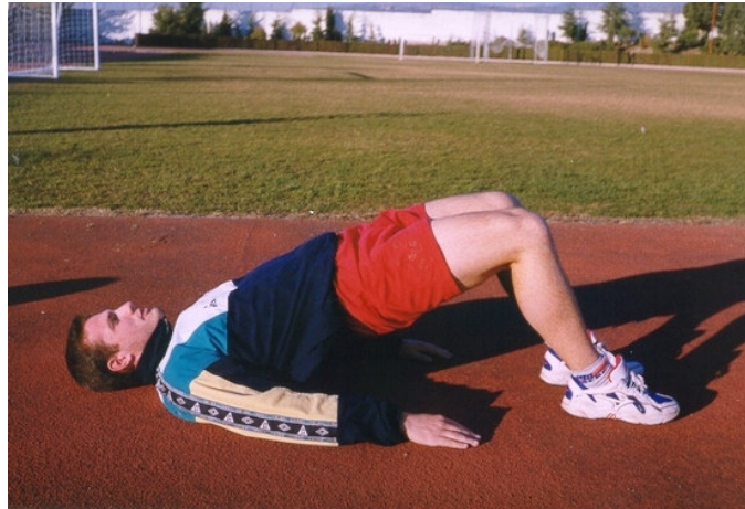
Figura 5. Elevación de pelvis hasta formar una línea entre tronco y muslos.

Otro ejercicio aconsejado por Callaghan y cols. (1998) e Ybáñez y cols. (1999) es la extensión coxofemoral y escápulo-humeral contralateral desde cuadrupedia (cuadrupedia). Del análisis de la efectividad muscular y sobrecarga espinal concluyen que este ejercicio es adecuado para proveer resistencia muscular lumbar al erector spinae produciendo una baja carga en el raquis lumbar.