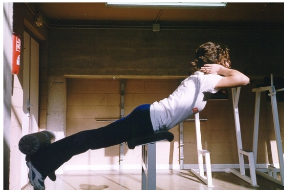
Figura 2. Extensión lumbar en banco romano.

En la sala de musculación puede realizarse el ejercicio en la máquina de hiperextensiones, en decúbito prono con los talones en los rodillos y apoyando el pubis en el soporte, de manera que sobresalga todo el tronco. Desde ahí, se flexiona la pelvis por las articulaciones coxofemorales, manteniendo la espalda totalmente recta, para subir seguidamente hasta pasar unos veinte grados de la horizontal (Pérez y cols., 1997).