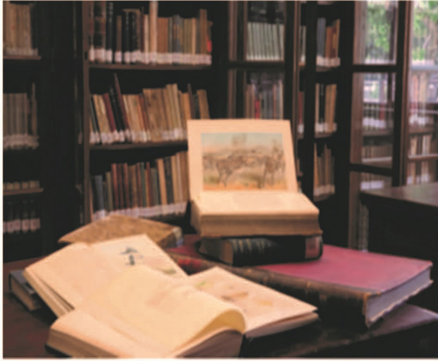
Biblioteca. Fondo bibliográfico del Instituto-Escuela en el Instituto Isabel la Católica

El Instituto-Escuela fue un proyecto educativo de la Junta para Ampliación de Estudios e Investigaciones Científicas (JAE) que contó con el apoyo del Ministerio de Instrucción Pública. Como tal, vino a sumarse a las iniciativas que la JAE, bajo la presidencia de Santiago Ramón y Cajal, había puesto en marcha en las primeras décadas del siglo xx, con el fin de impulsar el progreso científico, cultural y educativo que hiciera posible la modernización de la sociedad española. El Instituto-Escuela era un centro oficial y su carácter innovador se explica porque desde su creación en Madrid, en 1918, funcionó como un laboratorio pedagógico al que se le asignaron dos importantes cometidos: ensayar la reforma de la enseñanza secundaria y formar pedagógicamente a los profesores que debían llevarla a cabo.