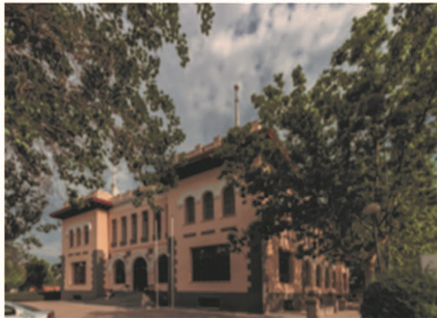
Vista exterior del Instituto-Escuela Sección Retiro (actual IES Isabel la Católica)

Inscripción previa en la Semana de la Ciencia 2019 en la web www.divulgauned.es