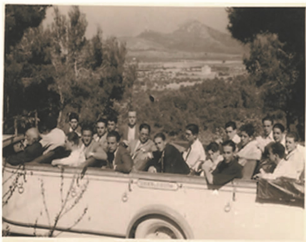
Alumnos del Instituto-Escuela de excursión en Baleares.

El Instituto-Escuela basó su sistema de enseñanza en la experiencia educativa de la Institución Libre de Enseñanza (ILE) y en las corrientes pedagógicas europeas más avanzadas de su tiempo. Contó con un plan de estudios propio que aumentó las horas lectivas de cada materia, redujo el número de alumnos por clase, combinó los aprendizajes en el aula con las prácticas en los laboratorios, reforzó la enseñanza de los idiomas, prestó una gran atención a la formación estética, musical y deportiva de los alumnos, implantó la evaluación continua y fomentó el uso de la biblioteca. También contempló un amplio repertorio de actividades, como las visitas a museos y fábricas, las excursiones por España y el extranjero, y los intercambios con alumnos de otros centros europeos. El experimento del Instituto-Escuela se truncó en 1936, con el estallido de la Guerra Civil.